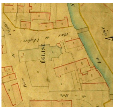
Extrait du cadastre de 1852 (DGI).