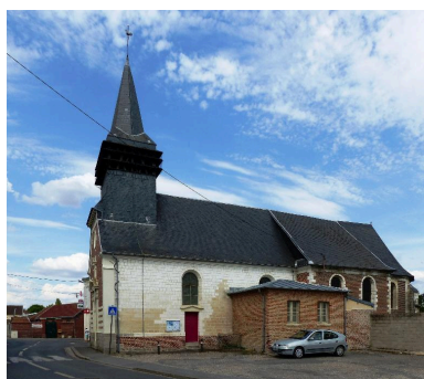
Vue de la façade sud.