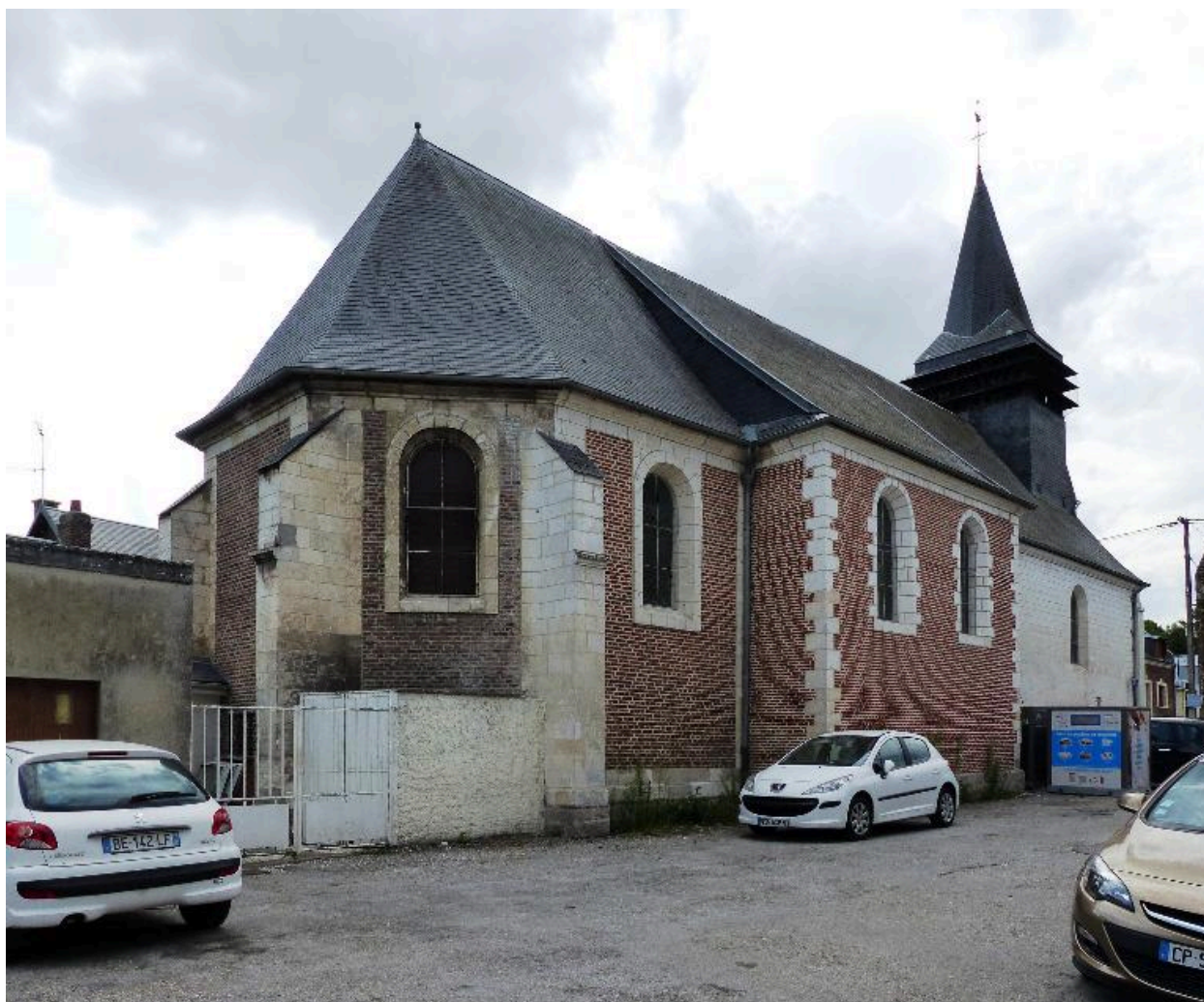
Vue depuis le nord-est.