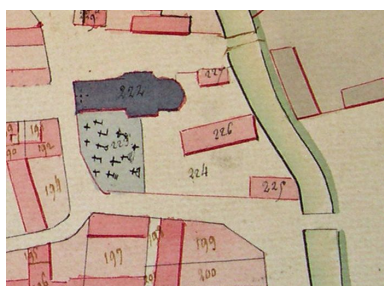
Extrait du cadastre de 1813 (AD Somme). IVR22_20058010454NUCA