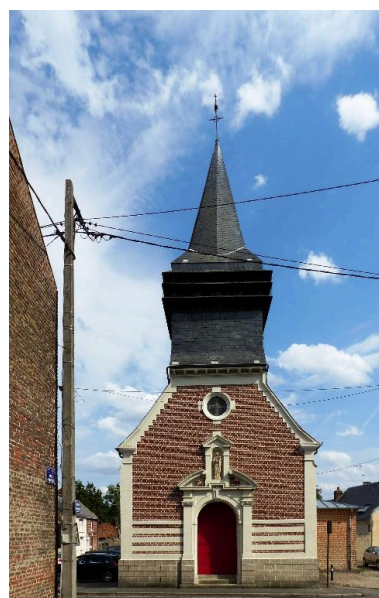
Vue de la façade antérieure.