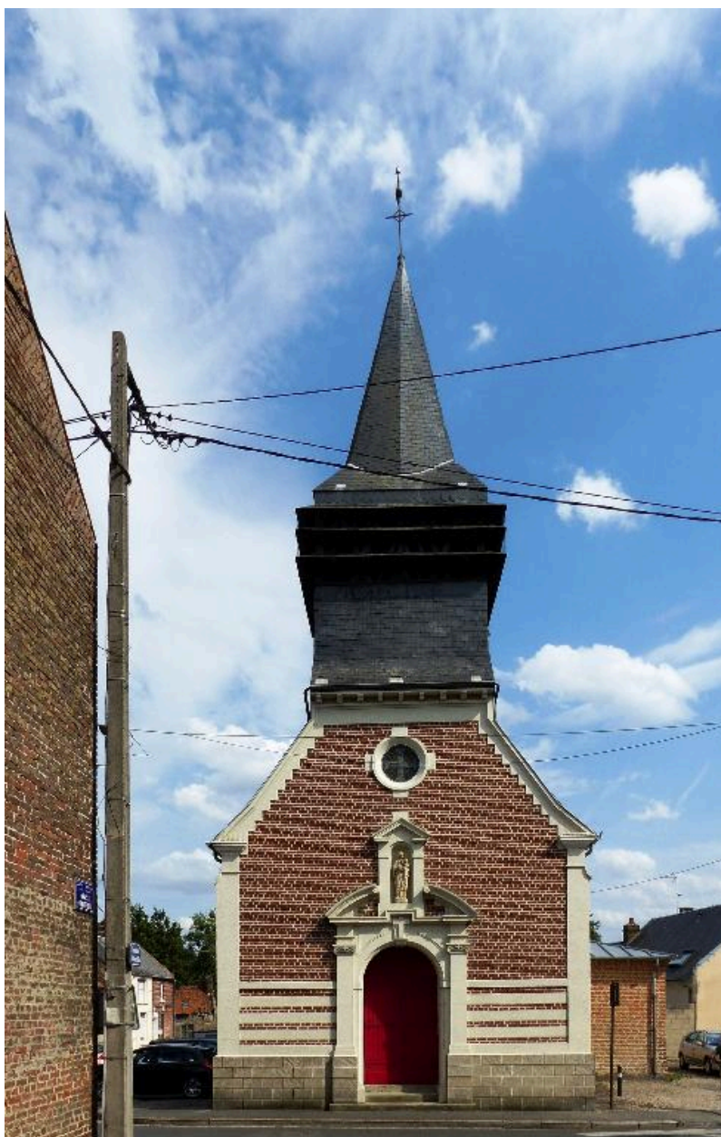
Vue de la façade antérieure.