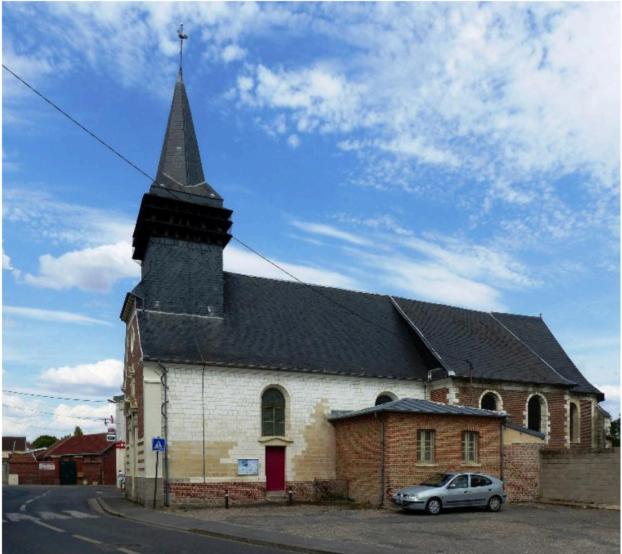
Vue de la façade sud.