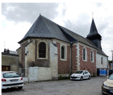
Vue depuis le nord-est. IVR32_20178005108NUCA