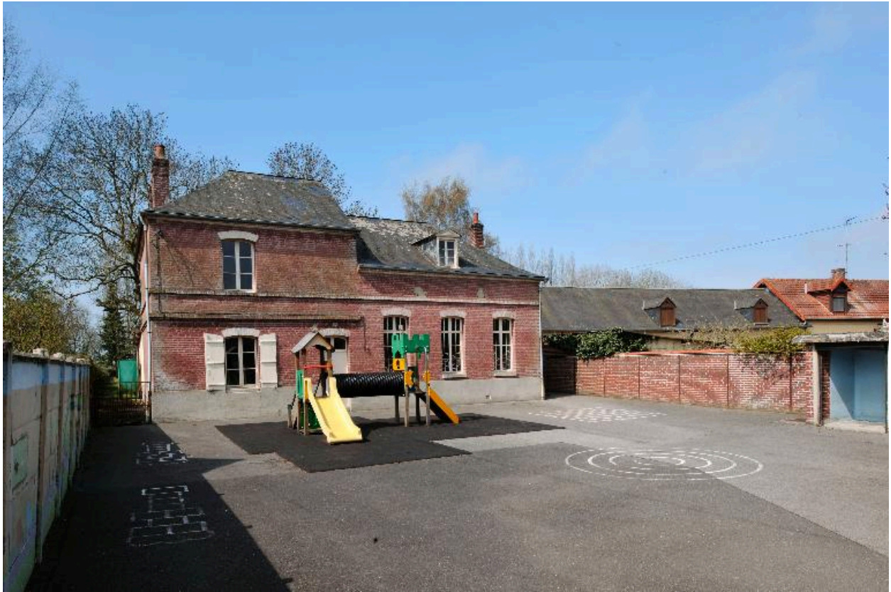
Vue générale depuis la cour.