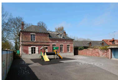
Vue générale depuis la cour.

IVR22_20138000243NUC2A