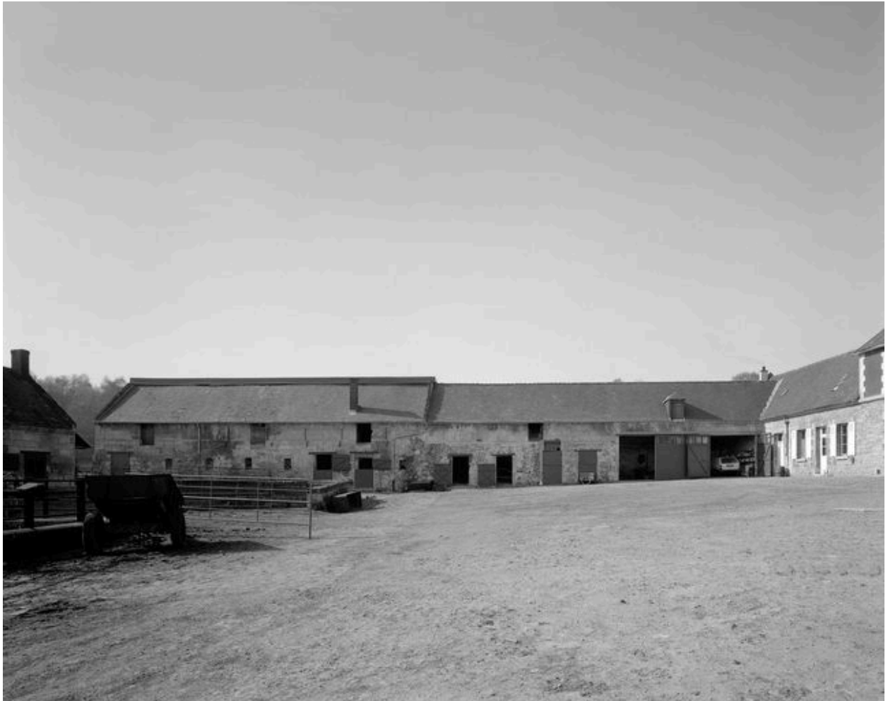
Porcherie, étable à chevaux, depuis la cour.