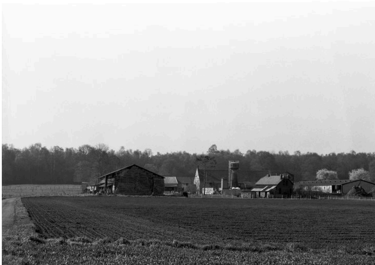
Vue de situation.