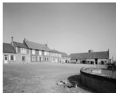
Logis et grange, depuis la cour. IVR22_19856000580V