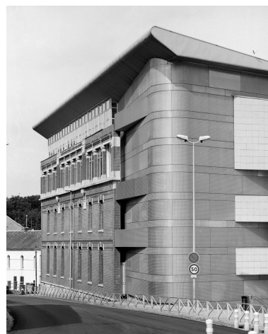
La façade des anciens bureaux de l'usine du Tilleul intégrée dans des bureaux du lycée André Lurçat. IVR31_20025901880X