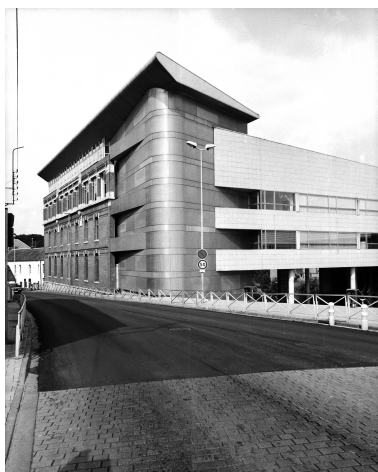
Vue générale de trois quarts des bureaux du lycée André Lurçat. IVR31_20025901879X