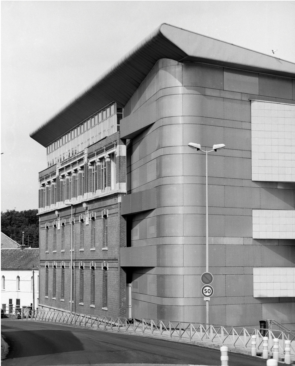
La façade des anciens bureaux de l'usine du Tilleul intégrée dans des bureaux du lycée André Lurçat.