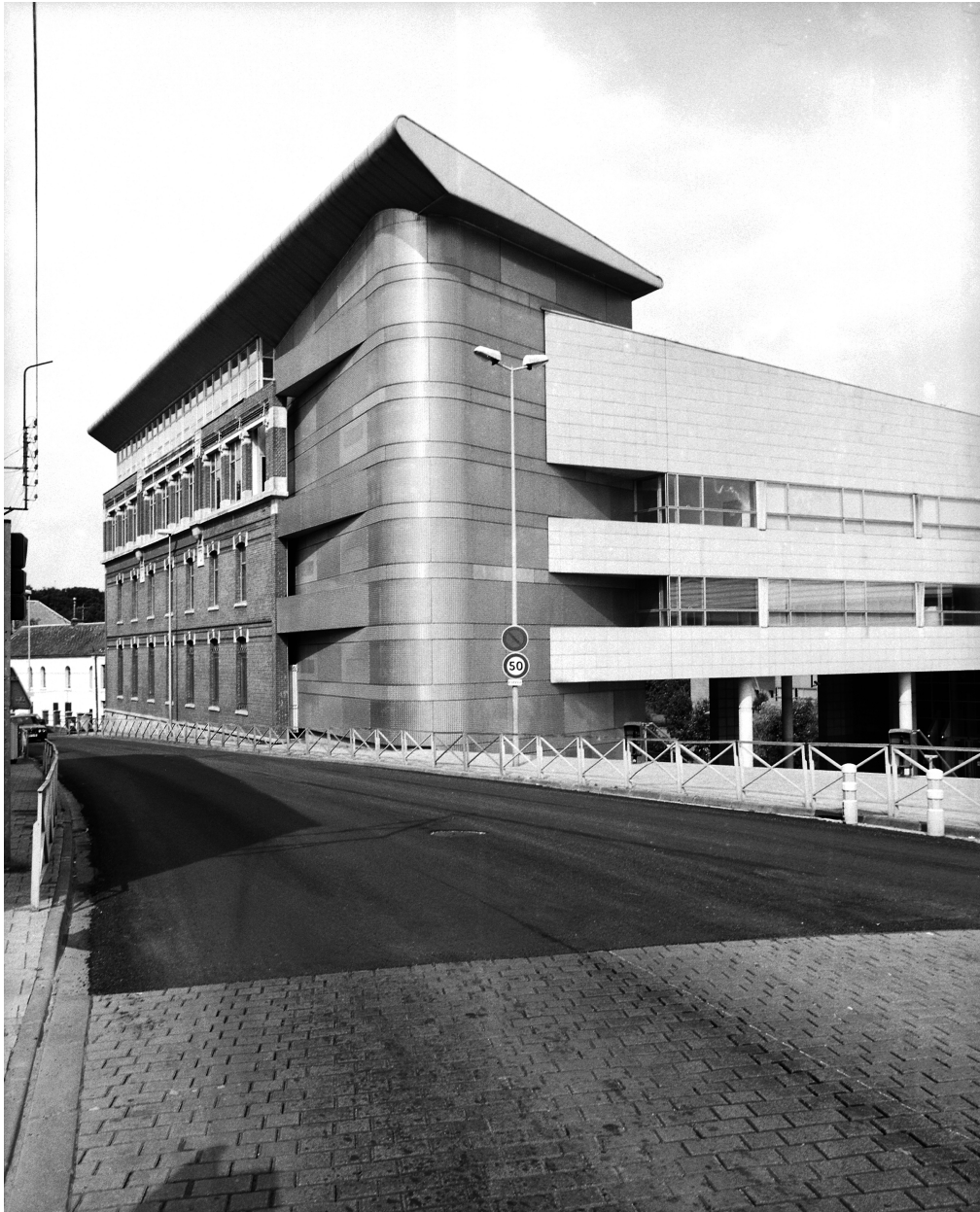
Vue générale de trois quarts des bureaux du lycée André Lurçat.