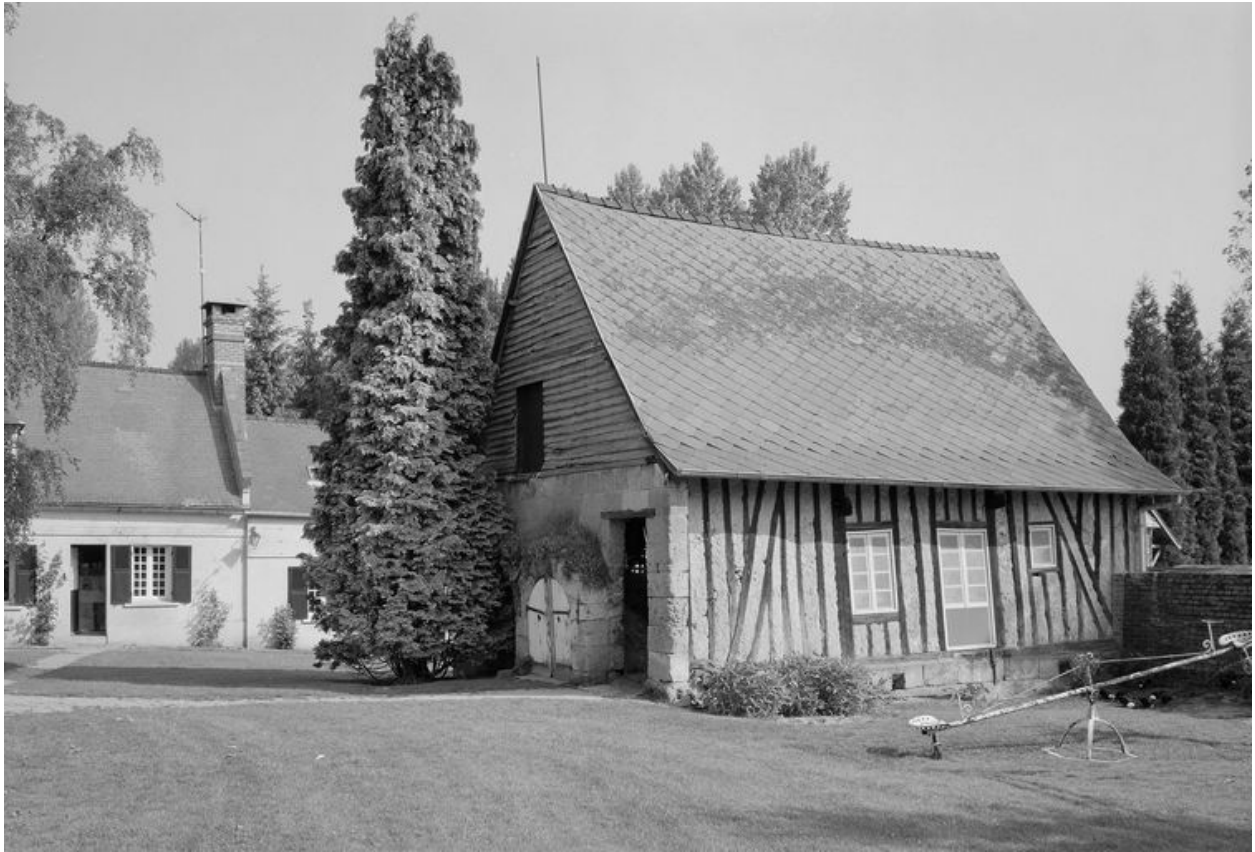
Logis et grange. Vue générale.