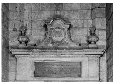
Détail de la partie supérieure.

IVR22_19970200189V