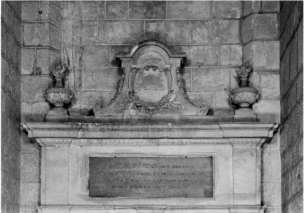
Détail de la partie supérieure.