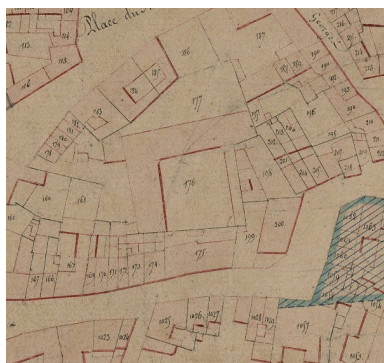
Extrait du cadastre napoléonien. Section B (AD Somme ; 3P2065/4).

IVR32_20218005255NUCA