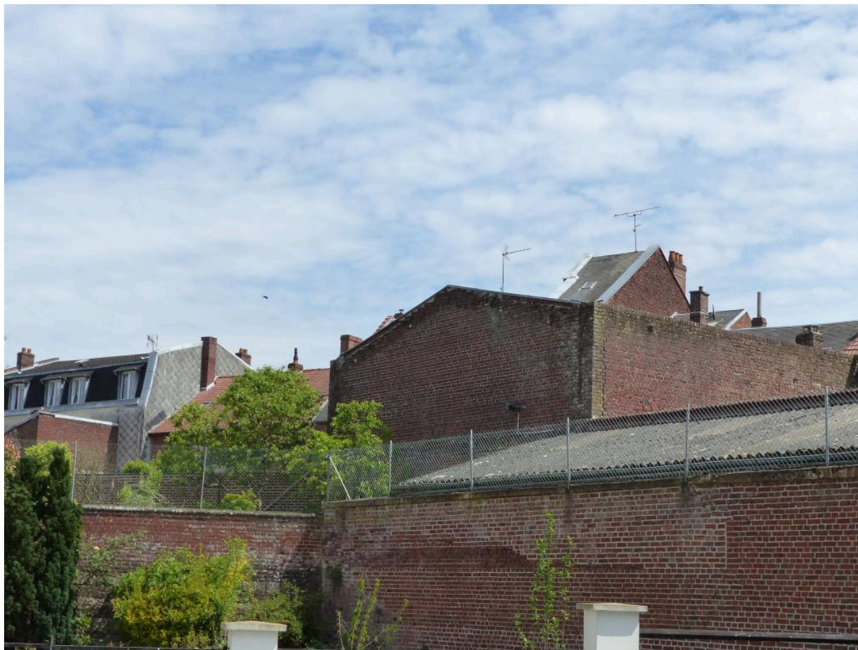
Vestiges de la salle d'audience de l'ancien palais de justice.