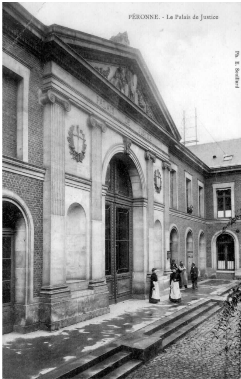
Péronne. Le palais de justice. Carte postale, début 20e siècle (AD Somme ; 8FI 4655).