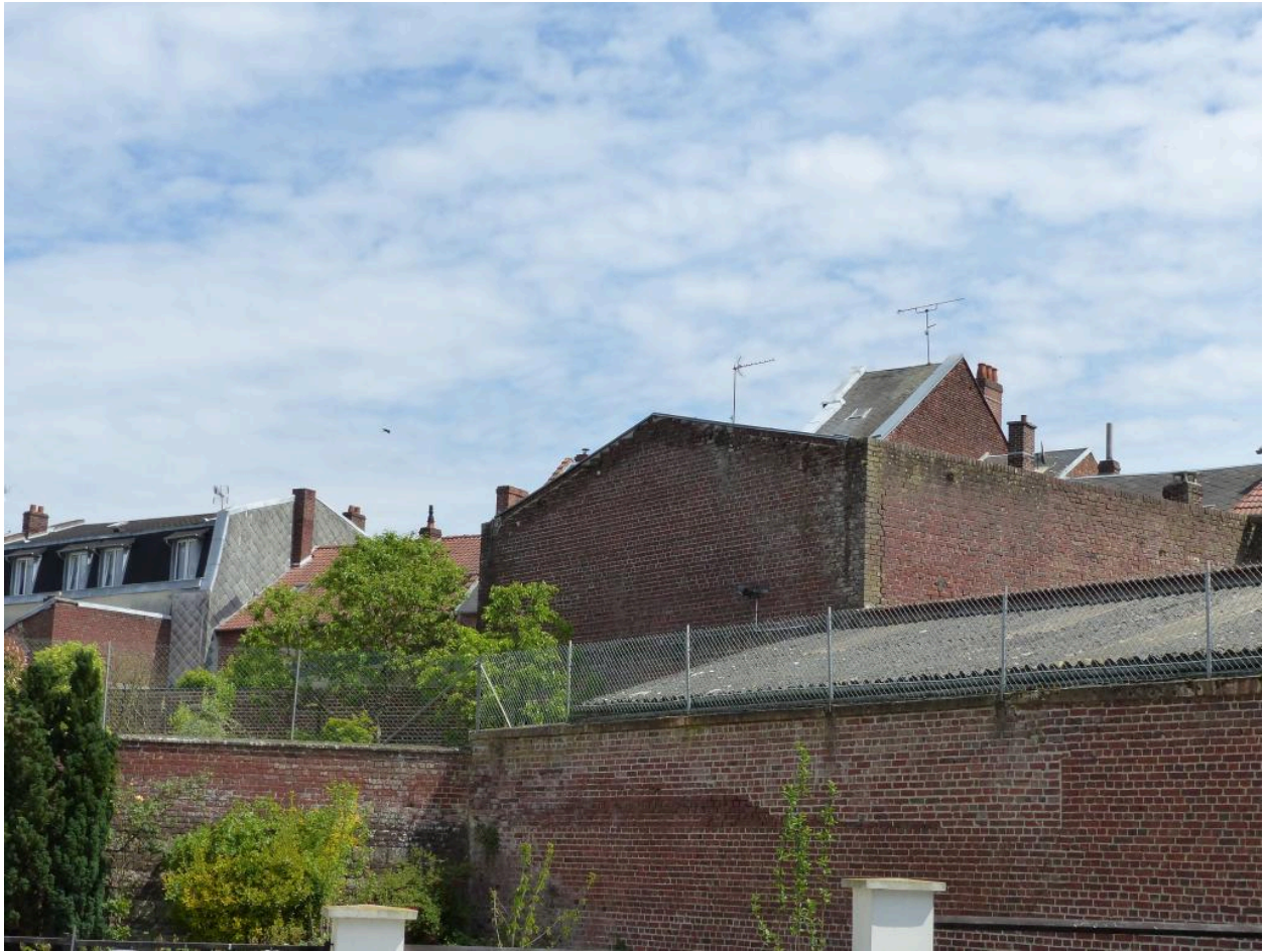
Vestiges de la salle d'audience de l'ancien palais de justice.