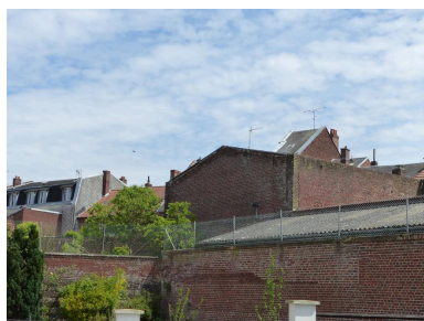
Vestiges de la salle d'audience de l'ancien palais de justice.

Phot. Archives départementales de la Somme IVR32_20228005061NUCA