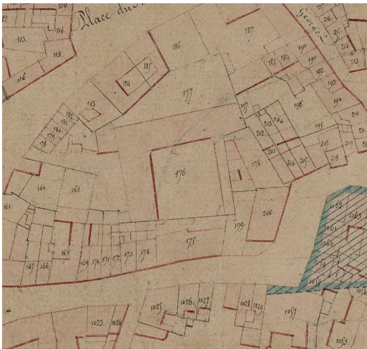
Extrait du cadastre napoléonien. Section B (AD Somme ; 3P2065/4).