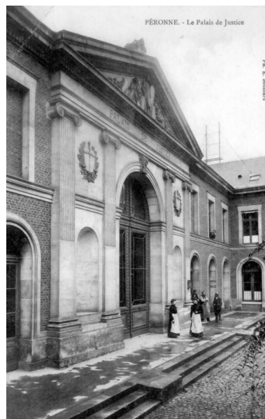
Péronne. Le palais de justice. Carte postale, début 20e siècle (AD Somme ; 8FI 4655).

Phot. Archives départementales de la Somme IVR32_20228005062NUCA