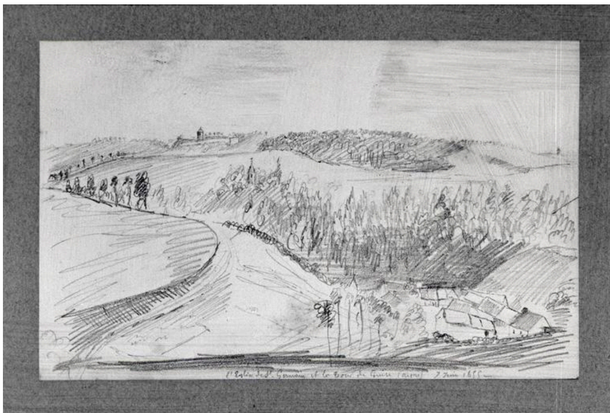
Vue du dessin.