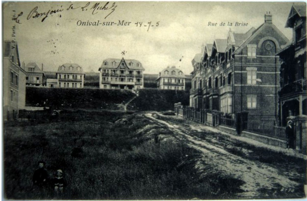
Vue d'ensemble, carte postale, 1er quart 20e siècle (coll. part.).