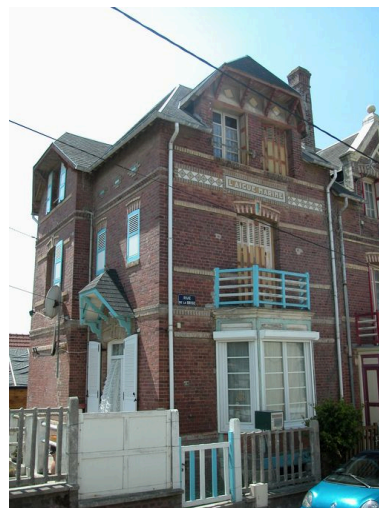
Vue d'ensemble depuis la rue. IVR22_20048001682NUCA