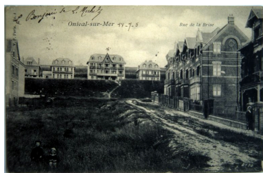
Vue d'ensemble, carte postale, 1er quart 20e siècle (coll. part.). IVR22_20058000589XAB