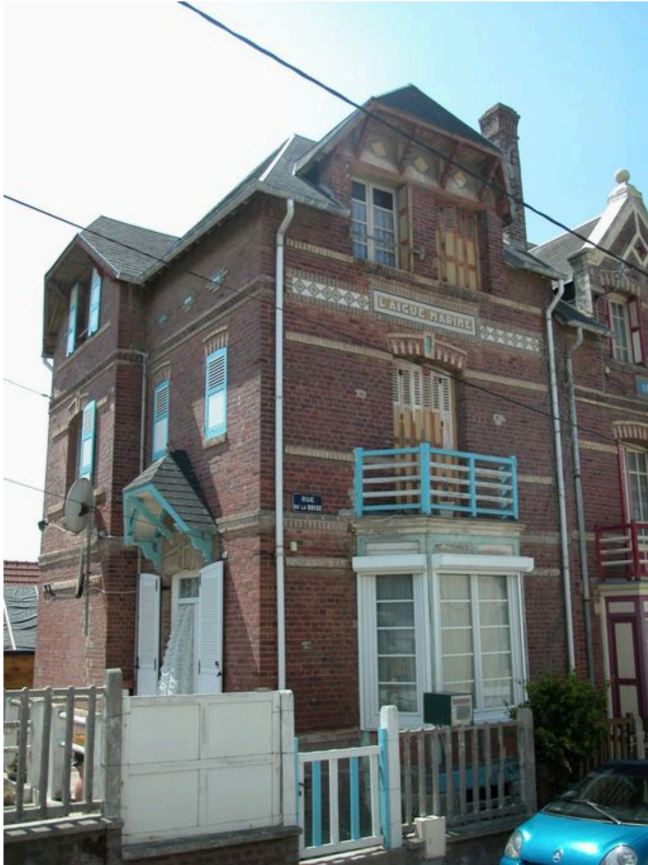
Vue d'ensemble depuis la rue.