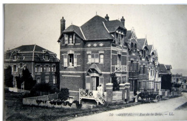
Vue ancienne, carte postale, 1er quart 20e siècle.