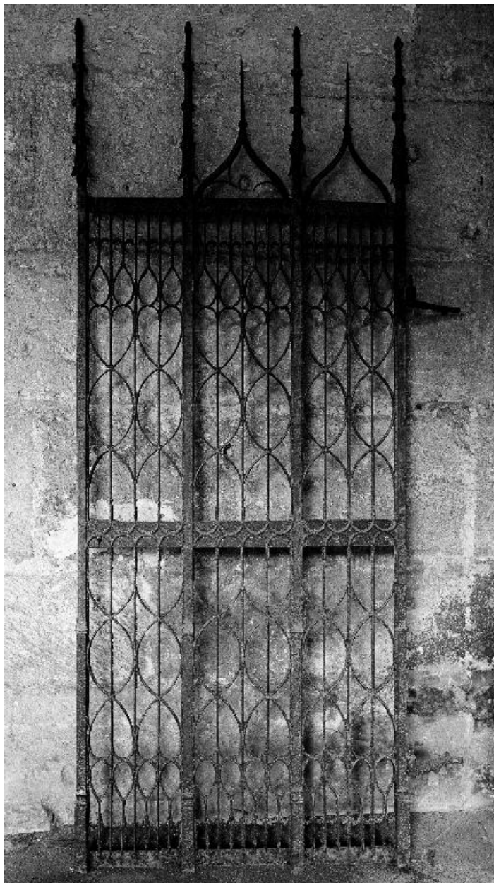
Vue d'un élément mobile de la clôture de chœur.