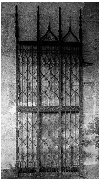
Vue d'un élément mobile de la clôture de chœur. IVR22_19966003777V