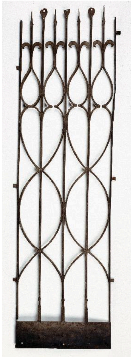
Vue d'un élément fixe de la clôture de choeur.