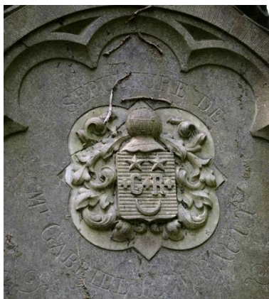
Vue de détail sur le décor sculpté en marbre blanc.