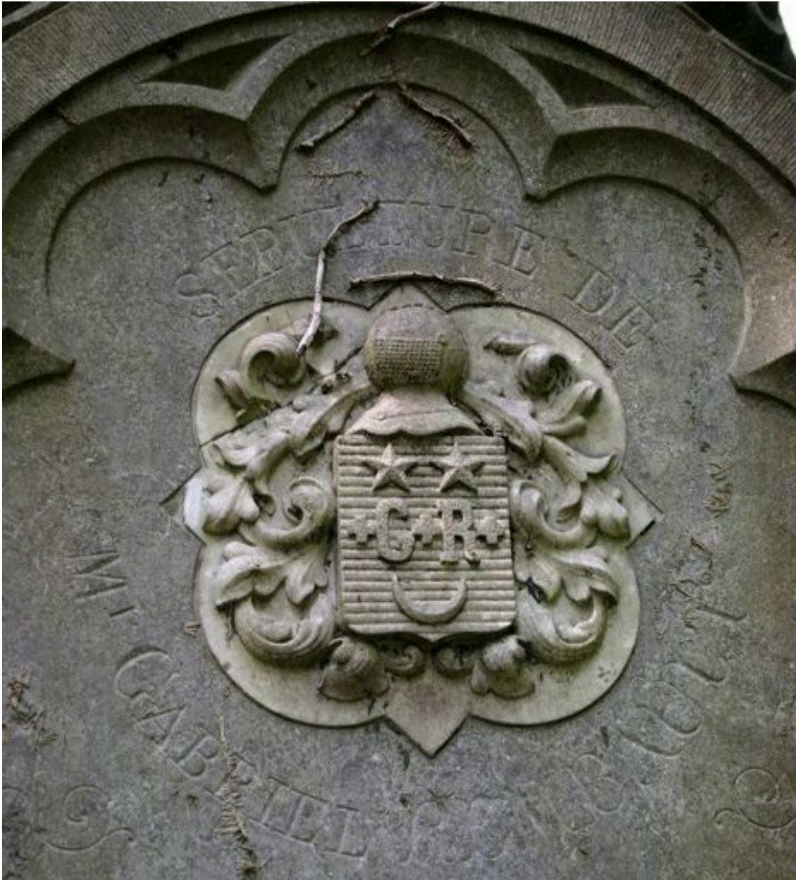
Vue de détail sur le décor sculpté en marbre blanc.