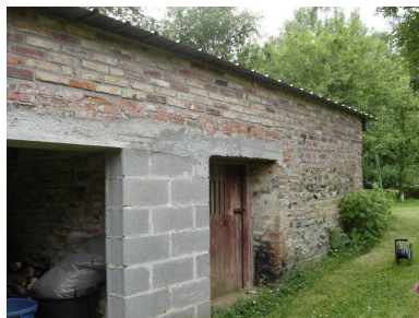
Vue du cellier. IVR22_20058005905NUCA