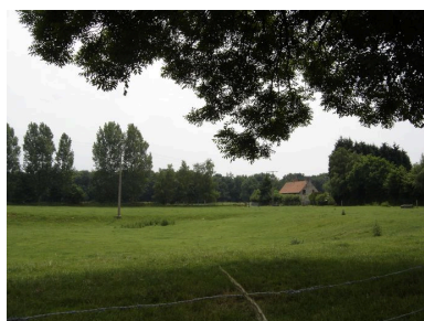
Vue générale de la ferme dans son environnement.