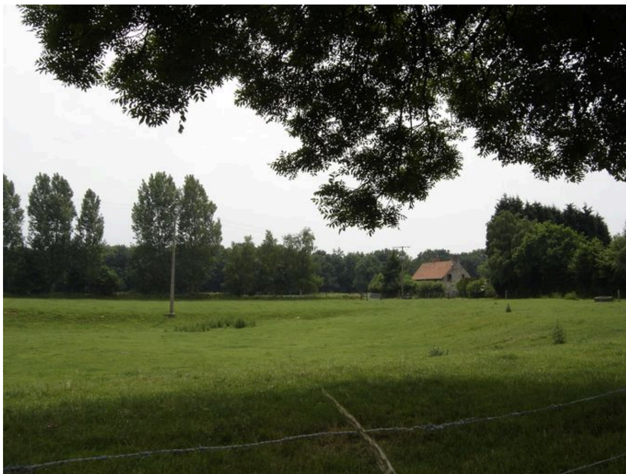
Vue générale de la ferme dans son environnement.