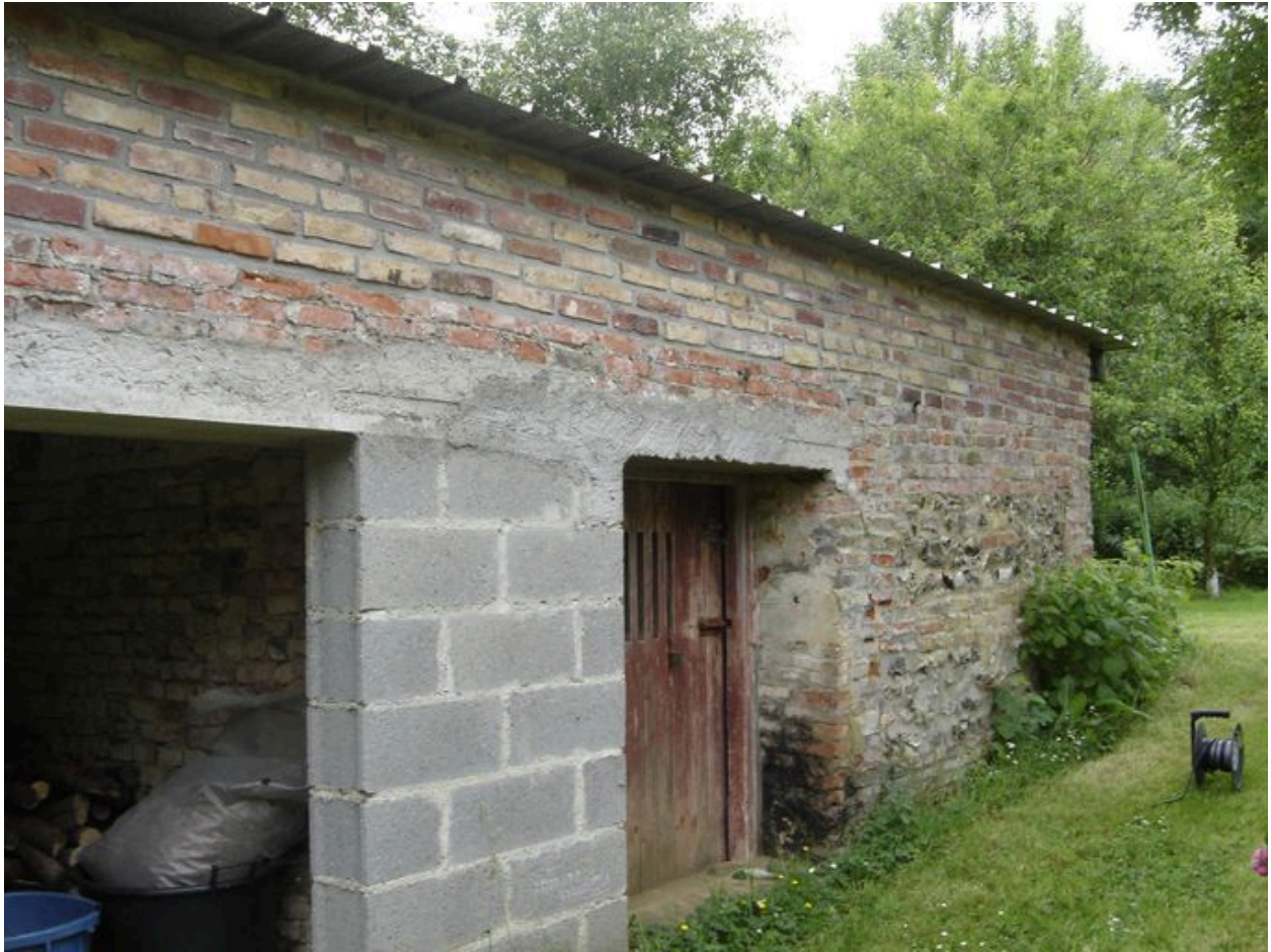
Vue du cellier.