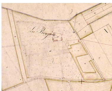
Extrait du cadastre napoléonien présentant le plan de la ferme en 1832.

IVR22_20068000077XAB