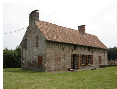
Vue postérieure depuis le nord. IVR22_20058005899NUCA