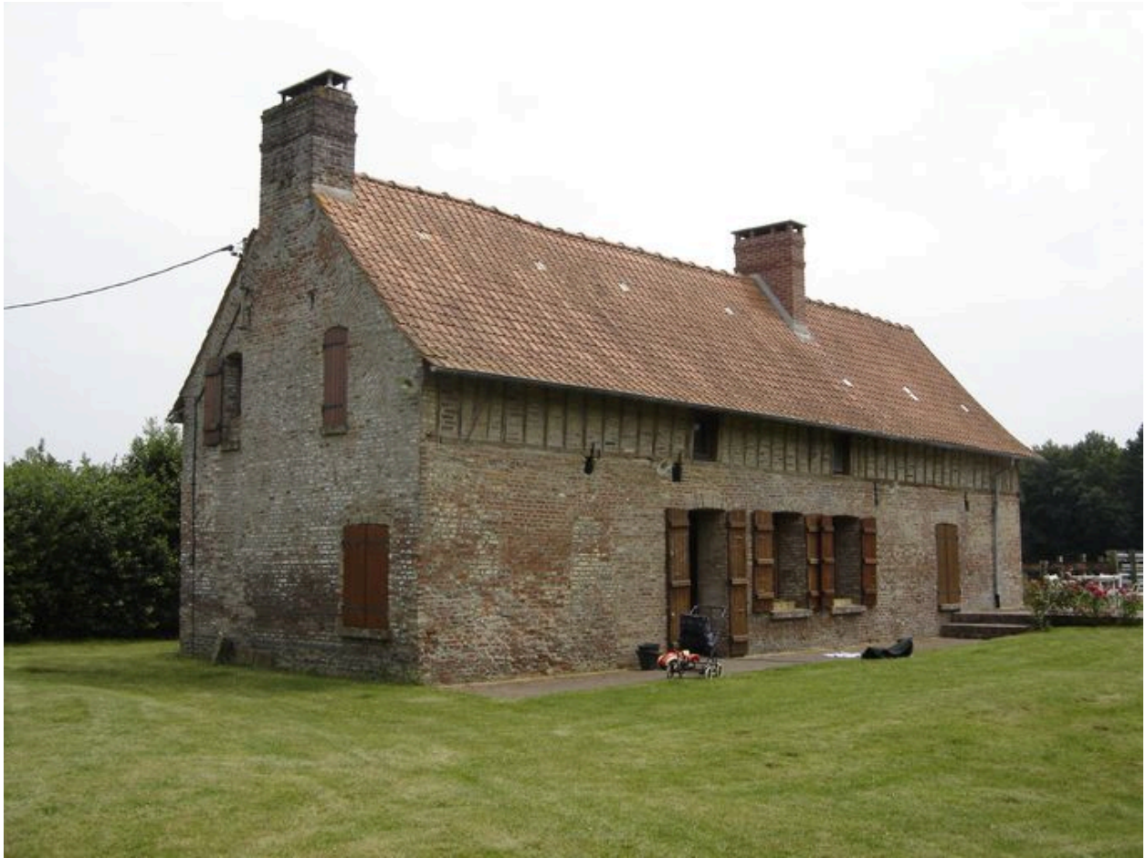
Vue postérieure depuis le nord.