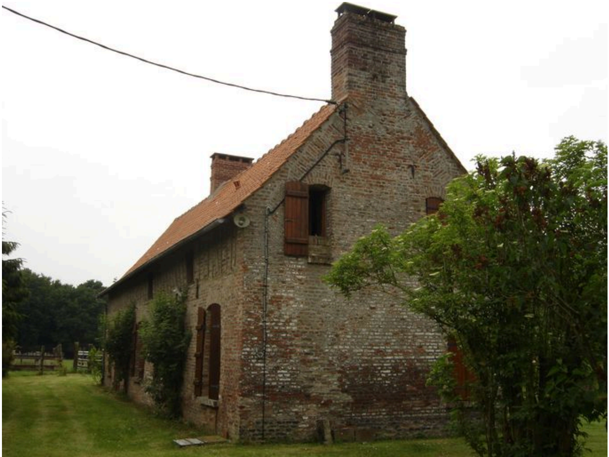
Vue latérale depuis le chemin d'accès.