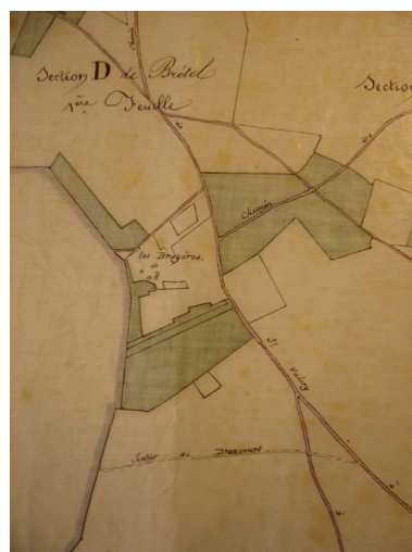
Détail du plan général du village en 1889 sur lequel la ferme des Bruyères possède encore ses dépendances.

IVR22_20058006406XAB