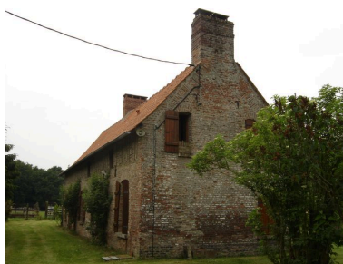
Vue latérale depuis le chemin d'accès. IVR22_20058005898NUCA