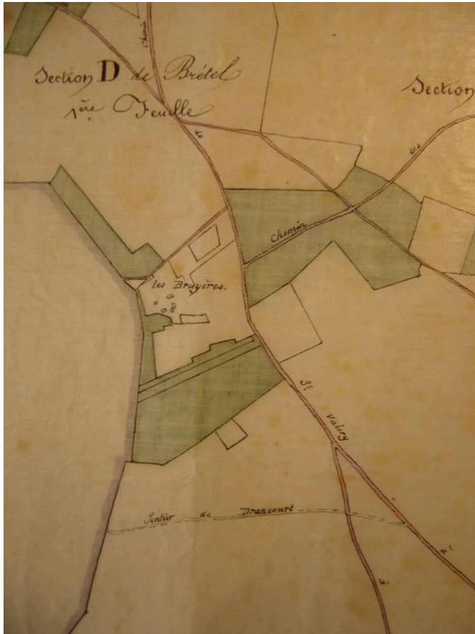
Détail du plan général du village en 1889 sur lequel la ferme des Bruyères possède encore ses dépendances.