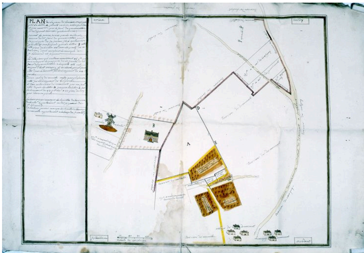
Plan de la ferme de Bruyères au début du 18e siècle.