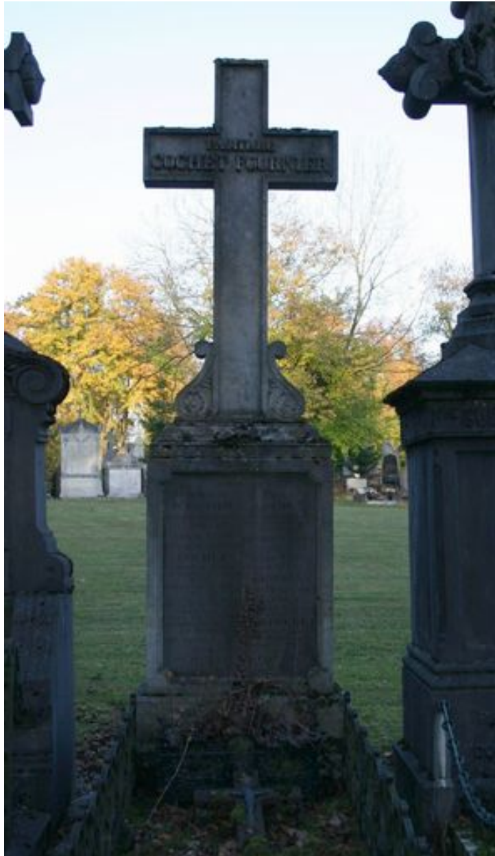
Stèle à croix monumentale.