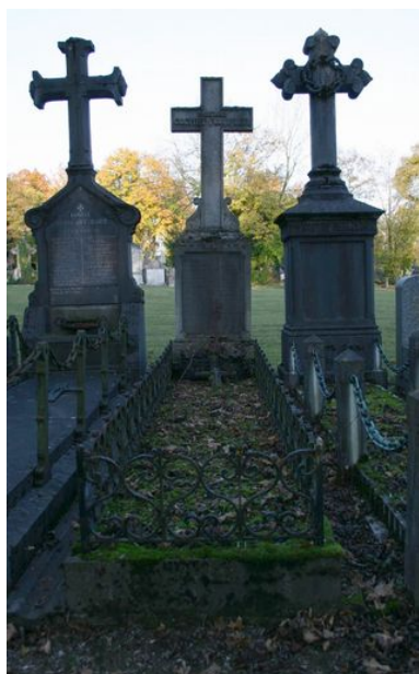
Vue de situation. Tombeau au centre de l'image.