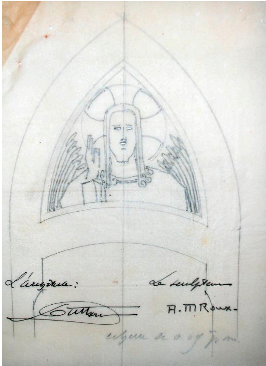
Esquisse du Christ bénissant pour le tympan, Duthoit (architecte), Roux (sculpteur), 1929 (AD Somme ; 10 R 140).