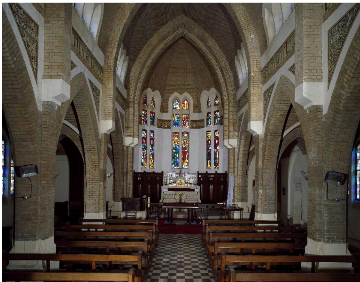
Vue intérieure vers le chœur.