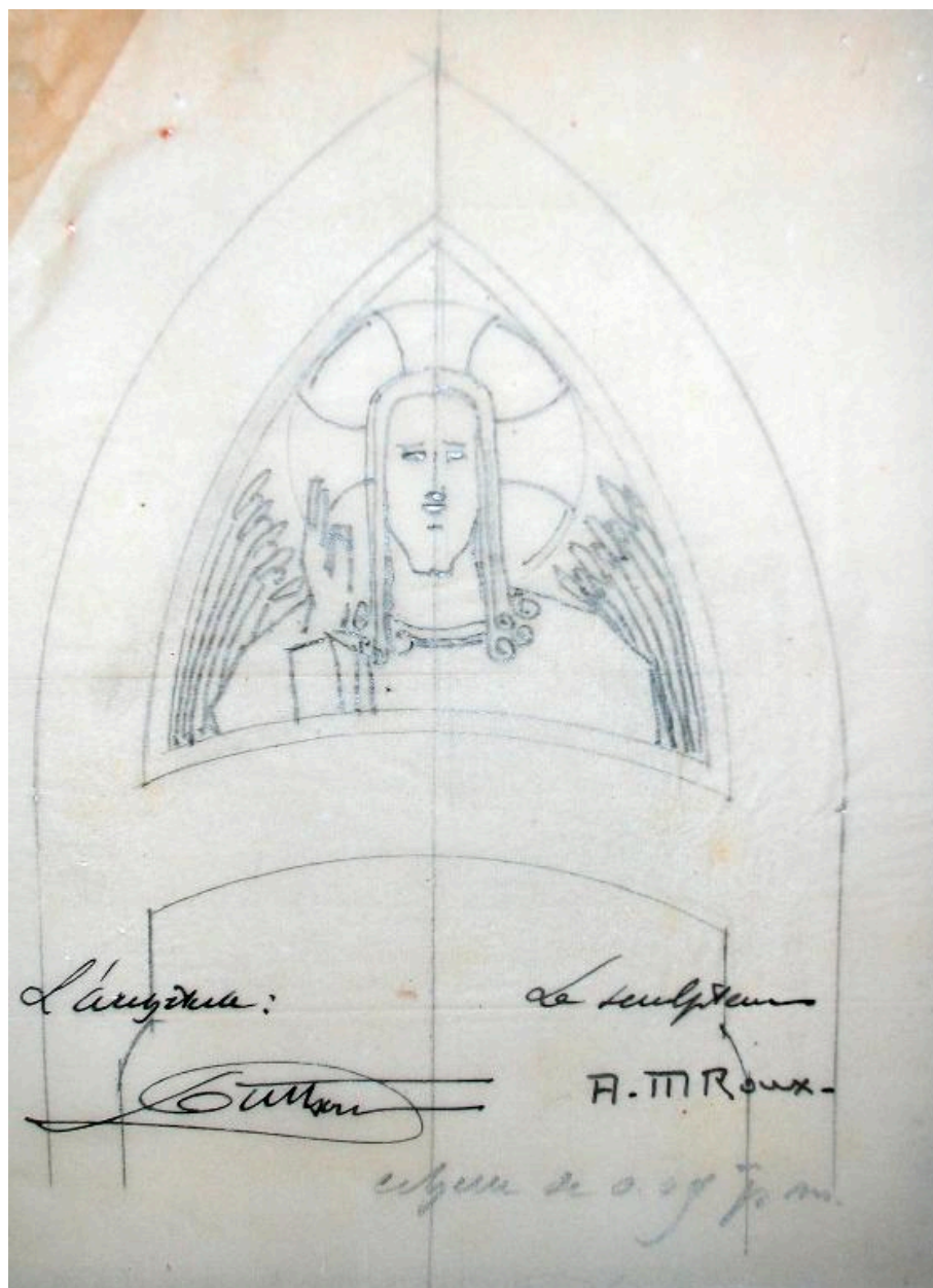
Esquisse du Christ bénissant pour le tympan, Duthoit (architecte), Roux (sculpteur), 1929 (AD Somme ; 10 R 140).