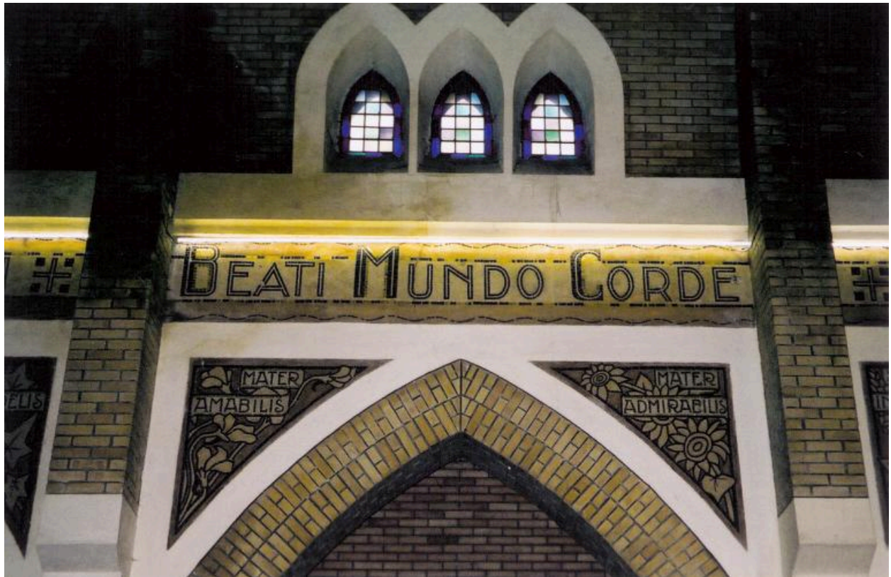
Vue des mosaïques intérieures.