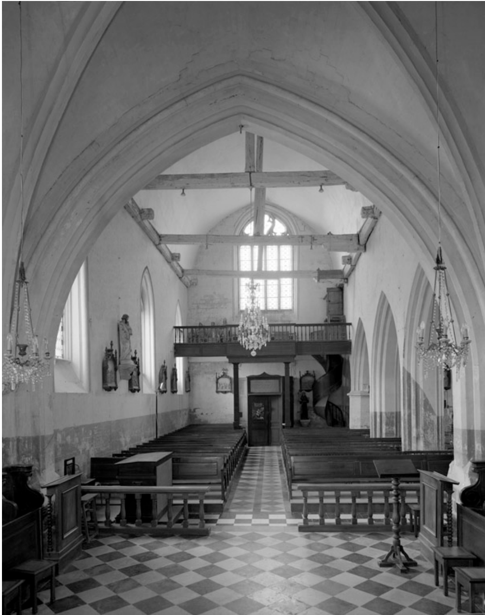
Vue intérieure, depuis le chœur.