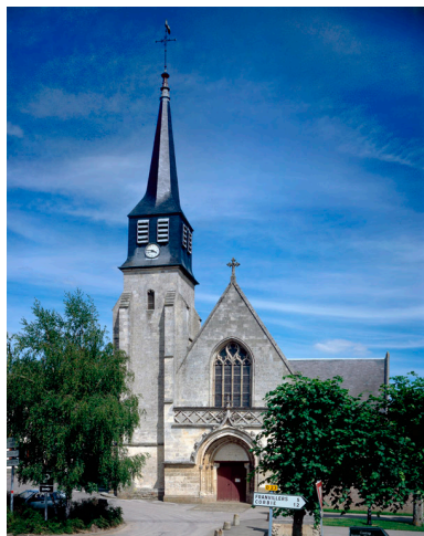
Façade occidentale.