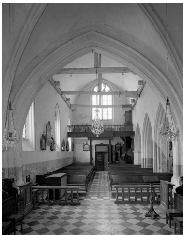
Vue intérieure, depuis le chœur. IVR22_19978000285V