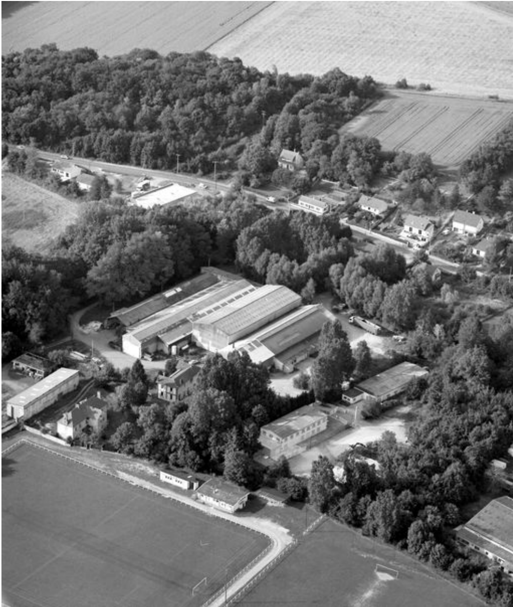
Vue aérienne de l'usine en 1994.