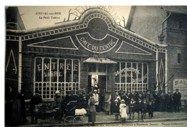
Vue d'ensemble, carte postale, 1er quart 20e siècle (coll. part.). IVR22_20058000621XAB

IVR22_20008000453XB