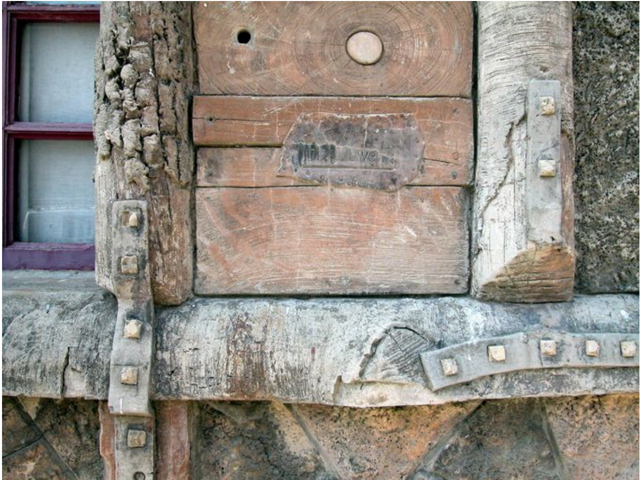
Détail du décor et signature.