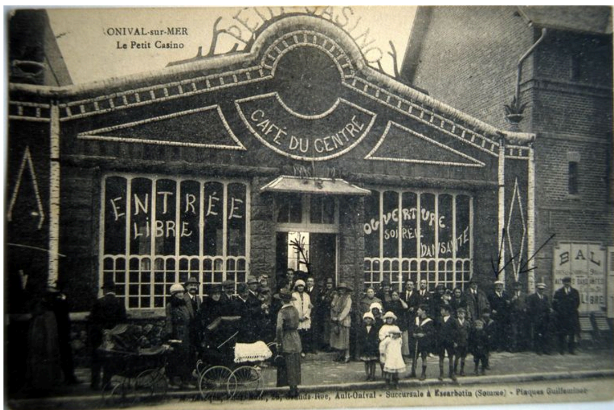
Vue d'ensemble, carte postale, 1er quart 20e siècle (coll. part.).