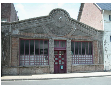
Vue d'ensemble.

Phot. Leullier Irwin IVR22_19998001496ZAB