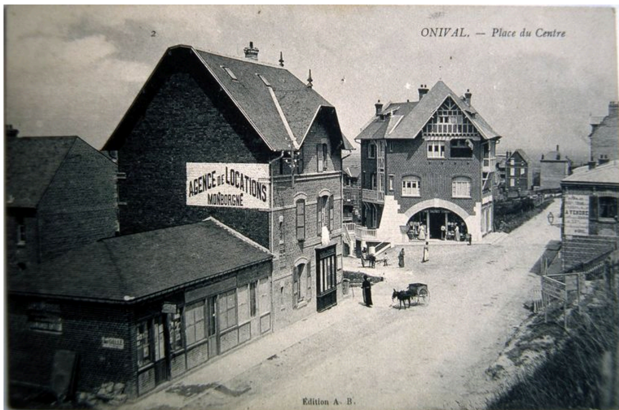
Situation avant la construction de l'établissement de danse, carte postale, 1er quart 20e siècle.