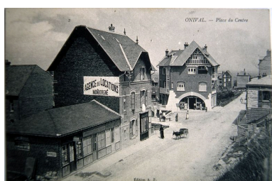
Situation avant la construction de l'établissement de danse, carte postale, 1er quart 20e siècle (coll. part.).

Phot. Monnehay-Vulliet Marie-Laure IVR22_20058000594XAB