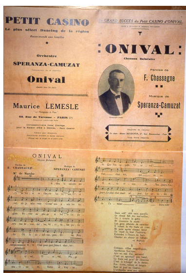
Onival, chanson balnéaire, partition, par F. Chassagne et Speranza-Camuzat, 1ère moitié 20e siècle (coll. part.).

Phot. Leullier Irwin IVR22_19998001496ZAB