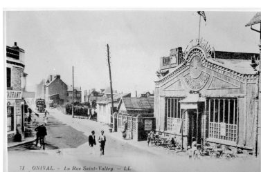
Salle de danse du Petit Casino, carte postale, 1er quart 20e siècle (coll. part.).

Phot. Monnehay-Vulliet Marie-Laure IVR22_20058000594XAB