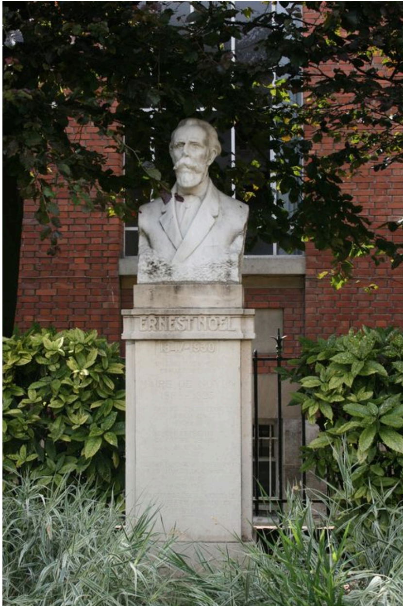
Vue générale du monument.