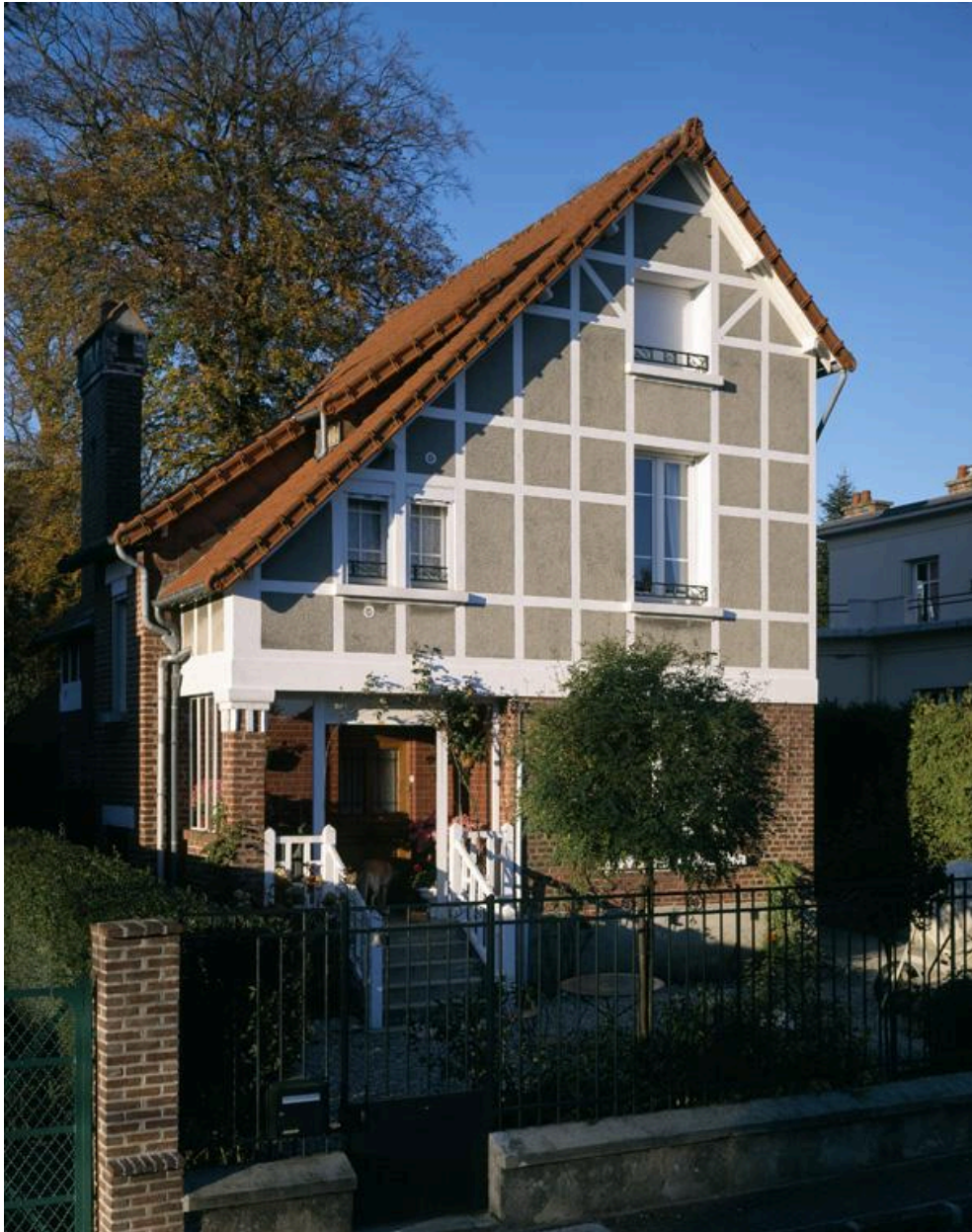
Vue de la façade sur rue.