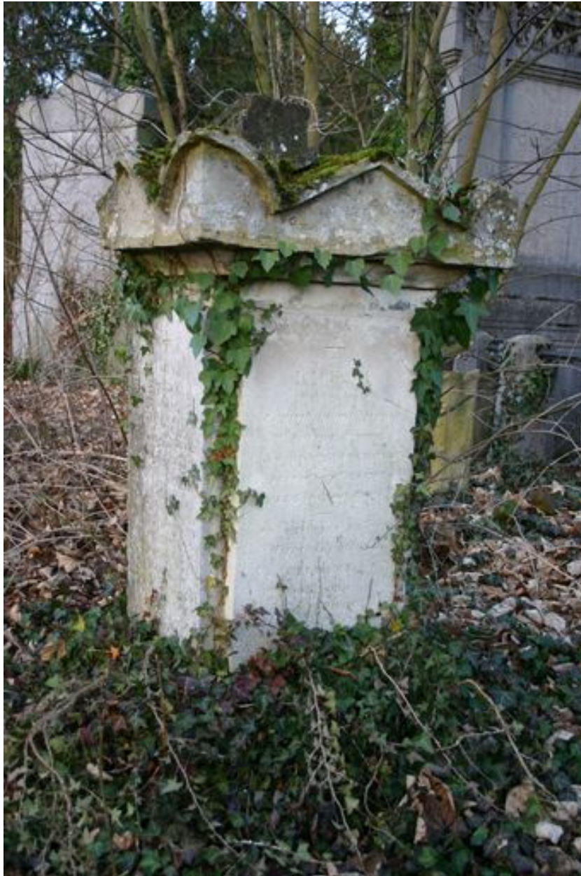
Cippe, vers 1827.