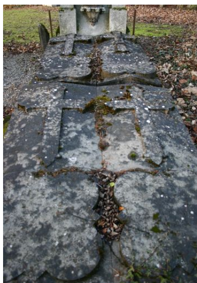
Dalles funéraires, vers 1878, 1890, 1909 et 1919.