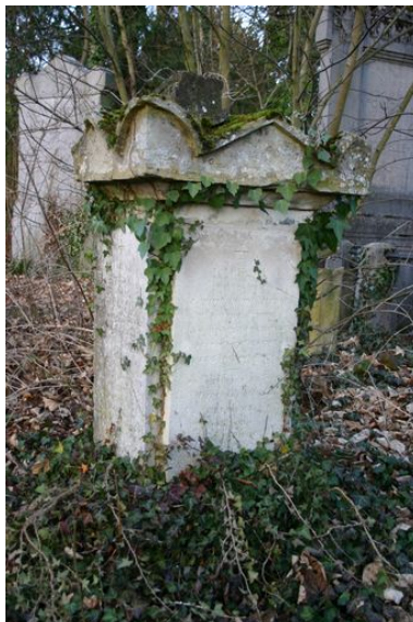
Cippe, vers 1827.