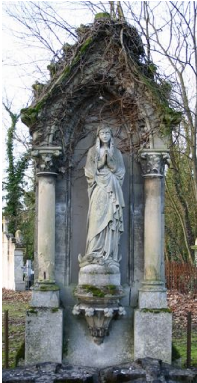
Stèle architecturée servant de niche à une statue de la Vierge, A. Sallé (entrepreneur), vers 1891.