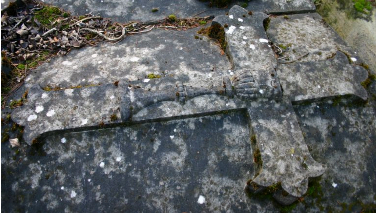
Détail du décor sculpté sur la dalle funéraire d'Eugène Victor Emile Leroy : ciboire.