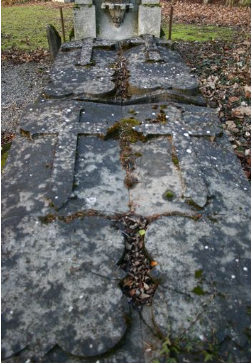
Dalles funéraires, vers 1878, 1890, 1909 et 1919.