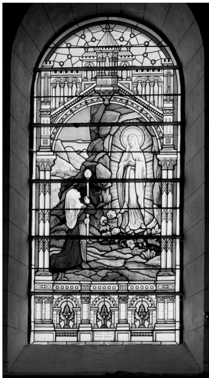
Apparition de la Vierge à Bernadette Soubirous, par Charles Champigneulle, Paris, 1922.