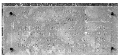
Plaque commémorative des morts de la Grande Guerre.