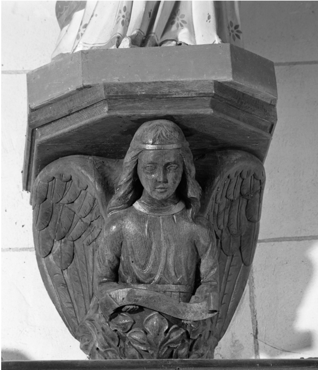
Console pour une statue.