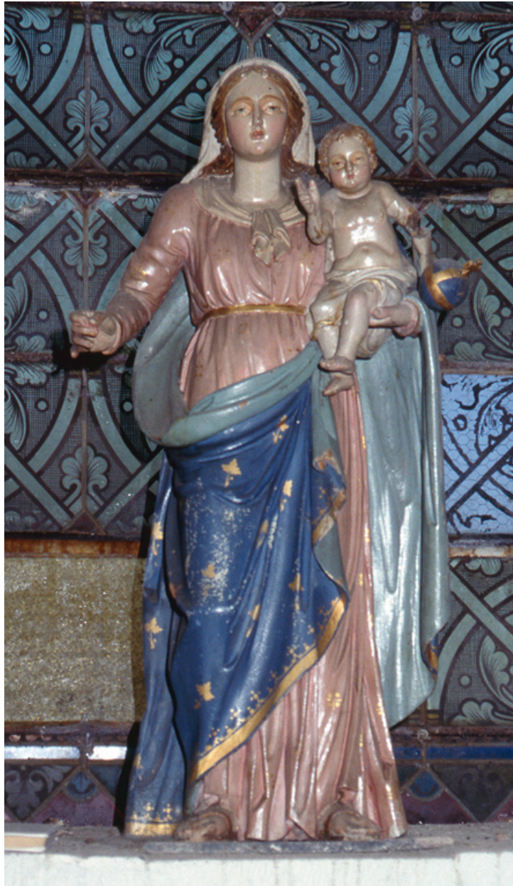
Statue : Vierge à l'Enfant.