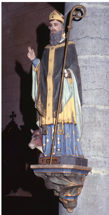
Statue : saint Etton.