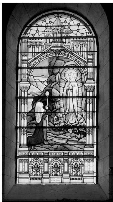
Apparition de la Vierge à Bernadette Soubirous, par Charles Champigneulle, Paris, 1922. IVR22_19910200718X