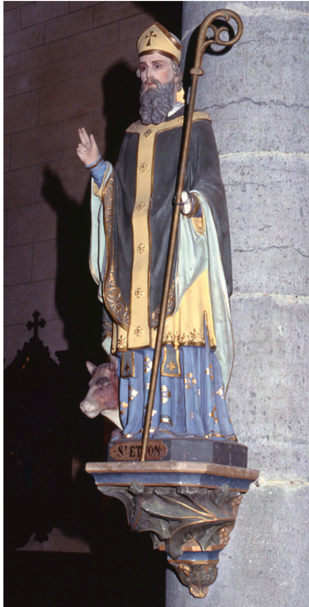
Statue : saint Etton.