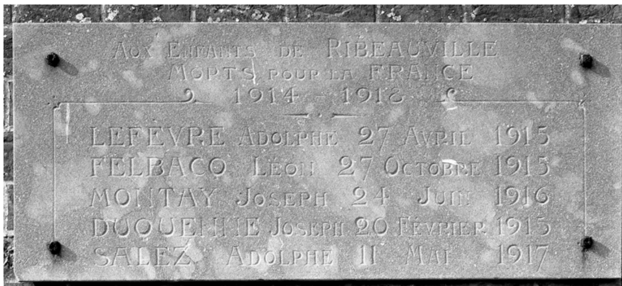
Plaque commémorative des morts de la Grande Guerre.