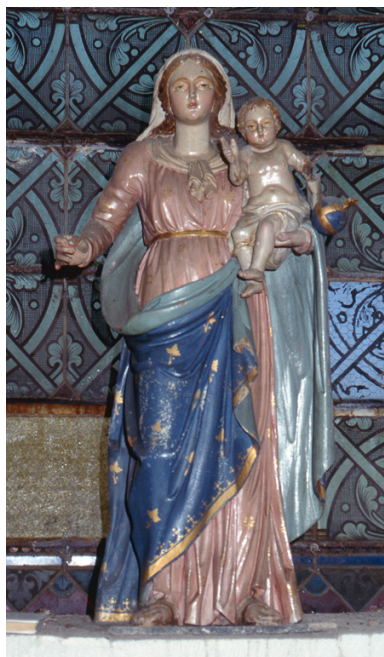
Statue : Vierge à l'Enfant. IVR22_19900202899ZA