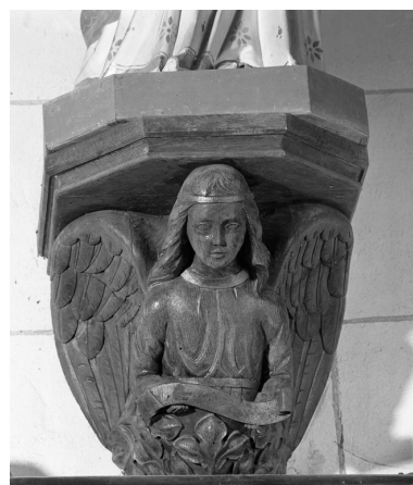
Console pour une statue.