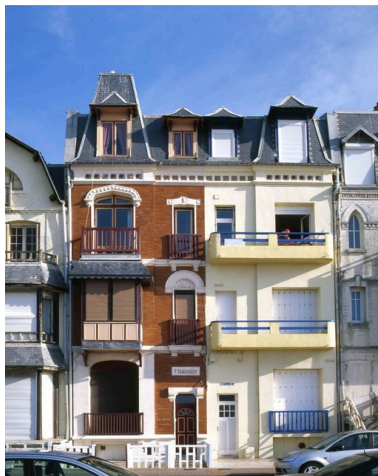
Vue d'ensemble depuis l'esplanade.