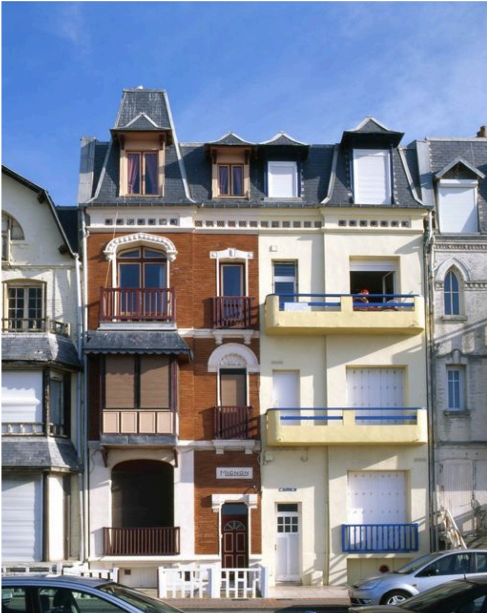
Vue d'ensemble depuis l'esplanade.