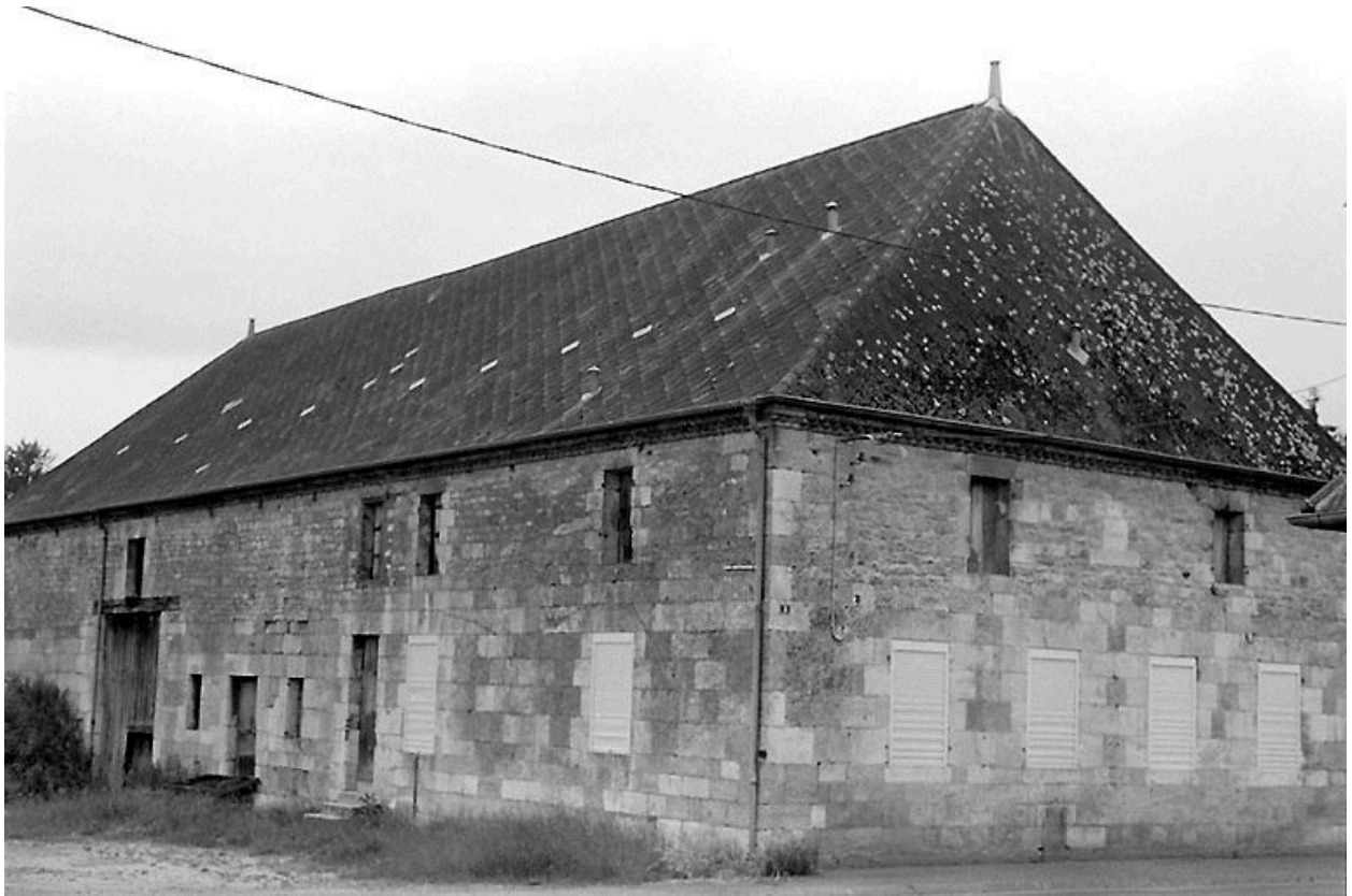
Vue depuis le nord-est.