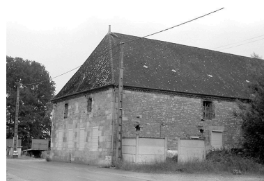
Vue depuis le nord-ouest. IVR22_19980201619Z