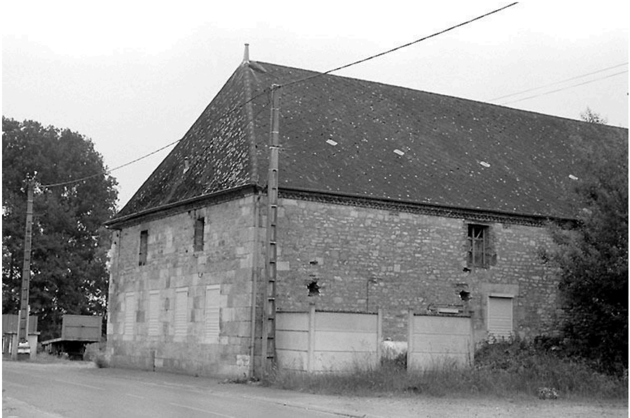
Vue depuis le nord-ouest.