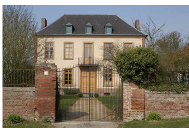
Vue du corps de logis depuis la rue à l'est. IVR22_20038000260NUCA