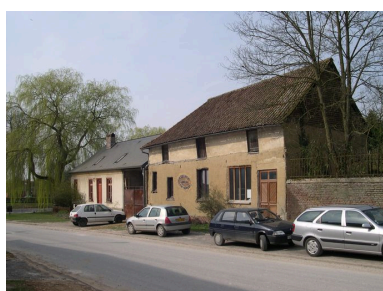
Ancien atelier de charron ou de charpentier.