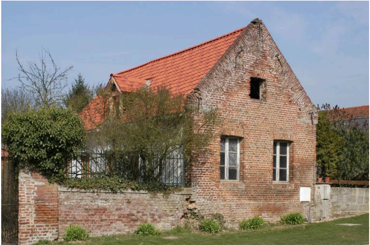
Dépendance, au nord de la parcelle.