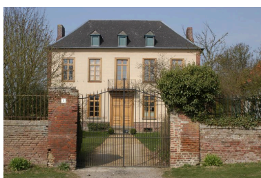
Vue du corps de logis depuis la rue à l'est.