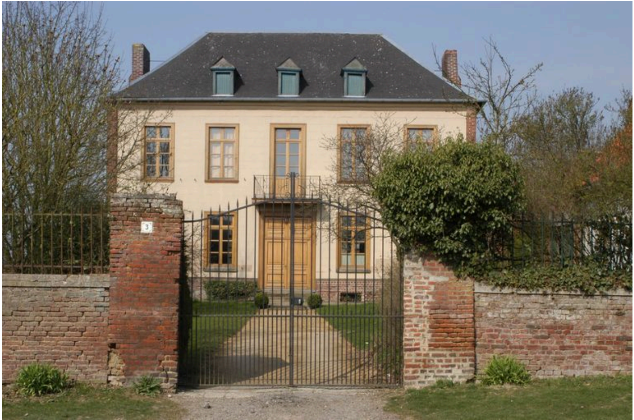
Vue du corps de logis depuis la rue à l'est.