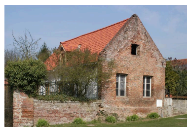
Dépendance, au nord de la parcelle.