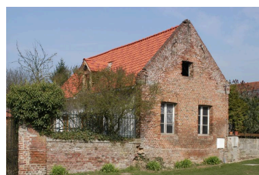
Dépendance, au nord de la parcelle.