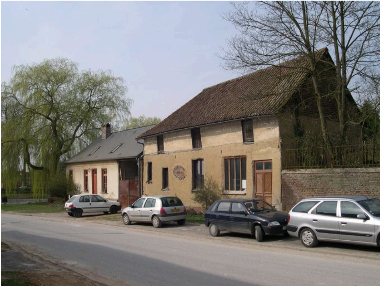
Ancien atelier de charron ou de charpentier.