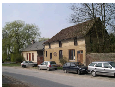
Ancien atelier de charron ou de charpentier.