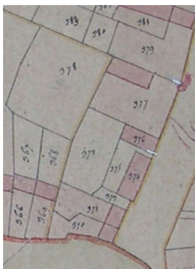
Extrait du cadastre napoléonien. IVR22_20038010331NUCA