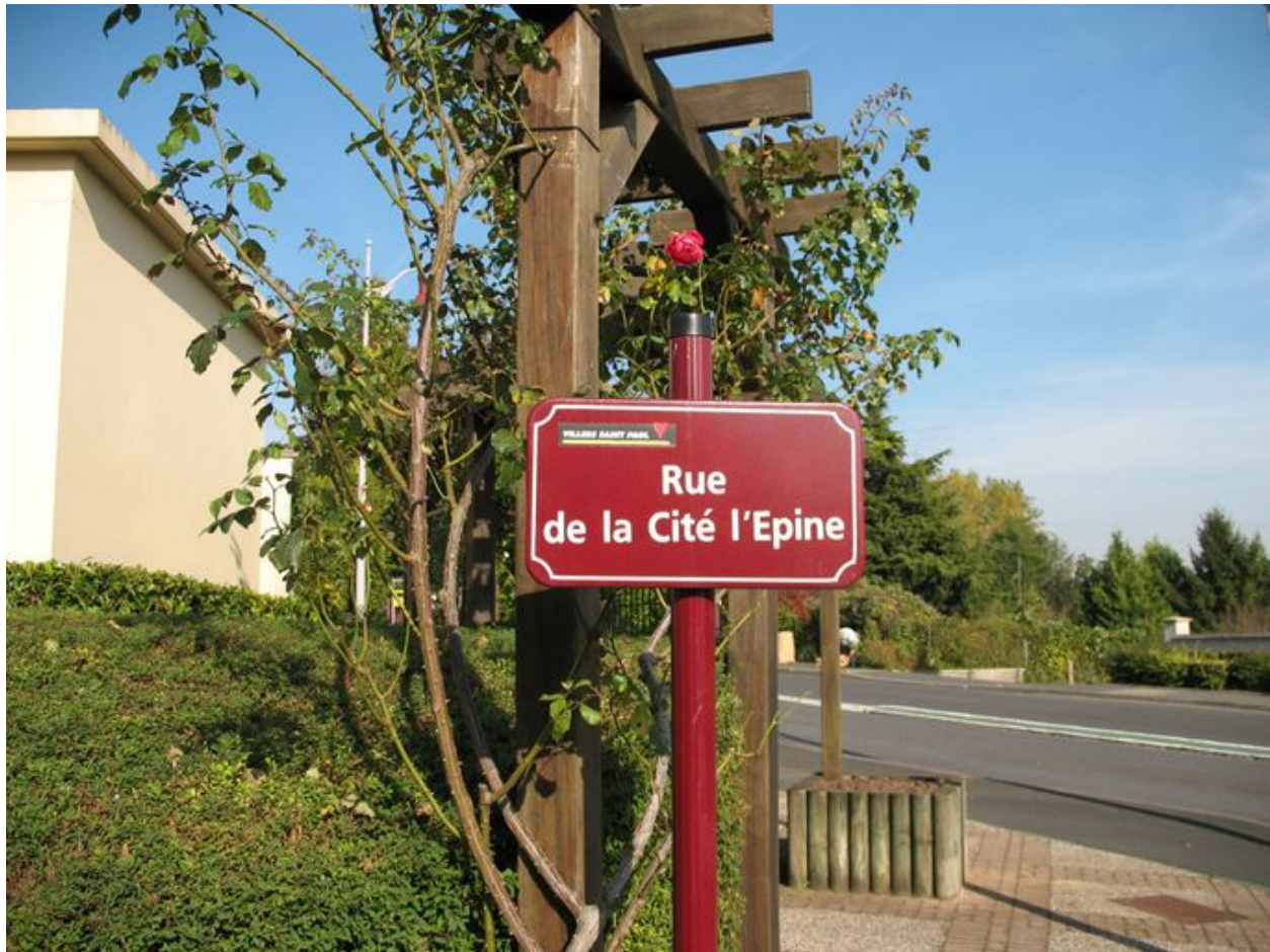
Entrée de la cité l'Épine.