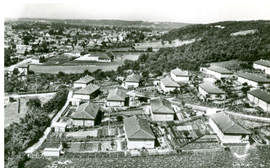
Vue de la cité l'Epine au début des années 1960 (AC Villers-Saint-Paul ; non coté). IVR22_20096005142NUCAB