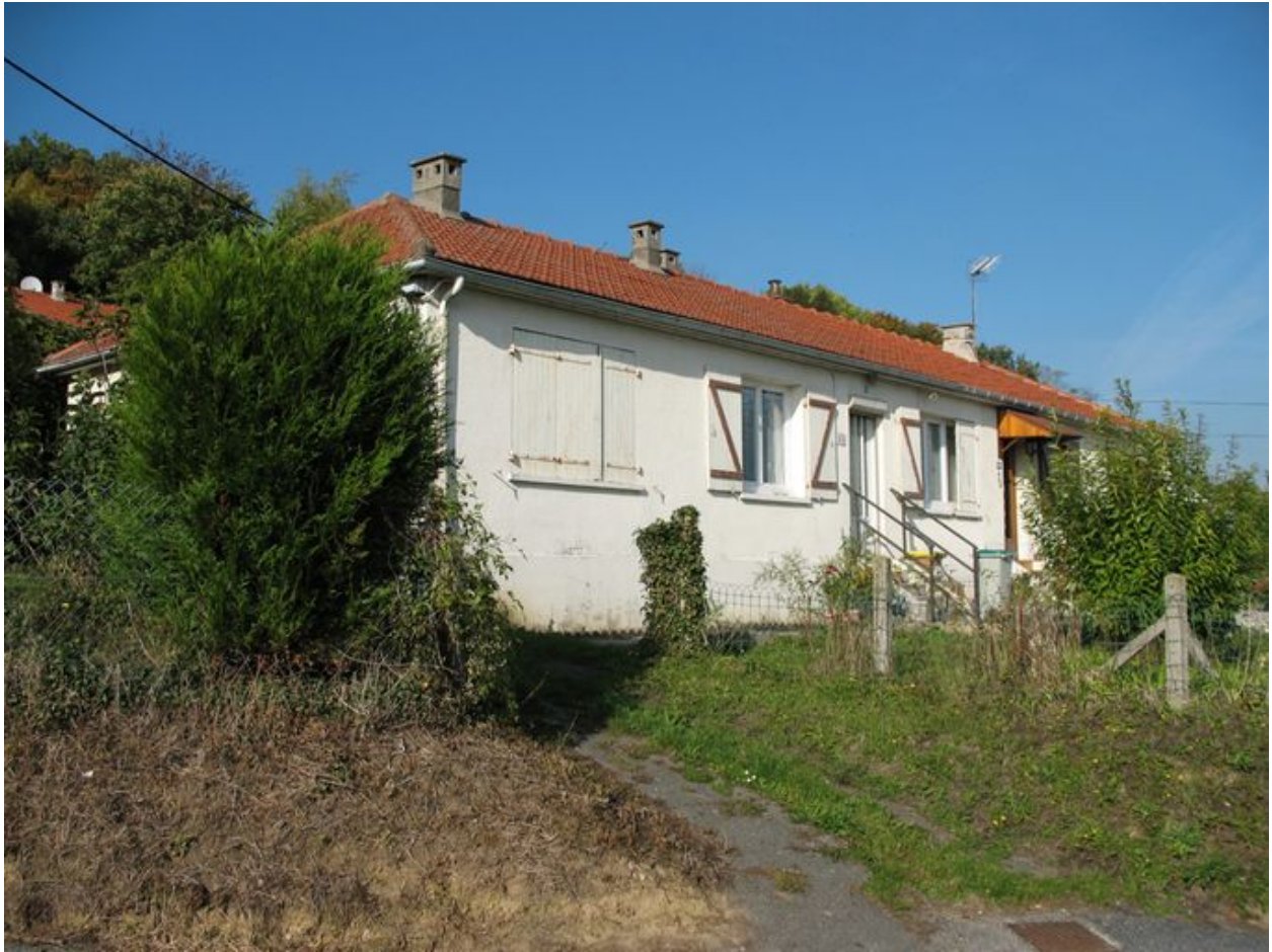
Un pavillon jumelé de la cité l'Épine construit en 1955.