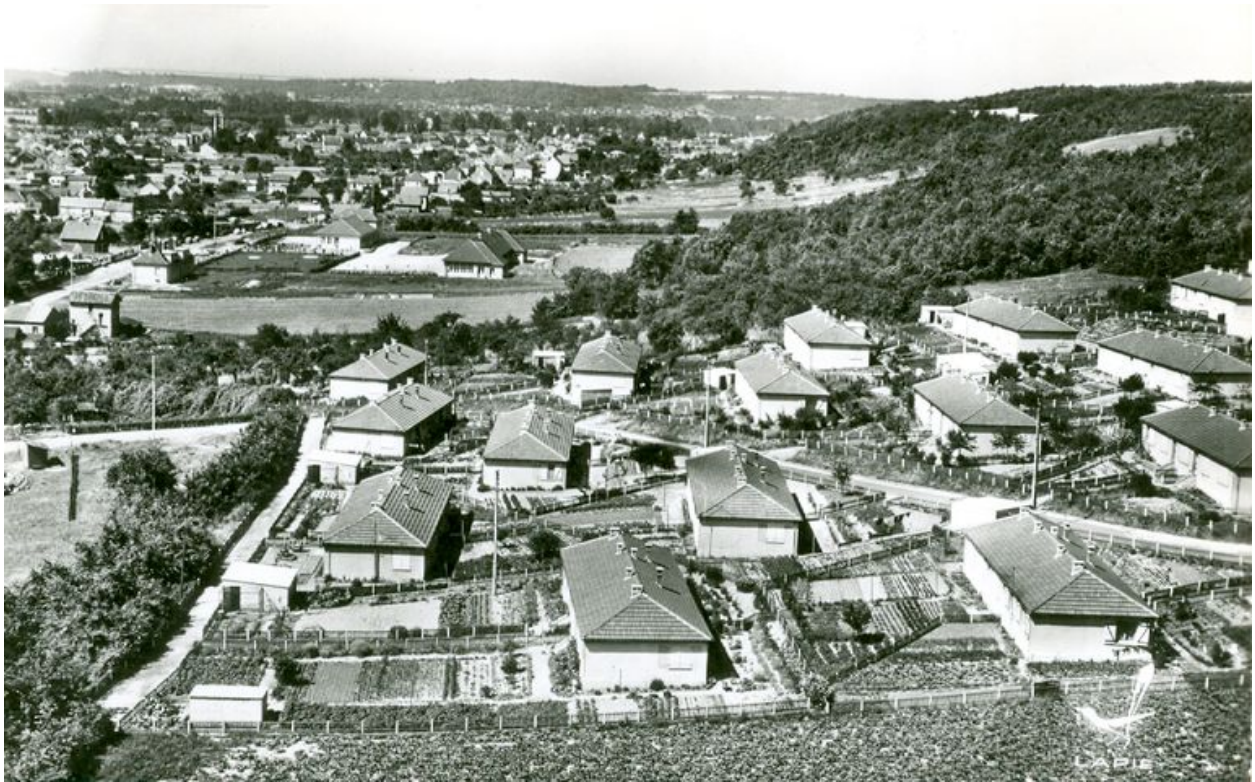
Vue de la cité l'Épine au début des années 1960.