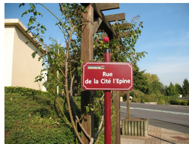
Entrée de la cité l'Epine. IVR22_20096005100NUCA