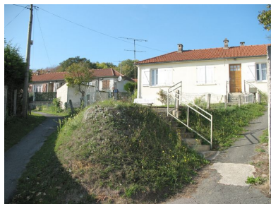
Deux pavillons jumelés de plain-pied.