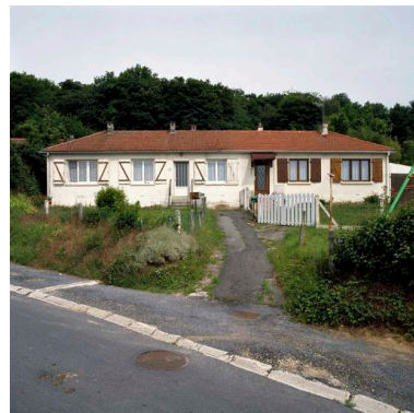
Maison jumelée en haut de la cité l'Epine. IVR22_20106000381XA