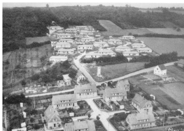
Vue générale des cités l'Epine (en-haut) et Entreil, vers 1960. IVR22_20096005101NUCAB