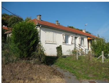
Un pavillon jumelé de la cité l'Epine construit en 1955. IVR22_20096005099NUCA