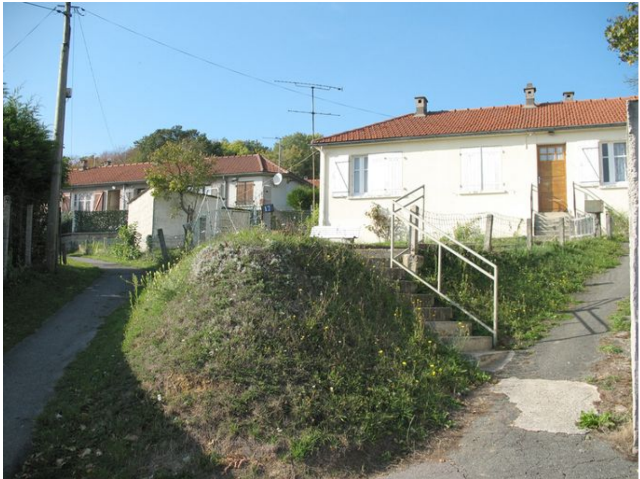
Deux pavillons jumelés de plain-pied.