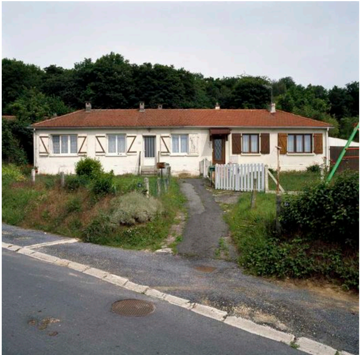
Maison jumelée en haut de la cité l'Épine.