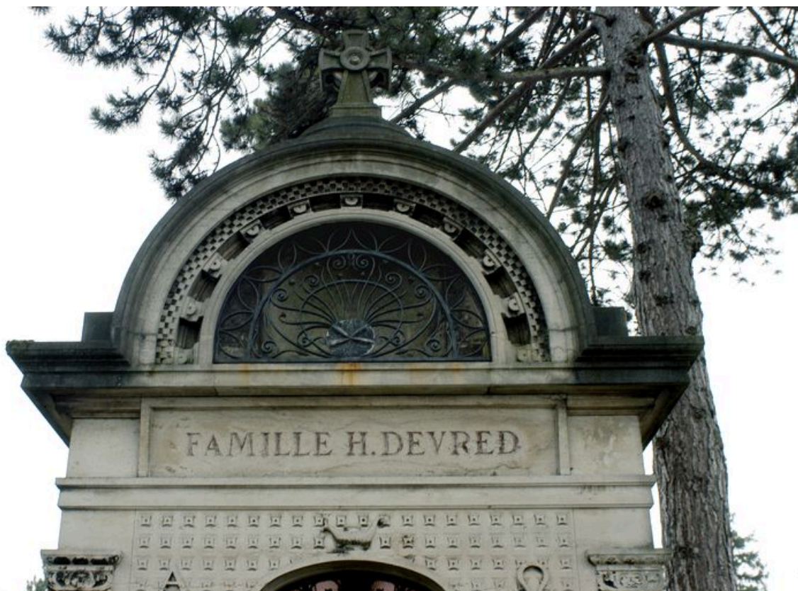
Vue de détail sur le fronton.