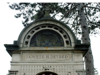
Vue de détail sur le fronton. IVR22_20058000384NUCA