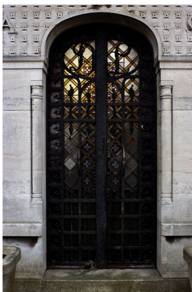
Vue de détail sur la porte.