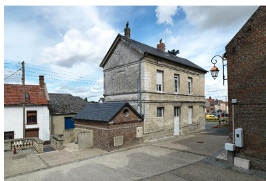
Vue d'ensemble de la façade latérale est, impasse de l'Eglise. IVR22_20128000605NUC2A