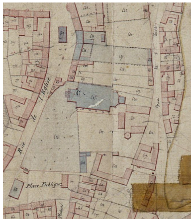
Extrait du cadastre napoléonien, 1834 (AD Somme ; 3P 1619/3). IVR22_20138016166NUC2A