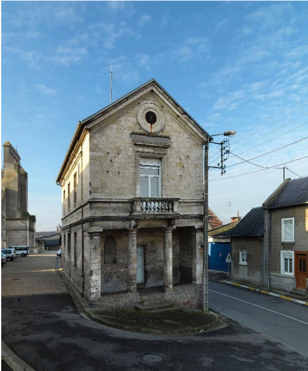
Vue de la façade principale.