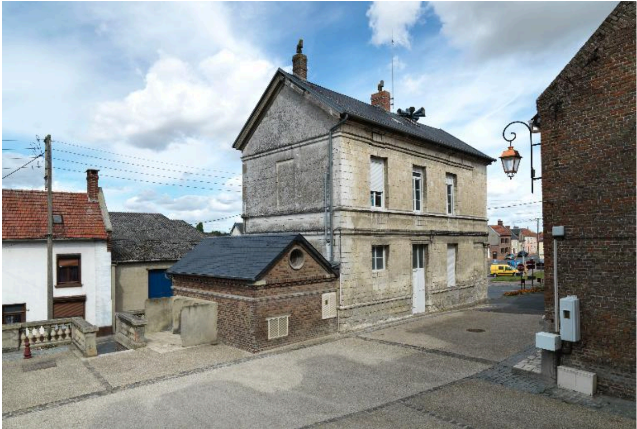
Vue d'ensemble de la façade latérale est, impasse de l'Eglise.