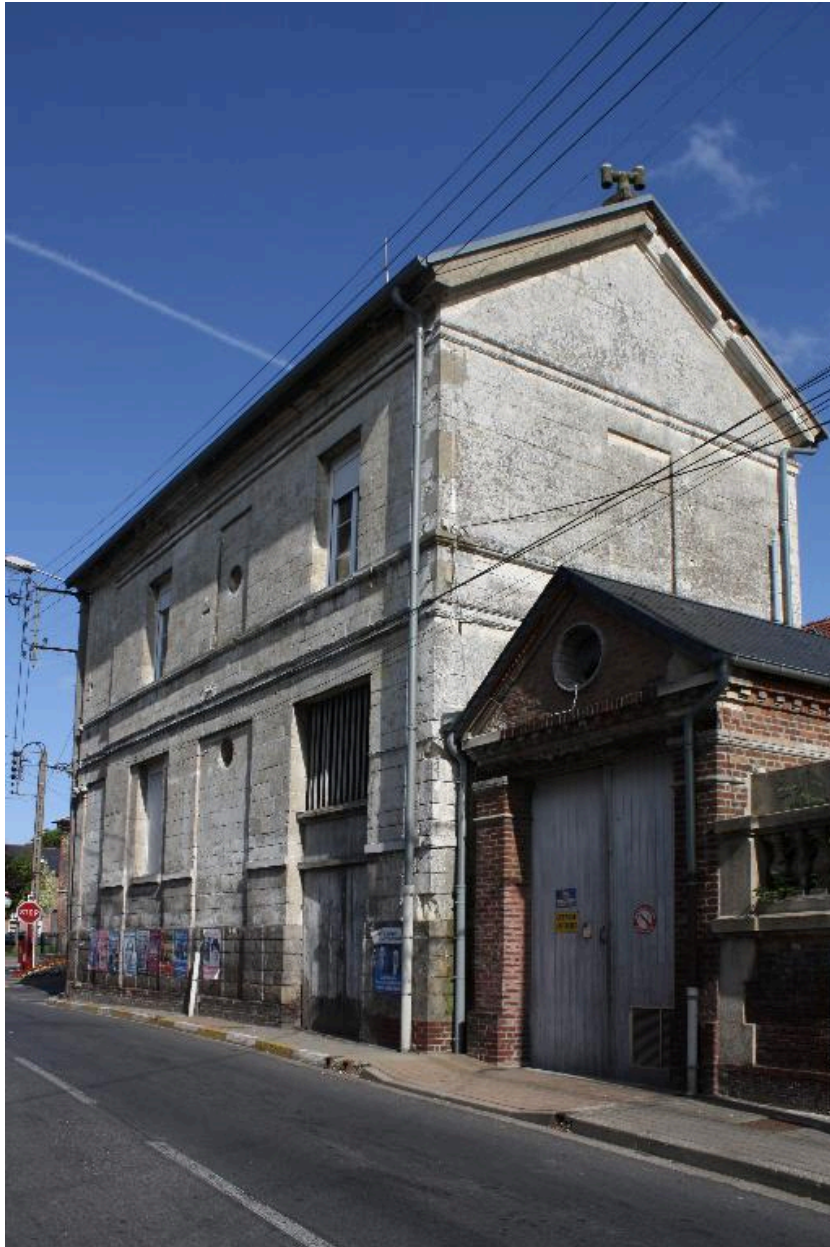
Vue d'ensemble depuis la rue du Maréchal-Leclerc et de la 2e DB.