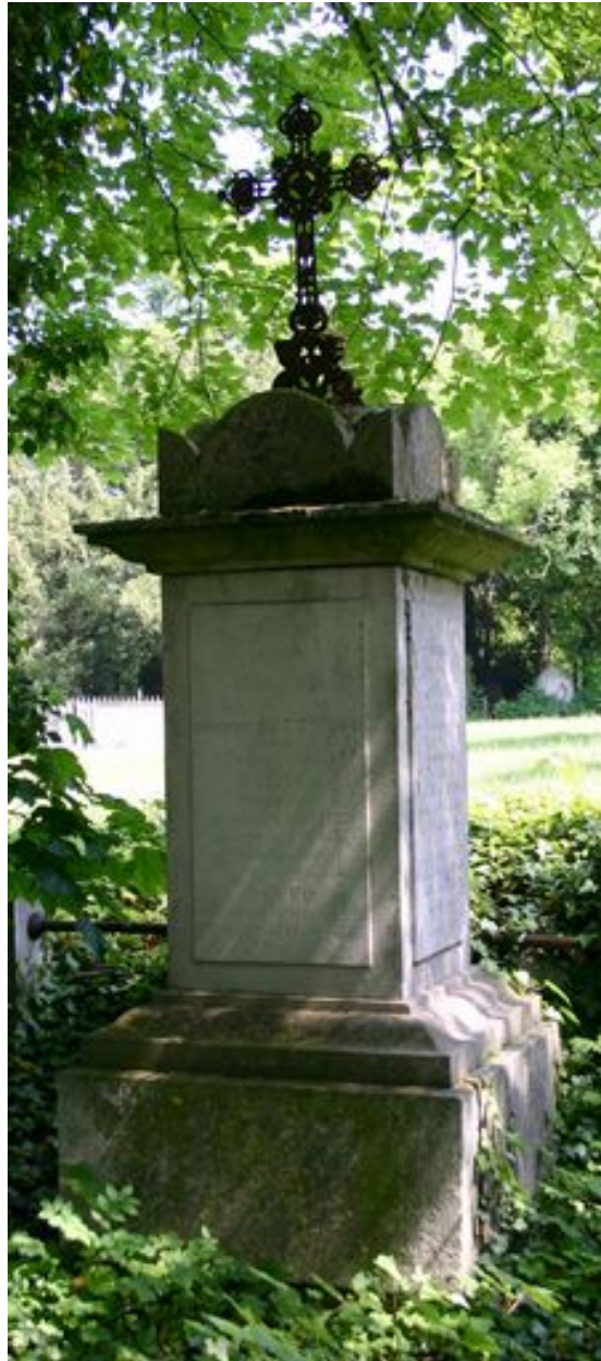
Pilier couronné, surmonté d'une croix en fonte ouvragée.