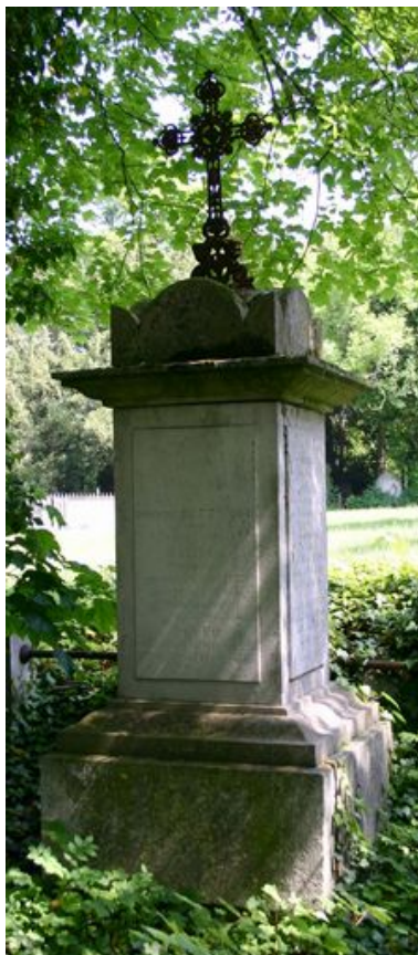
Pilier couronné, surmonté d'une croix en fonte ouvragée. IVR22_20088000608NUCA