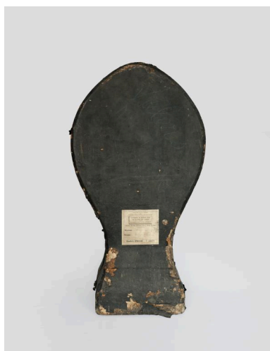
Boîte à ostensorio. IVR32_20208000214NUC2A