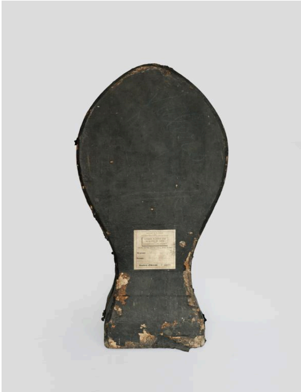
Boîte à ostensor.