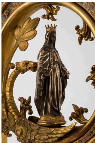
Détail du crosaron : figurine de la Vierge.