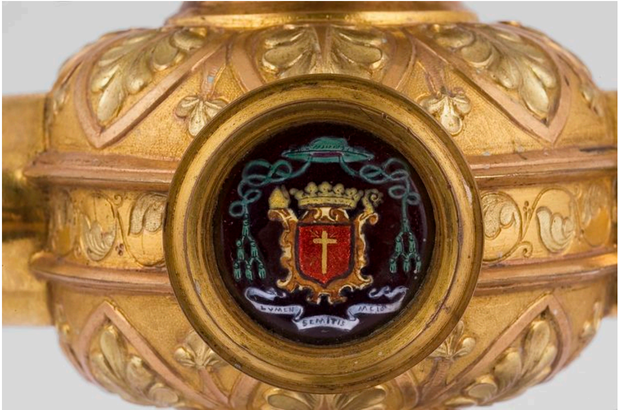
Détail du crosseron : armoiries de Monseigneur Deramecourt.