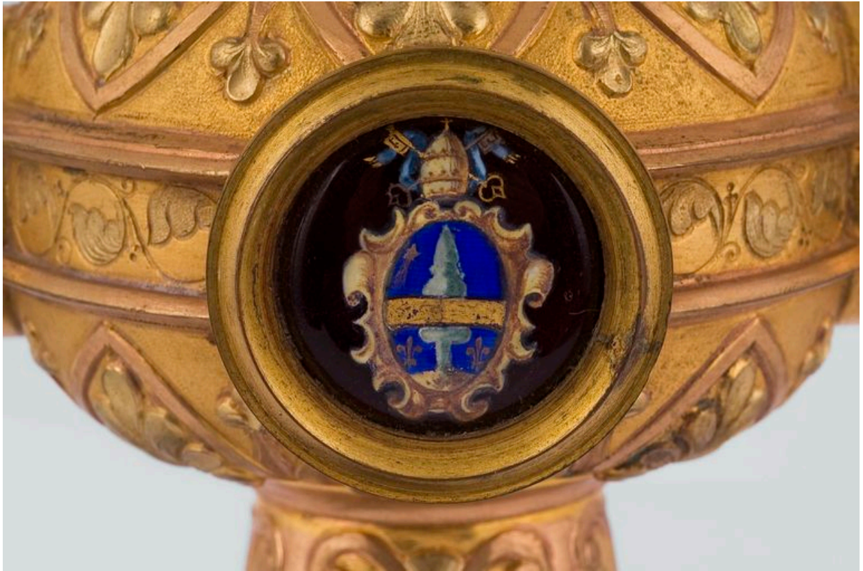
Détail du crosseron : armoiries du pape Léon XIII.