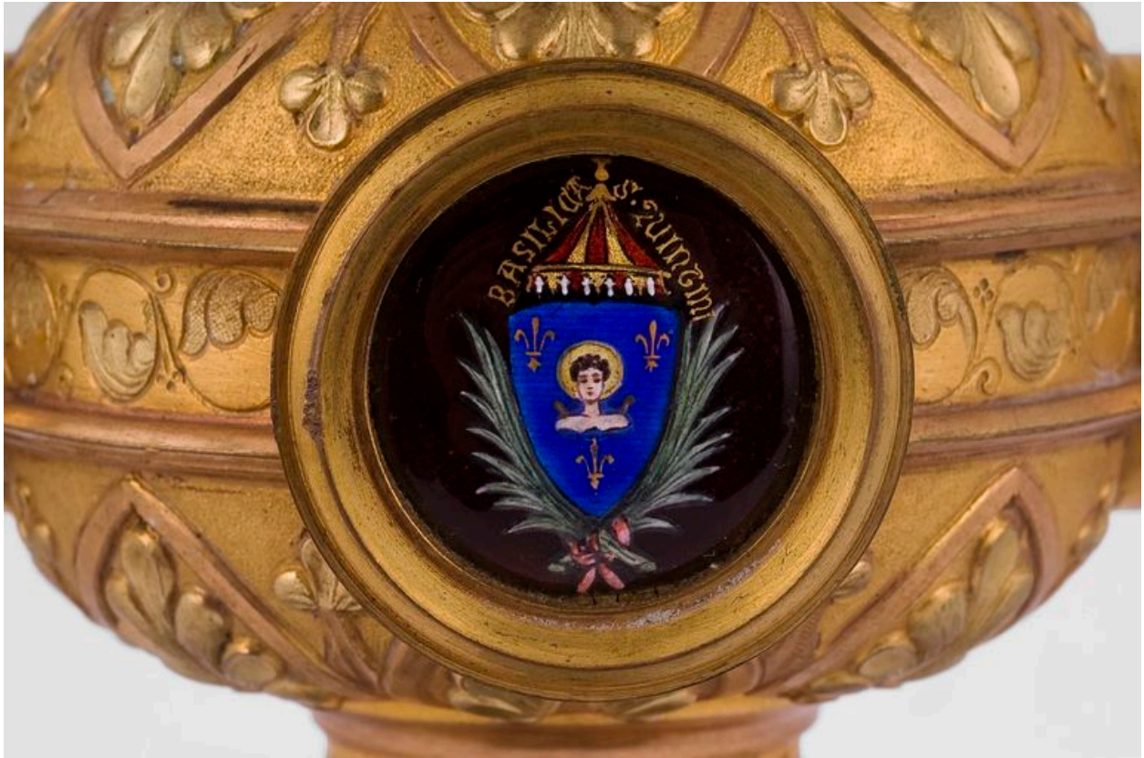
Détail du crosseron : armoiries de la basilique.