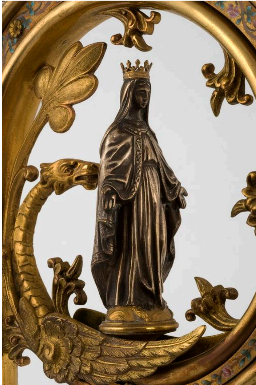
Détail du crosseron : figurine de la Vierge.