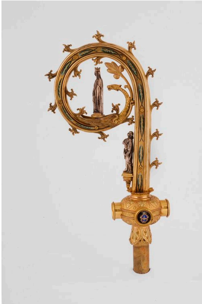
Le crosseron : vue de profil.