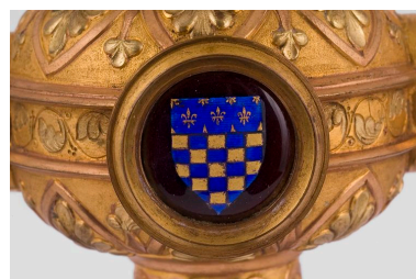
Détail du crosaron : armoiries de Vermand. IVR22_20090200116NUCA