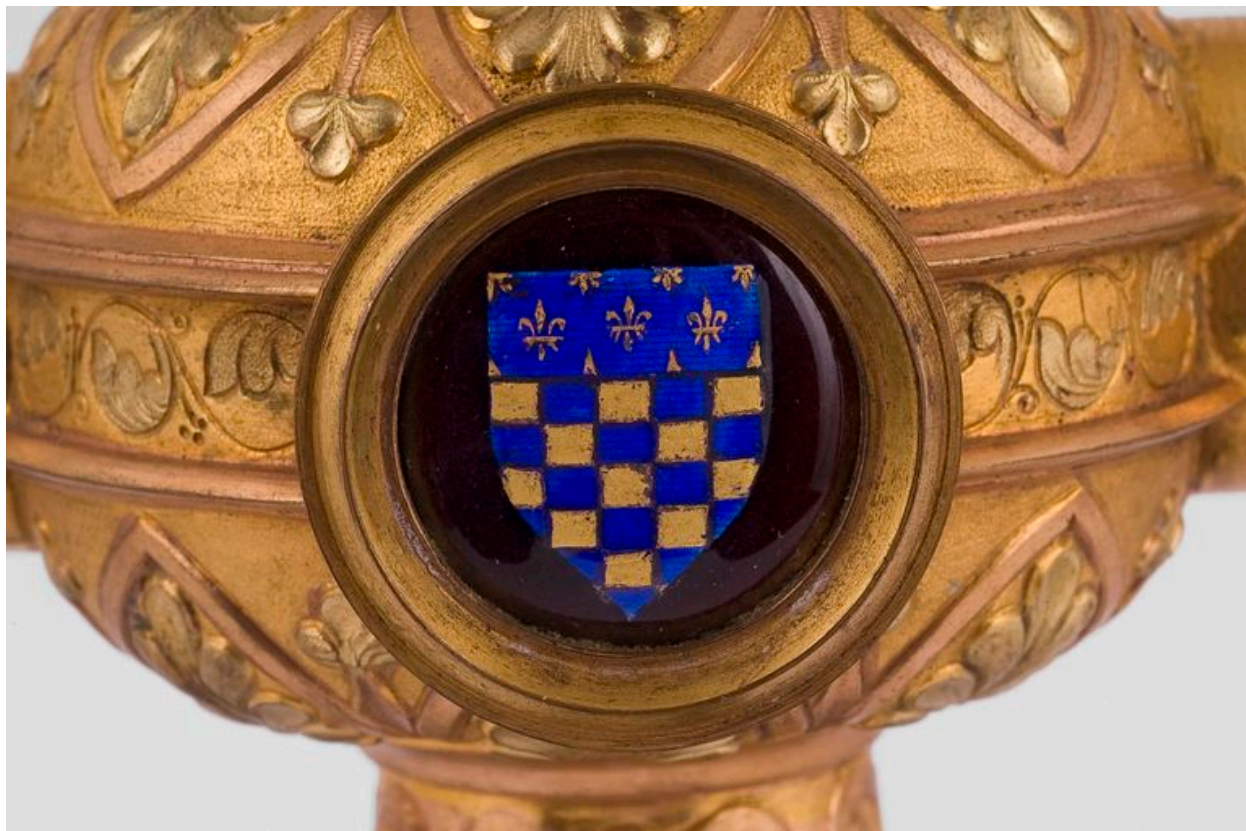
Détail du crosseron : armoiries de Vermand.