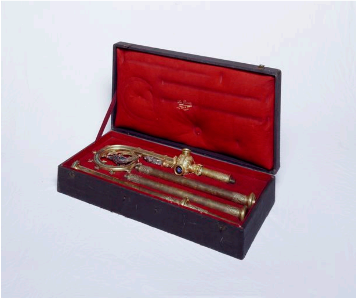
Vue de la crosse dans son écrin.