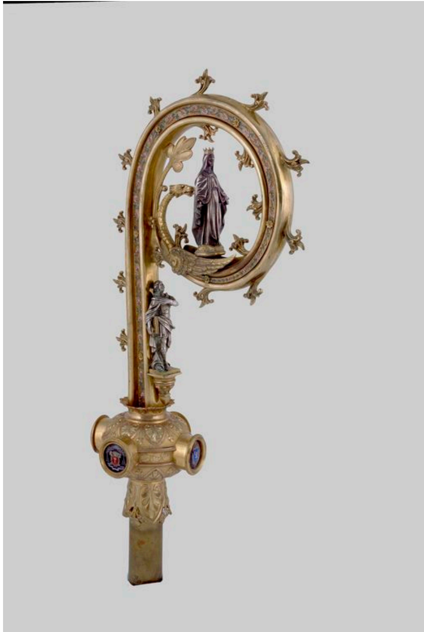
Le crosseron : vue de trois-quarts.