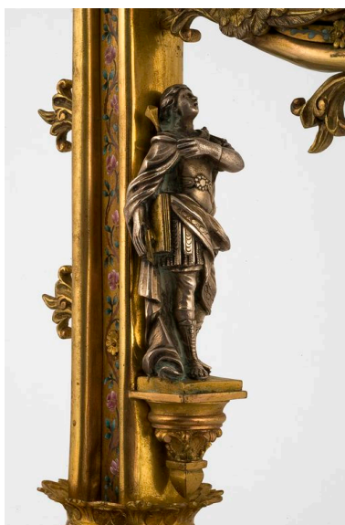
Détail du crosaron : figurine de saint Quentin.