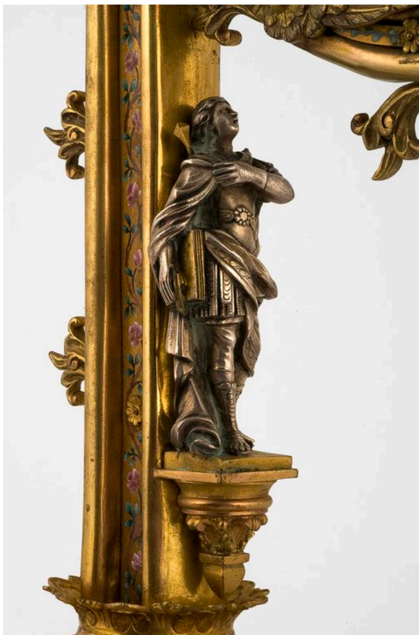
Détail du crosseron : figurine de saint Quentin.