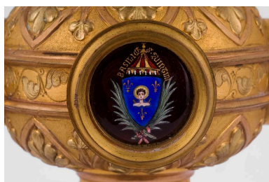
Détail du crosseron : armoiries de la basilique.