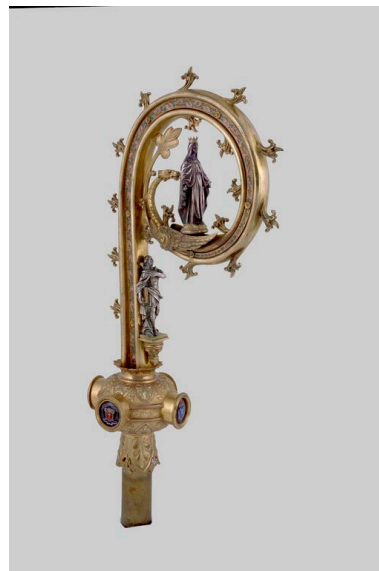
Le crosaron : vue de trois-quarts.