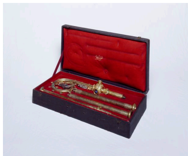
Vue de la crosse dans son écrin. IVR22_20090200105XA