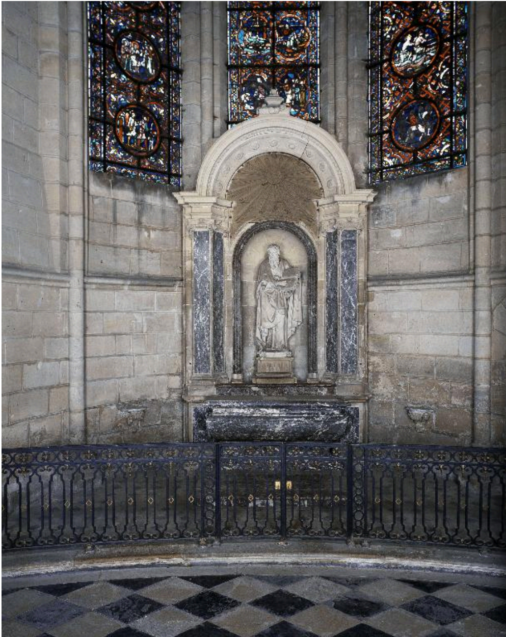
Vue générale de la chapelle Saint-Paul.