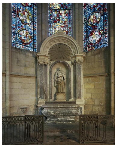
Vue générale de la chapelle Saint-Pierre. IVR22_20050200057VA