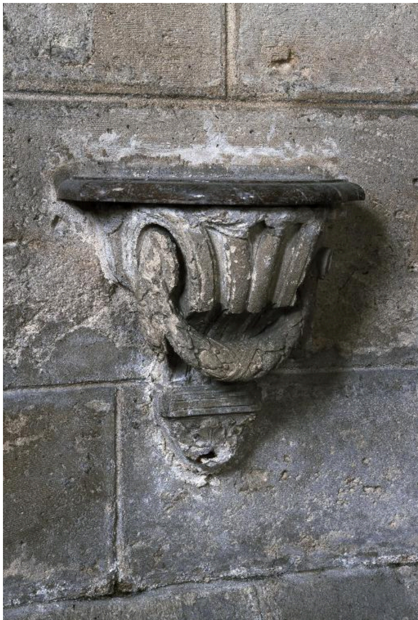
Crédence gauche de la chapelle Saint-Pierre, vue de trois-quarts.