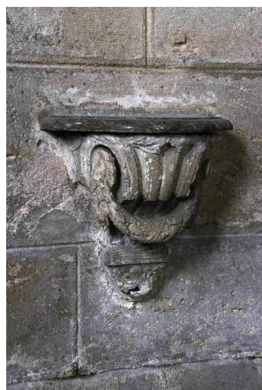
Crédence gauche de la chapelle Saint-Pierre, vue de trois-quarts.