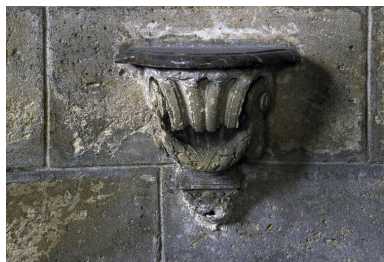
Crédence gauche de la chapelle Saint-Pierre, vue de face.