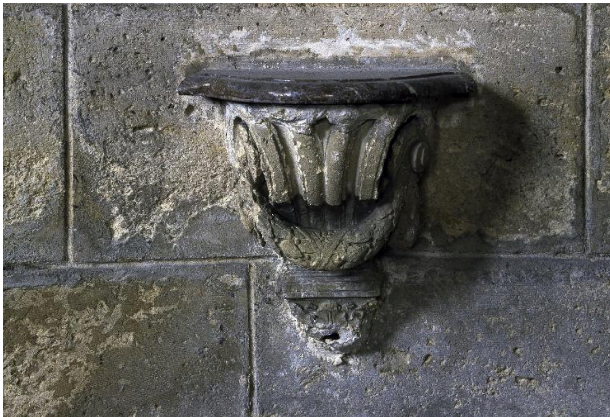
Crédence gauche de la chapelle Saint-Pierre, vue de face.