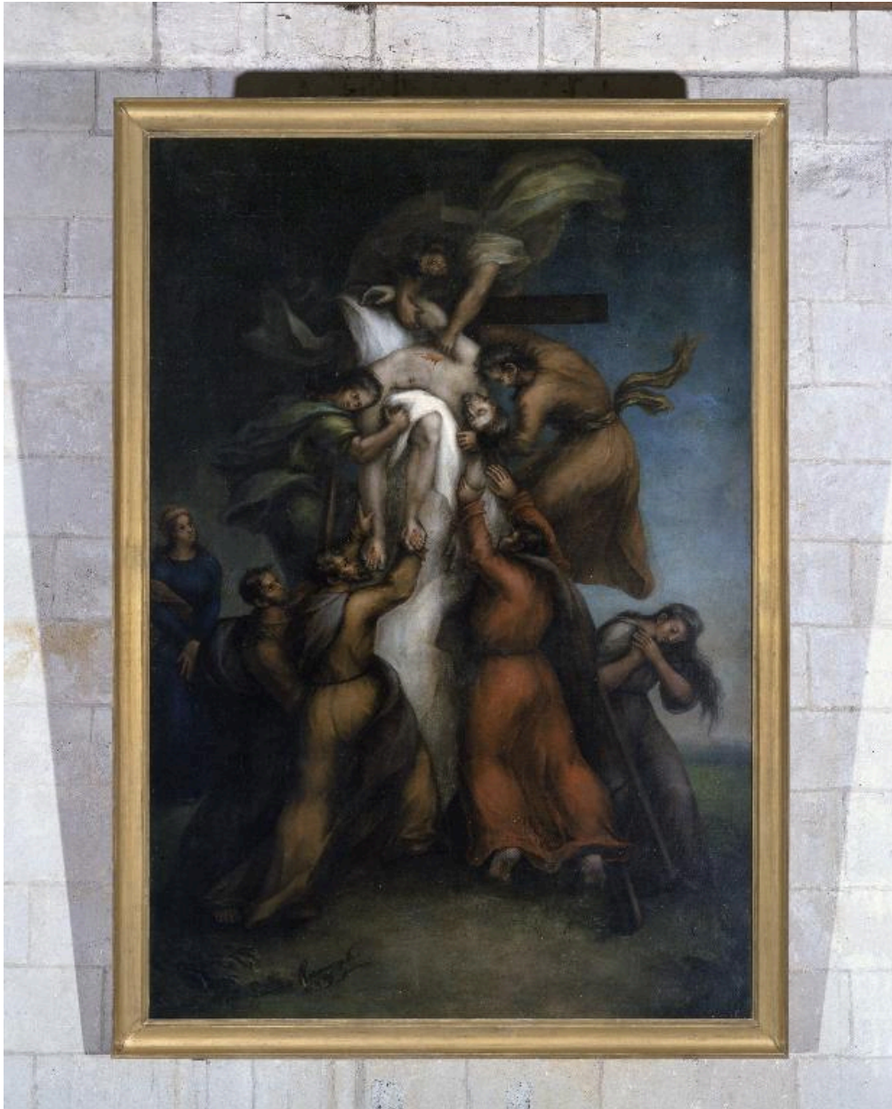
Vue du tableau, après restauration.