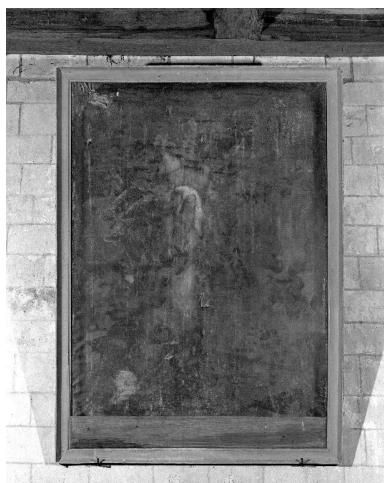
Vue du tableau, avant restauration. IVR22_19930200046V