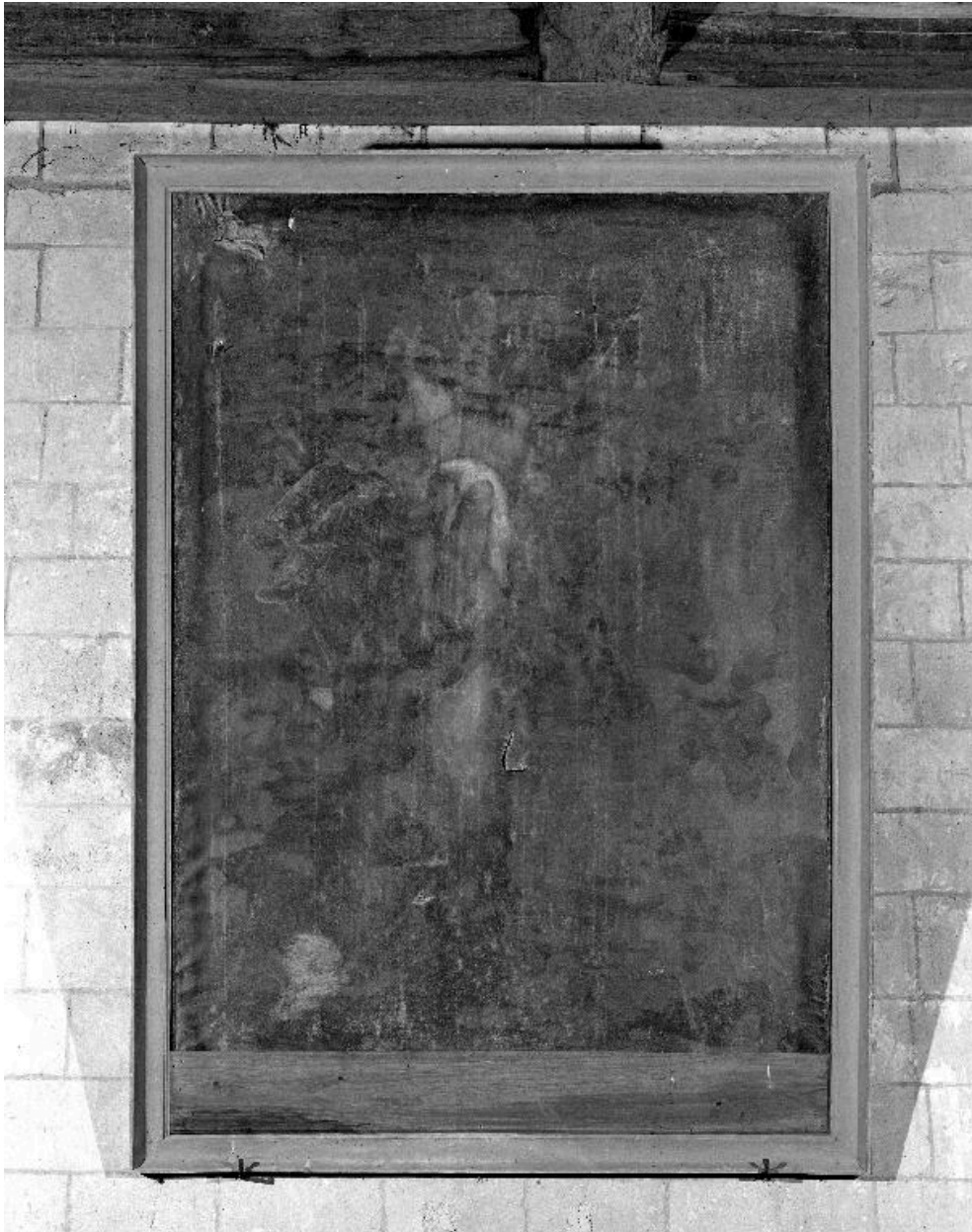
Vue du tableau, avant restauration.