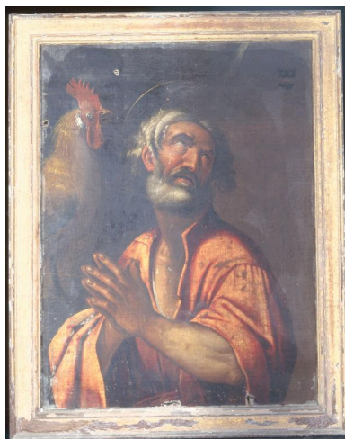
Vue d'ensemble. IVR22_19966003554XA