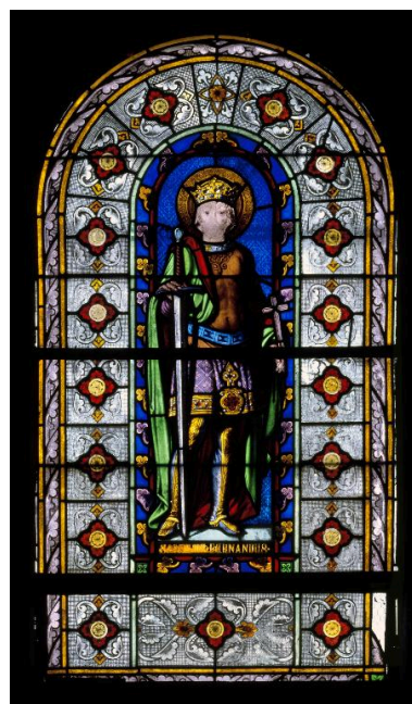
Vue générale de la verrière de la baie 7 : saint Ferdinand.