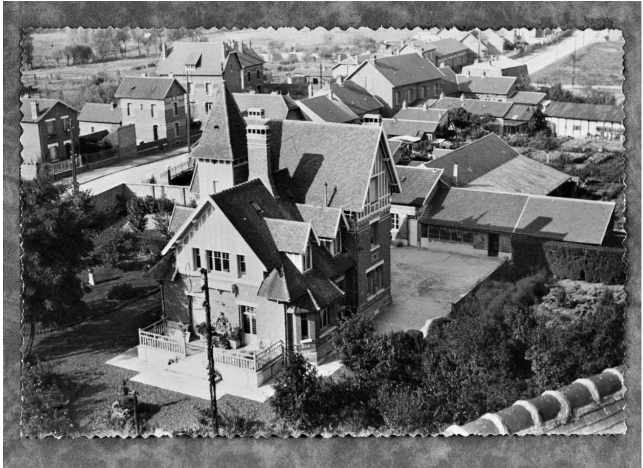
La villa L'Hérodelle. Vue prise depuis le clocher de l'église. Photographie, vers 1930.