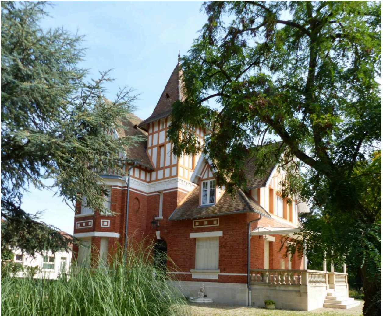
Vue de situation.