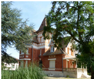
Vue de situation. IVR32_20220205061NUCA