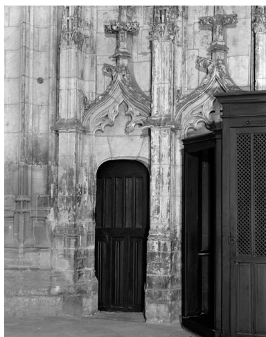
Vue de la porte, dans son environnement. IVR22_20010201976V