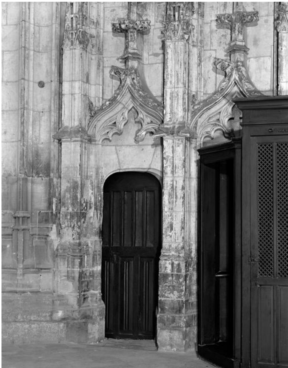
Vue de la porte, dans son environnement.