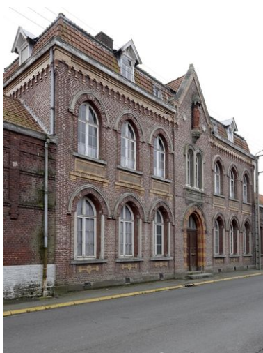
L'entrée principale.