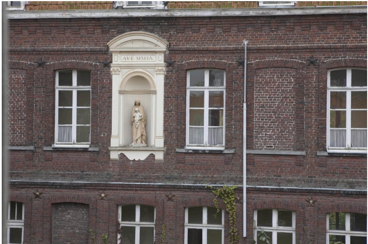
La niche abritant la Vierge, aile nord du bâtiment méridional.