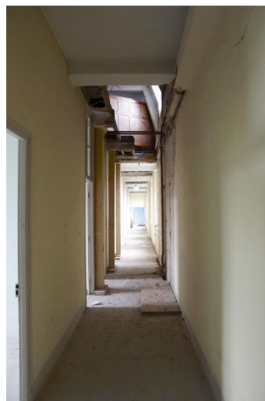
Le couloir desservant les salles de classes du premier étage du bâtiment sud.