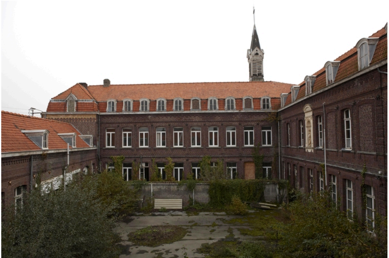
La cour ouest.