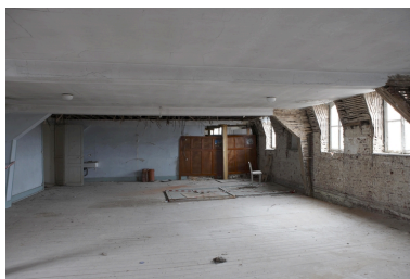
Un dortoir des combles.