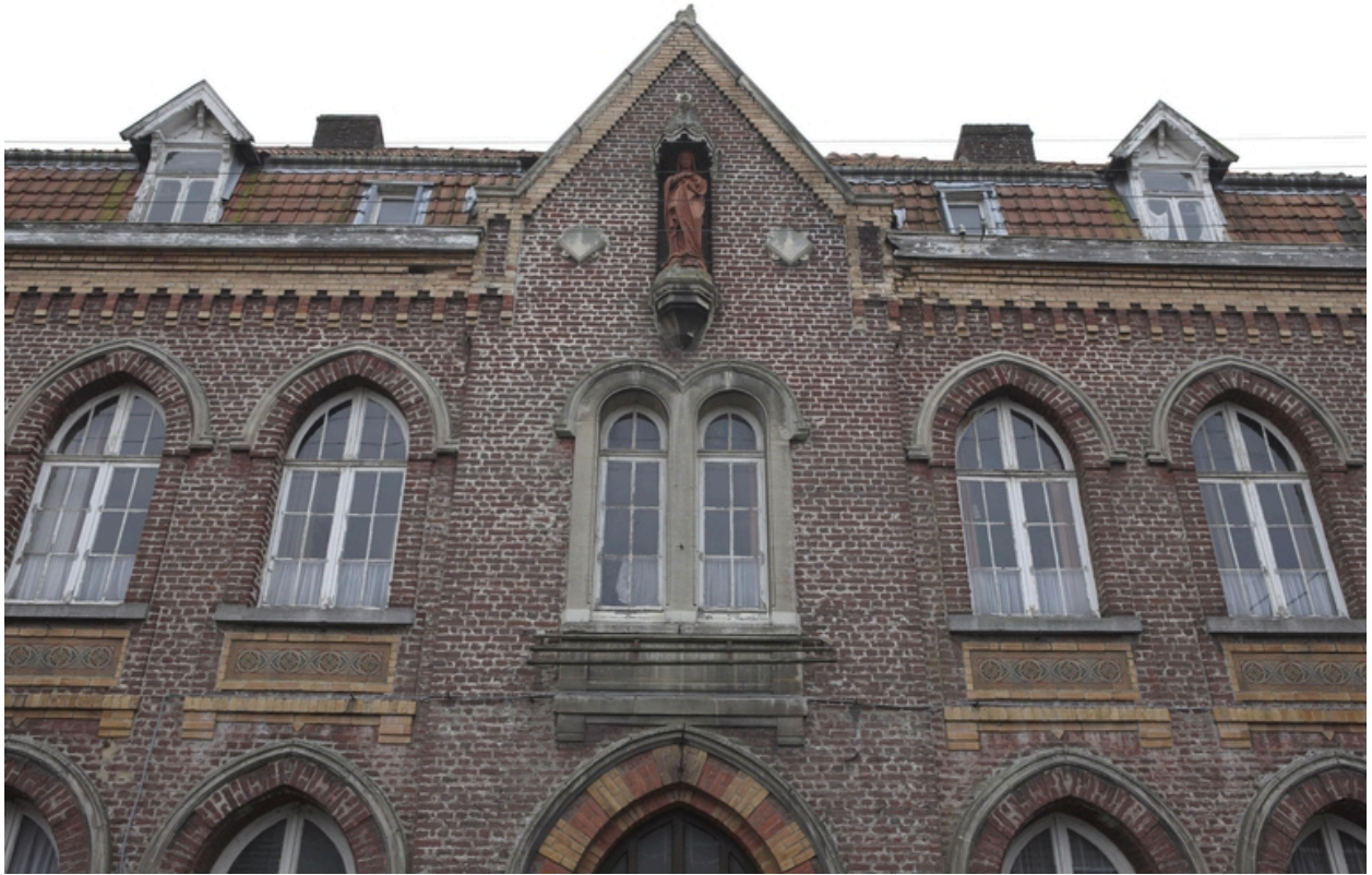
La travée centrale de l'entrée principale.