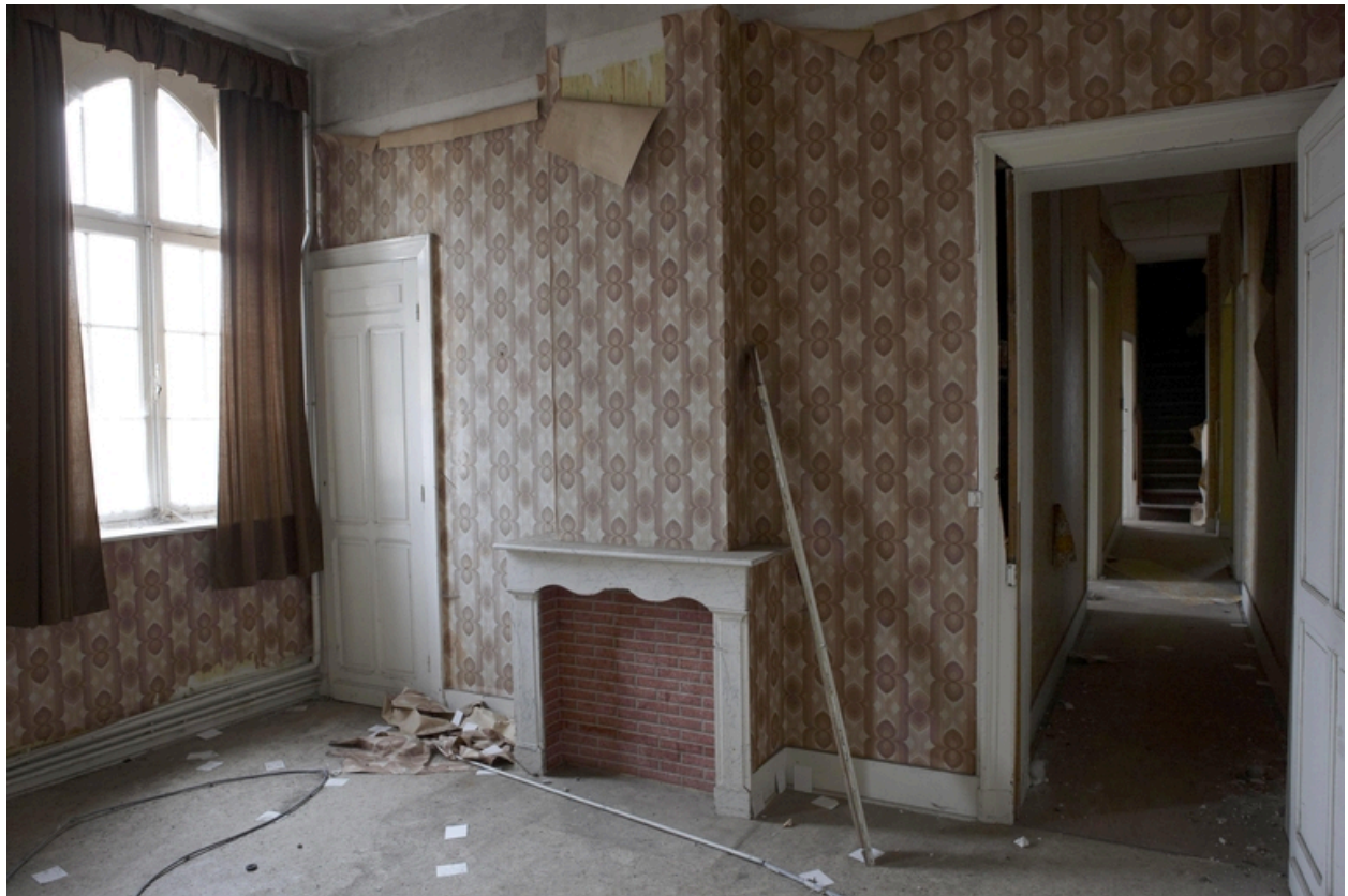
Une des chambres des soeurs supérieures.