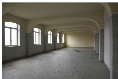
La chapelle.