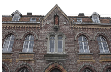
La travée centrale de l'entrée principale.