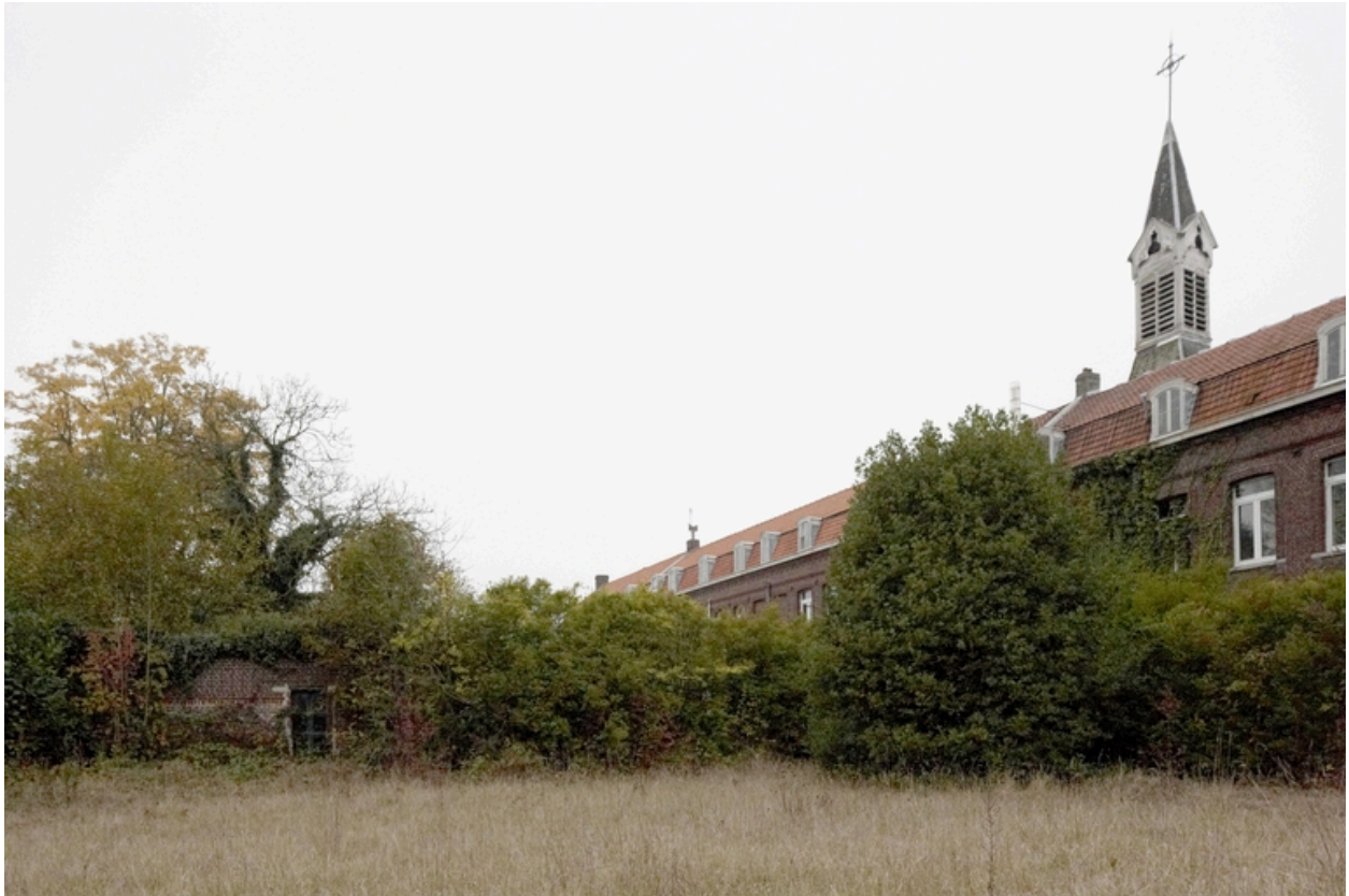
Le jardin du couvent.