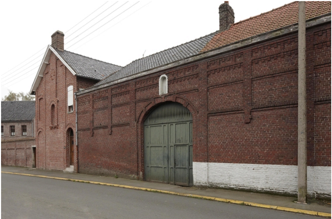
Les communs du couvent et la maison de l'aumônier attenante.