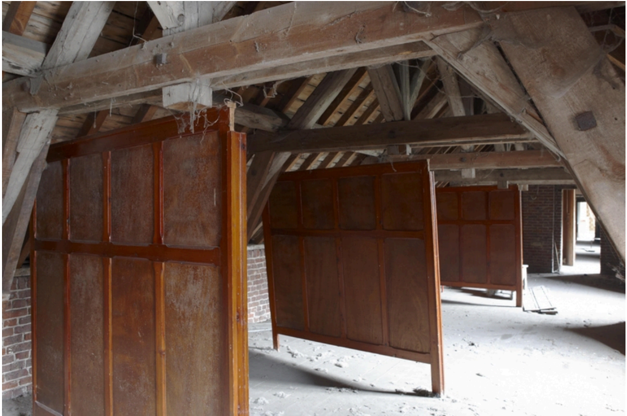
Les combles de l'aile sur rue.