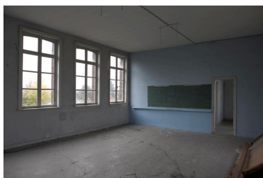
Une salle de classe.