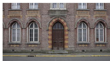
Le rez-de-chaussée de l'entrée principale.