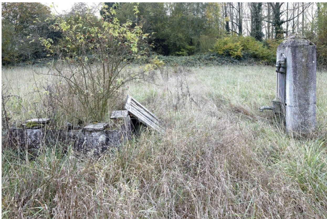
La pompe dans le jardin.