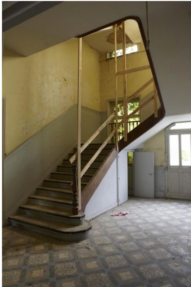
L'escalier de distribution.