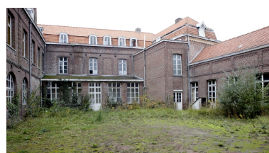
La cour est.