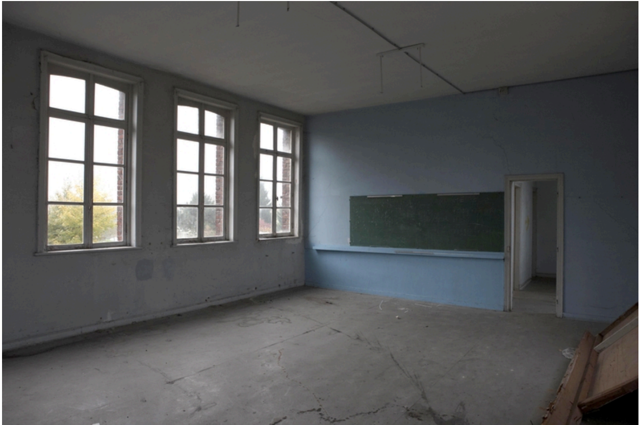
Une salle de classe.