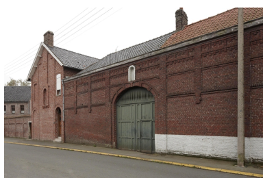
Les communs du couvent et la maison de l'aumônier attenante. IVR31_20095903371NUCA