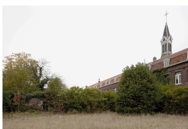
Le jardin du couvent.