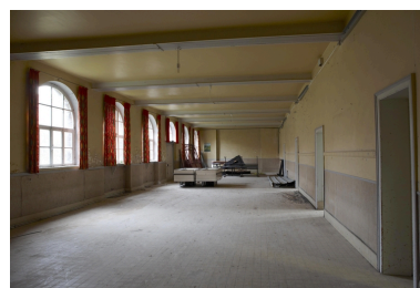
La salle des fêtes.