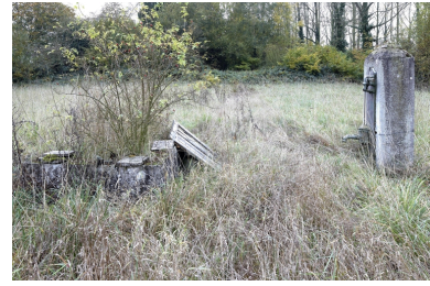
La pompe dans le jardin.