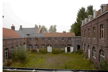
Vue générale de la cour orientale : l'aile sur rue, les communs, l'accès au jardin, l'aile méridionale. IVR31_20095903351NUCA