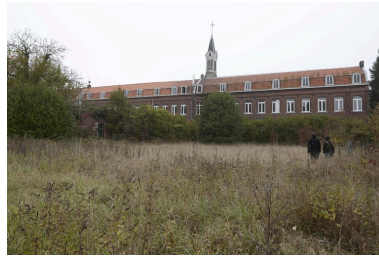
Le jardin. IVR31_20095903365NUCA