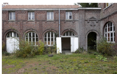
L'accès au jardin, entre les communs et le bâtiment sud.