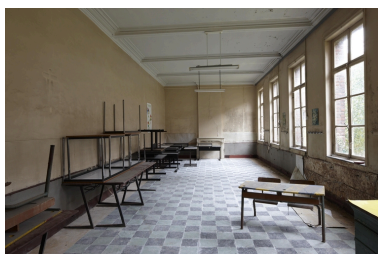
Une salle de classe (?).