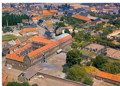
Vue aérienne du couvent, vers 1975.