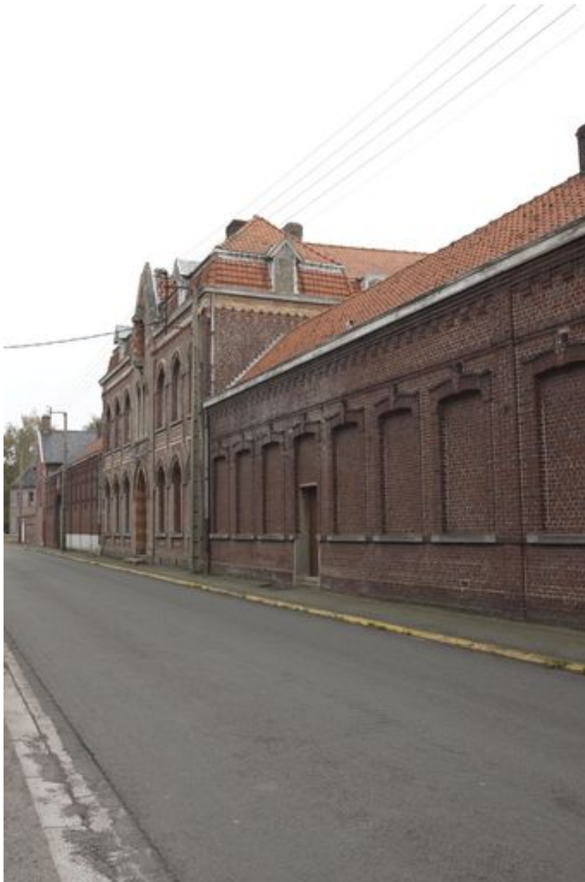
La façade sur la rue.