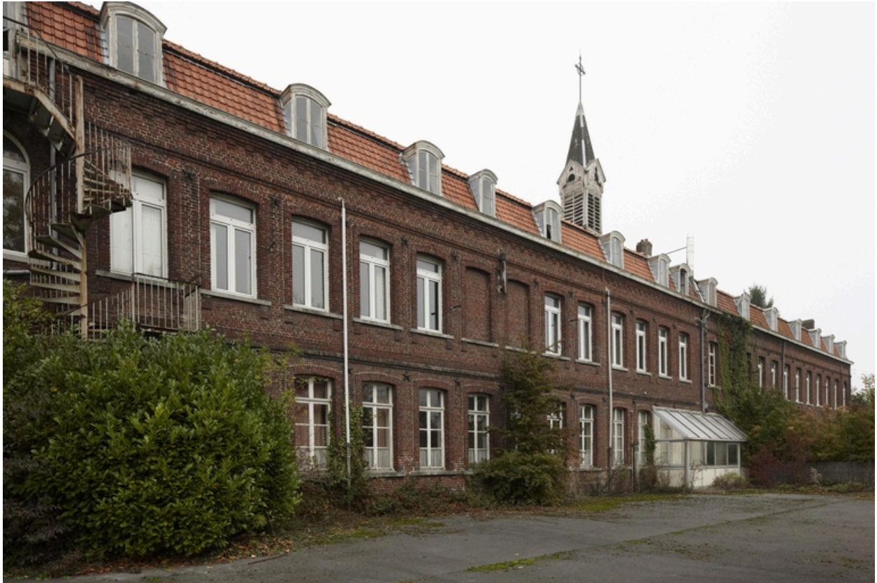
le bâtiment méridional, élévation sud, sur la cour arrière.