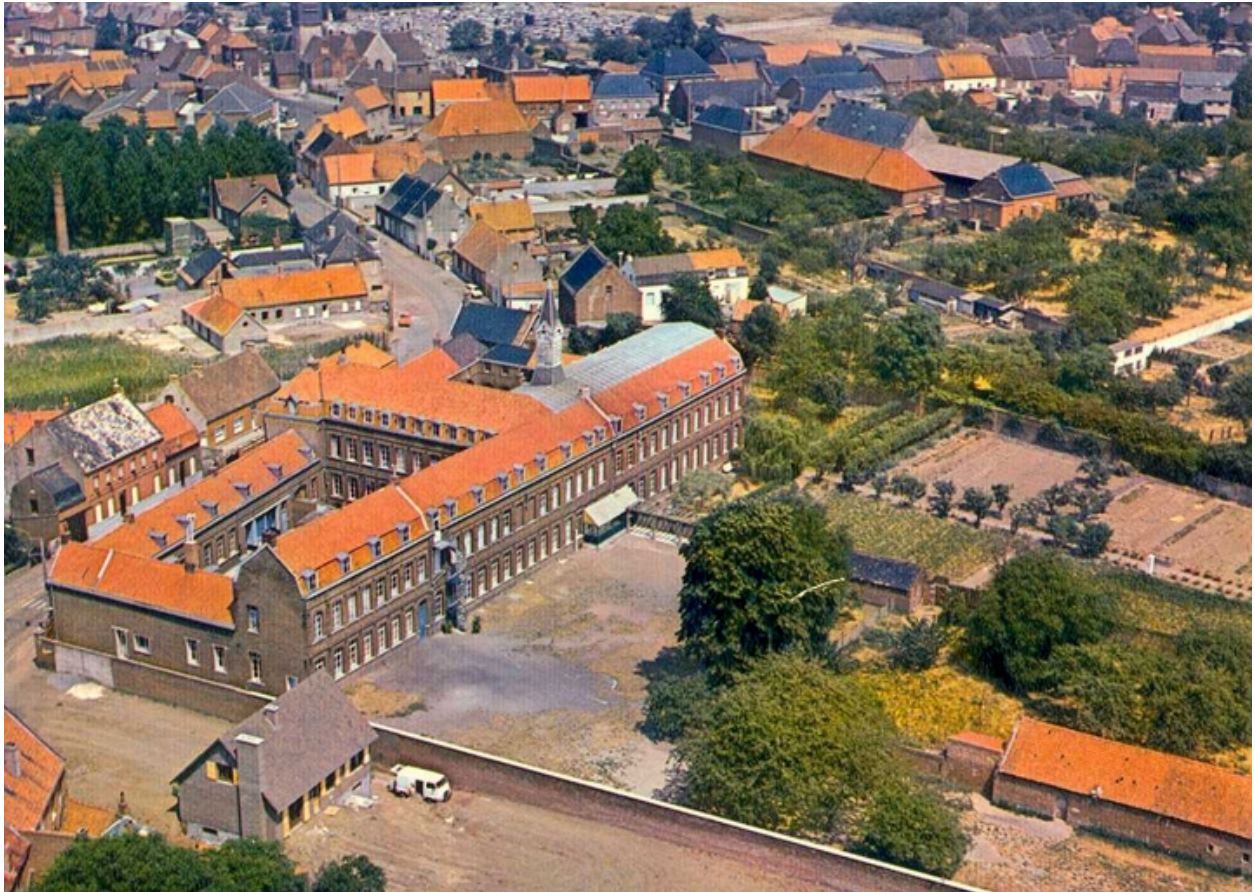
Vue aérienne du couvent, vers 1975.