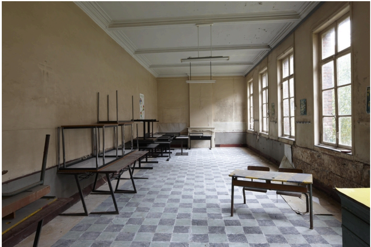
Une salle de classe (?).