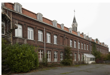
le bâtiment méridional, élévation sud, sur la cour arrière. IVR31_20095903368NUCA