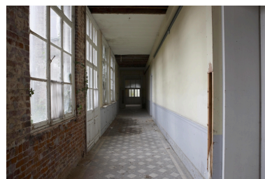
Le couloir reliant les ailes. IVR31_20095903332NUCA