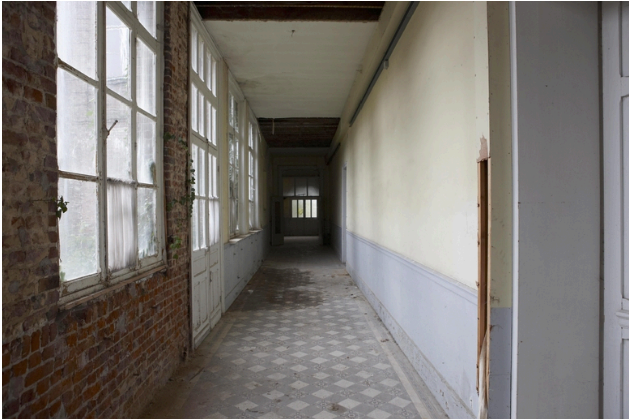
Le couloir reliant les ailes.