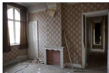
Une des chambres des sœurs supérieures. IVR31_20095903348NUCA