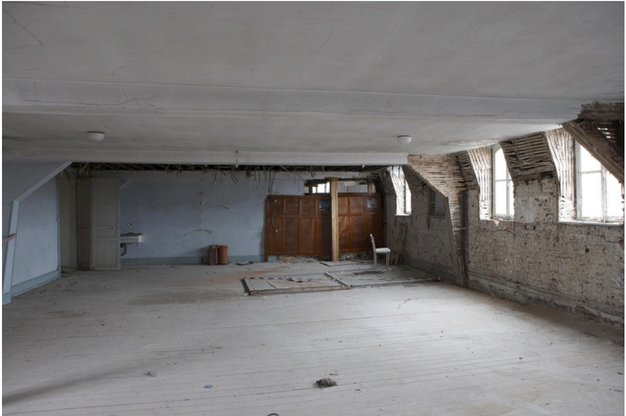
Un dortoir des combles.