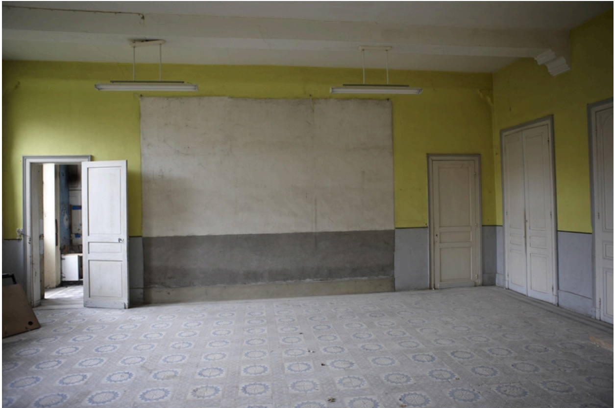
Le réfectoire et les cuisines à l'arrière-plan gauche.