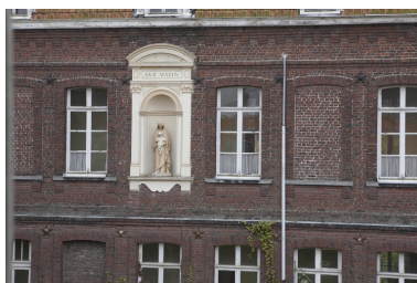
La niche abritant la Vierge, aile nord du bâtiment méridional. IVR31_20095903347NUCA