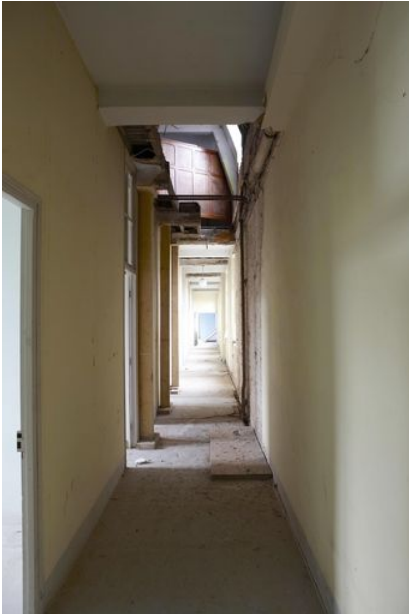
Le couloir desservant les salles de classes du premier étage du bâtiment sud.