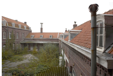
Les combles de la cour ouest.