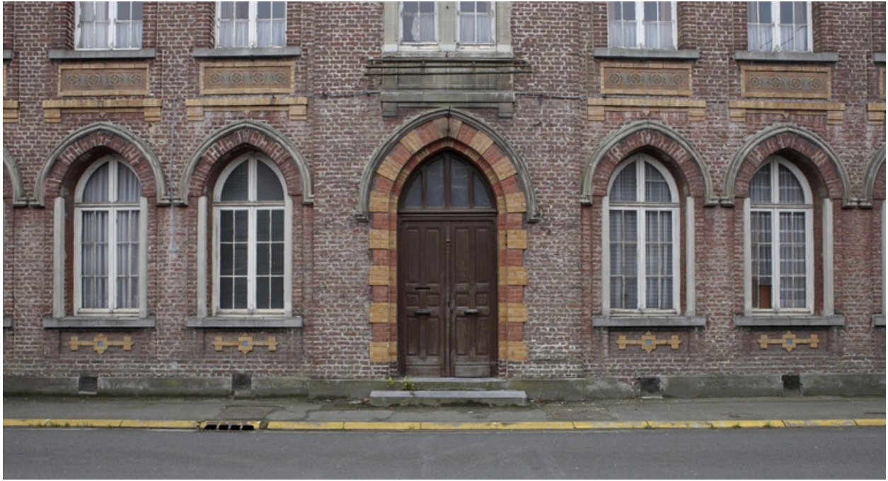
Le rez-de-chaussée de l'entrée principale.