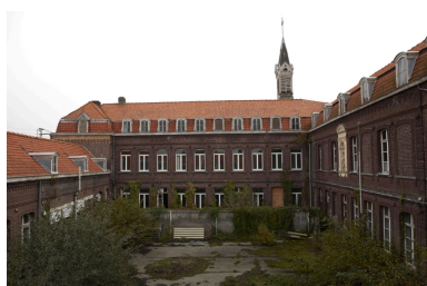
La cour ouest.