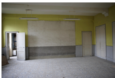
Le réfectoire et les cuisines à l'arrière-plan gauche.