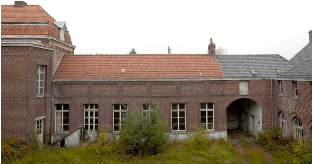
La cour orientale : le rez-de-chaussée de l'aile nord, le porche et l'amorce de l'aile (est) en retour.