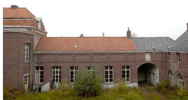
La cour orientale : le rez-de-chaussée de l'aile nord, le porche et l'amorce de l'aile (est) en retour.