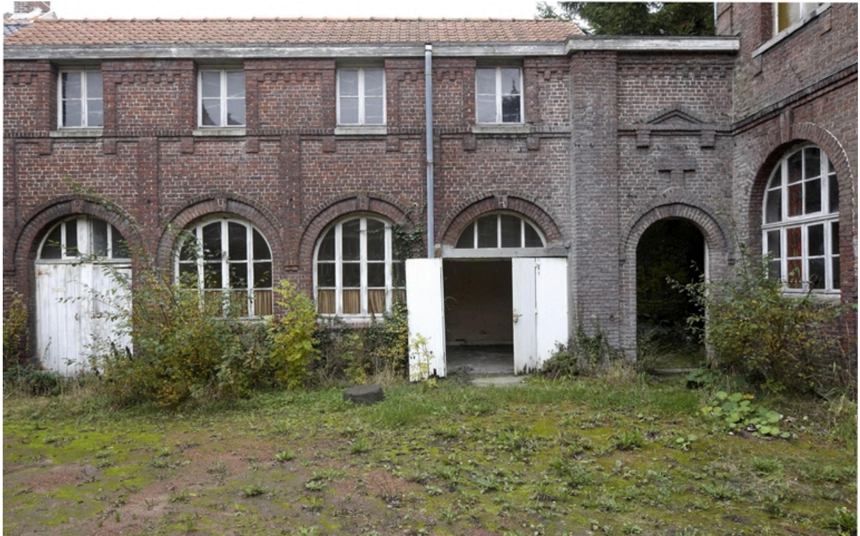
L'accès au jardin, entre les communs et le bâtiment sud.