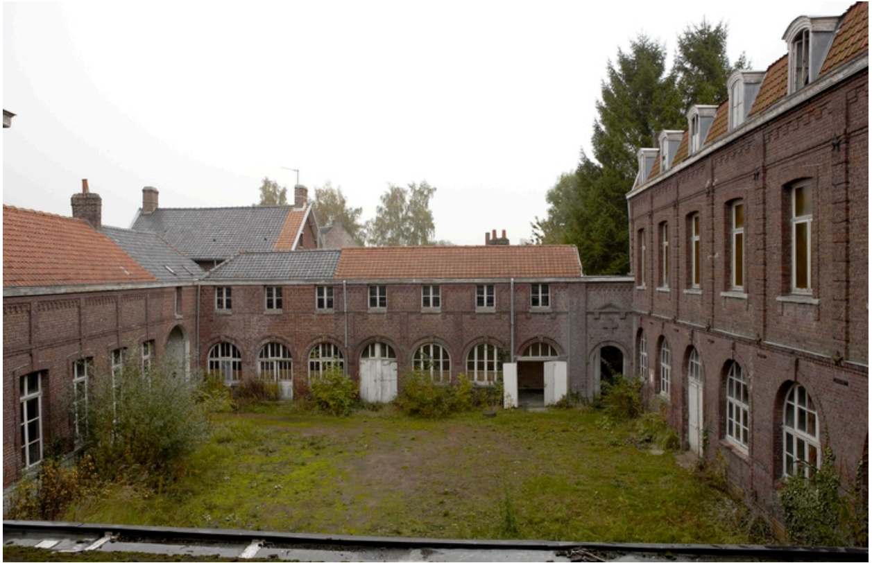
Vue générale de la cour orientale : l'aile sur rue, les communs, l'accès au jardin, l'aile méridionale.