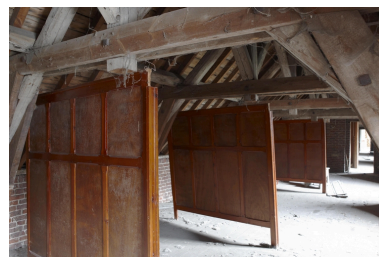
Les combles de l'aile sur rue. IVR31_20095903346NUCA