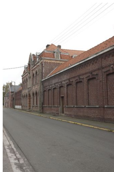
La façade sur la rue. IVR31_20095903376NUCA