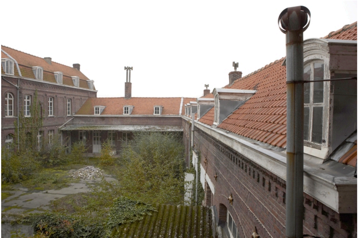
Les combles de la cour ouest.