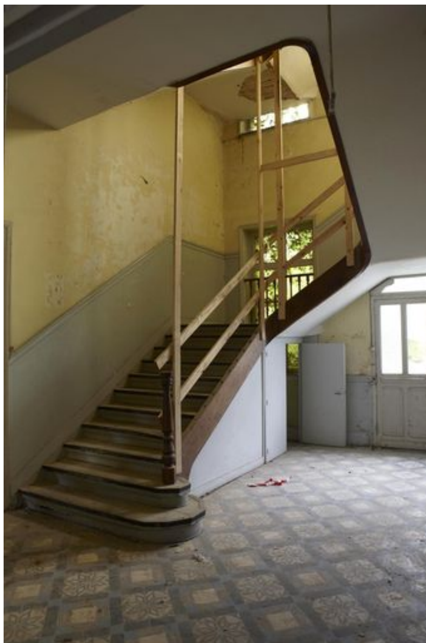
L'escalier de distribution.