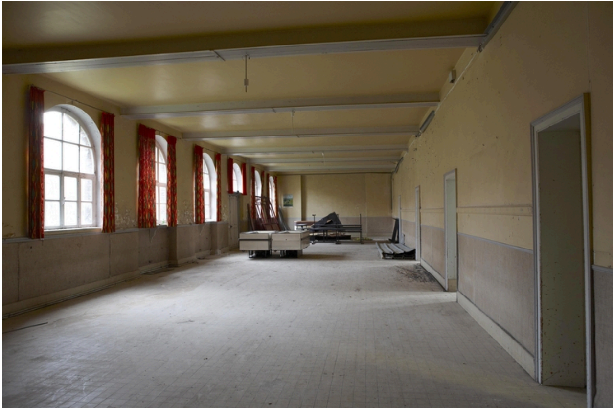
La salle des fêtes.