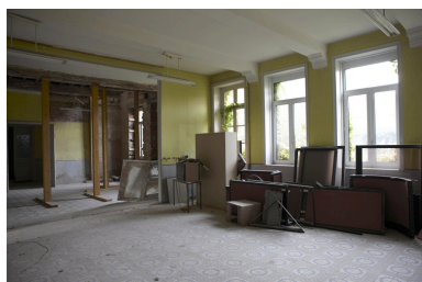
Le réfectoire.