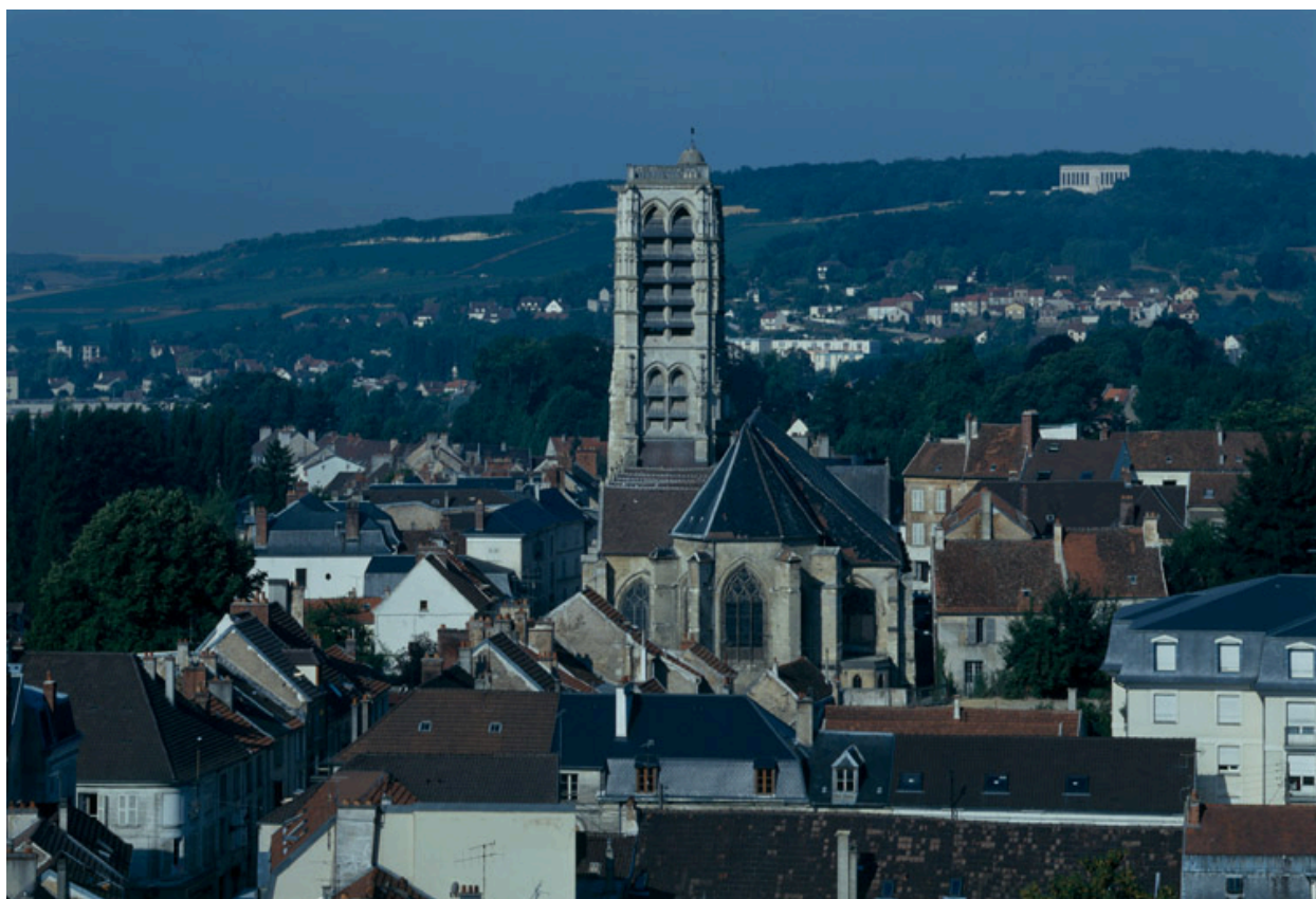
La ville de Château-Thierry.