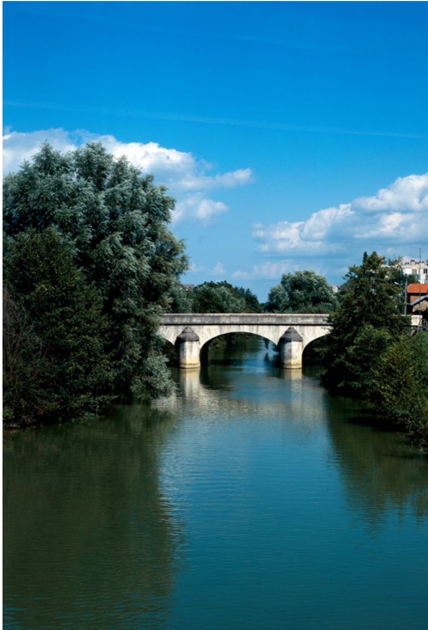
Pont sur la Marne.