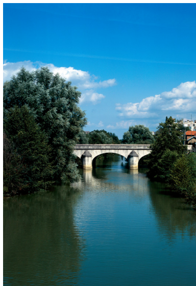
Pont sur la Marne. IVR22_19940200817XA