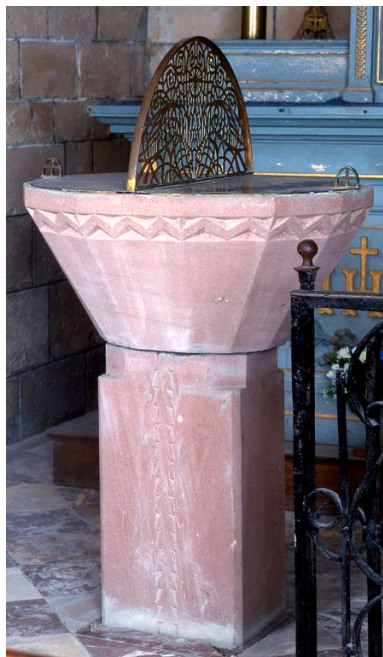
Vue générale IVR22_20030203306XA