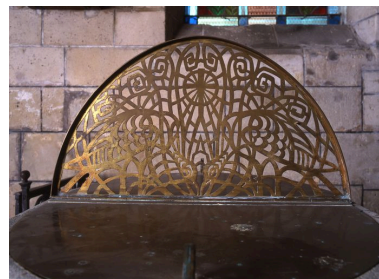
Vue du couvercle IVR22_20030203308XA