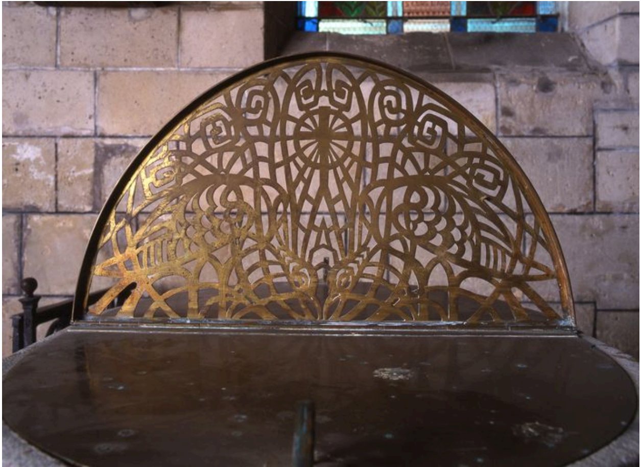
Vue du couvercle