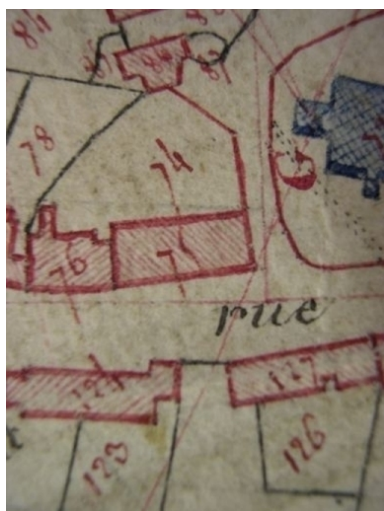
Extrait de la feuille cadastrale E2. Plan de situation en 1810.

IVR31_20045905247NUCA