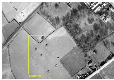
Situation de l'ensemble de casemate sur une photographie aérienne du 13 mars 1965 (IGN, Geoportail). IVR32_20175900926NUCA