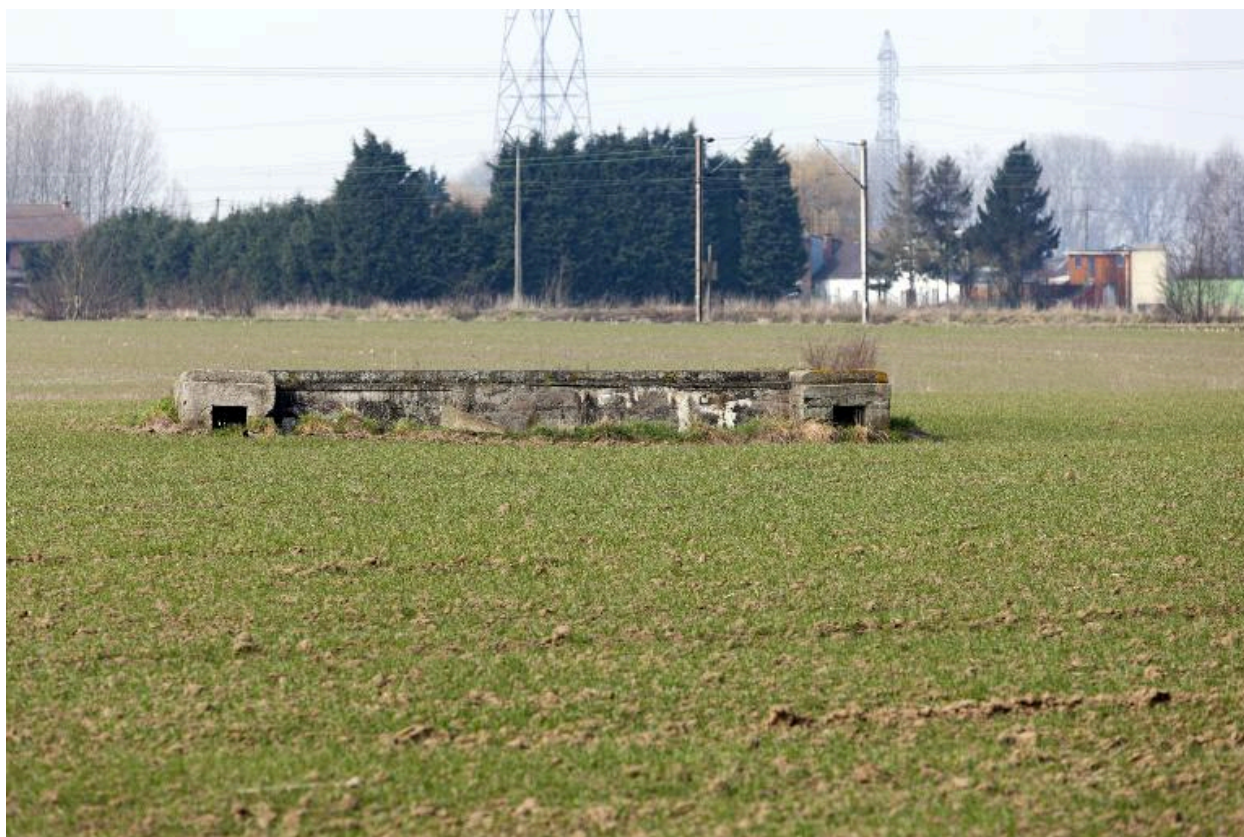
Ouvrage en U, vers l'ouest