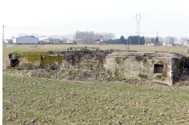
Ouvrage, en L, vers l'ouest IVR31_20135901175NUCA