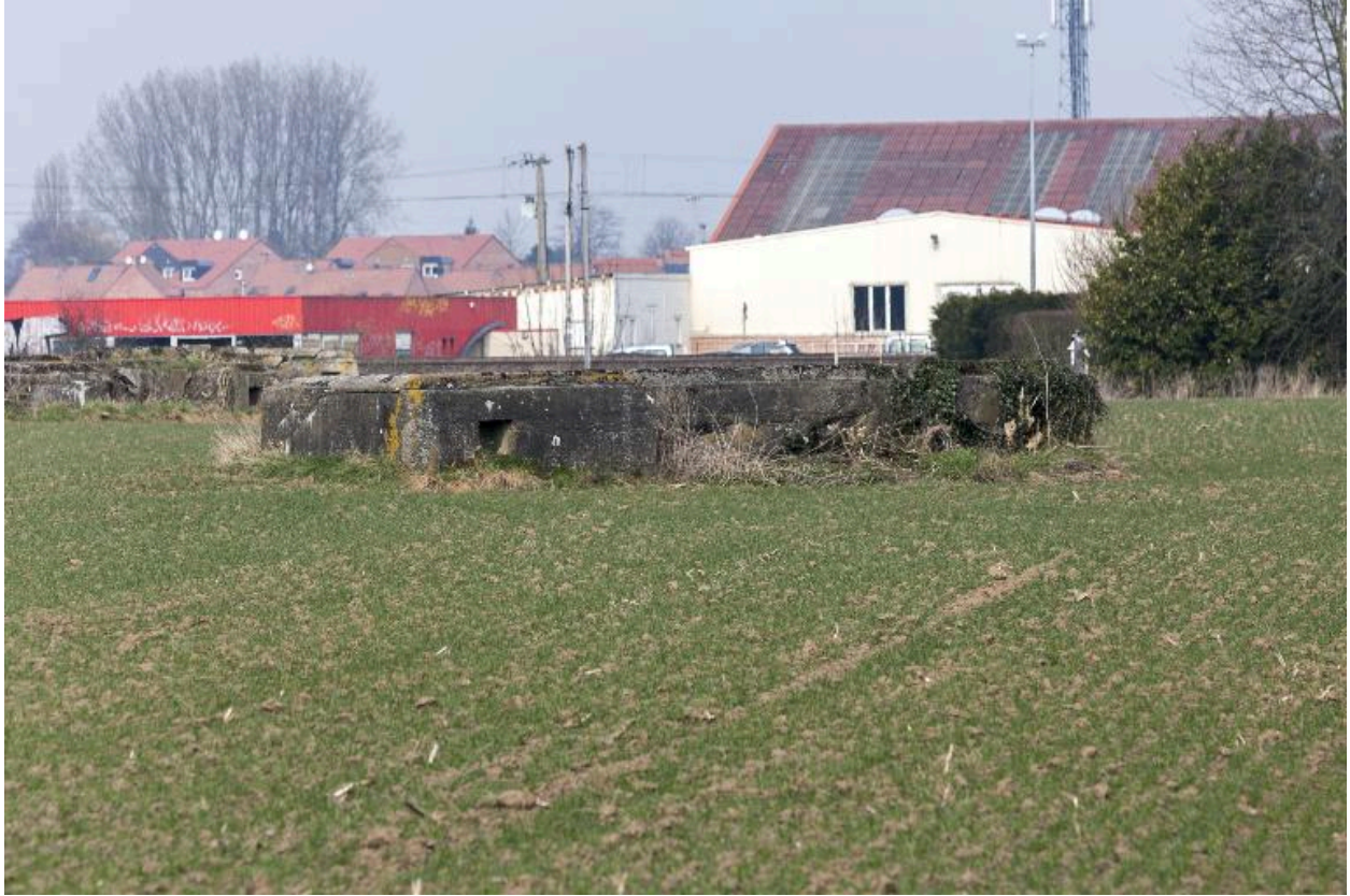
Ouvrage en U.