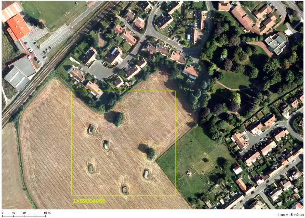
Situation de l'ensemble de casemate sur une photographie aérienne de 2014