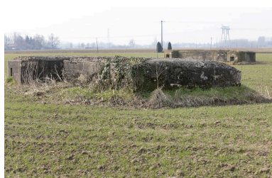
Ouvrage en L IVR31_20135901176NUCA