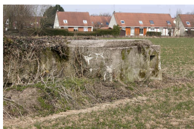
Détail de l'ouvrage en L précédent.