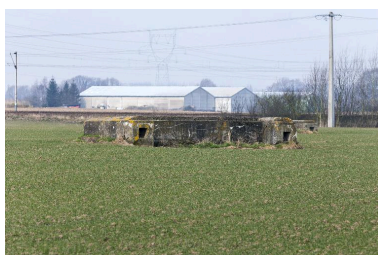
Le même, vu vers le nord-ouest IVR31_20135901167NUCA