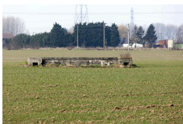
Ouvrage en U, vers l'ouest IVR31_20135901171NUCA