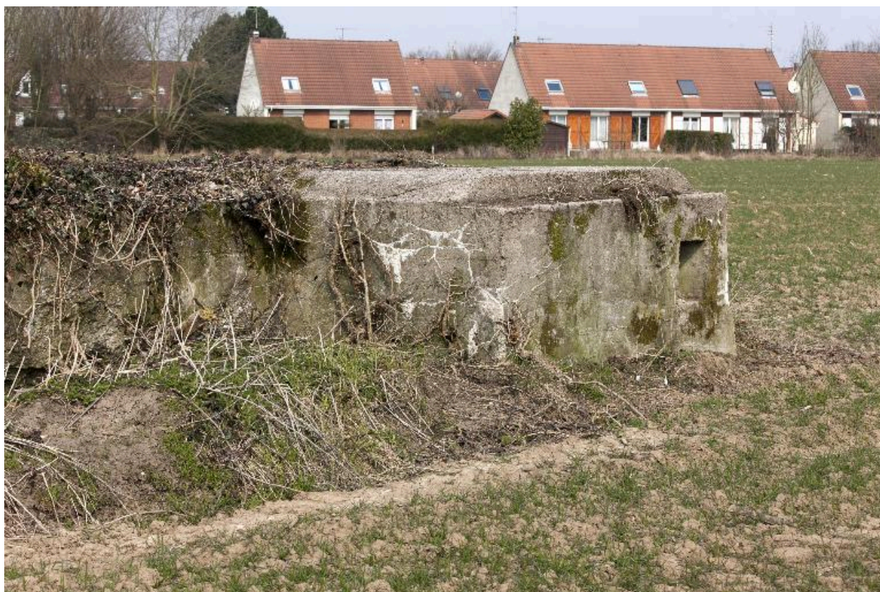
Détail de l'ouvrage en L précécent.