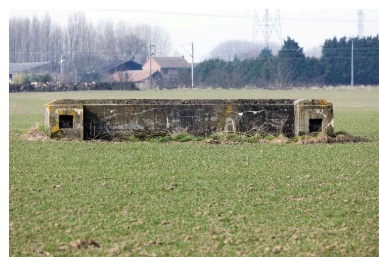
Autre ouvrage en U, vers l'ouest