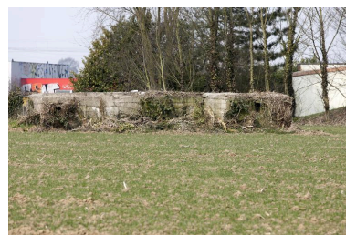
Ouvrage en U IVR31_20135901174NUCA