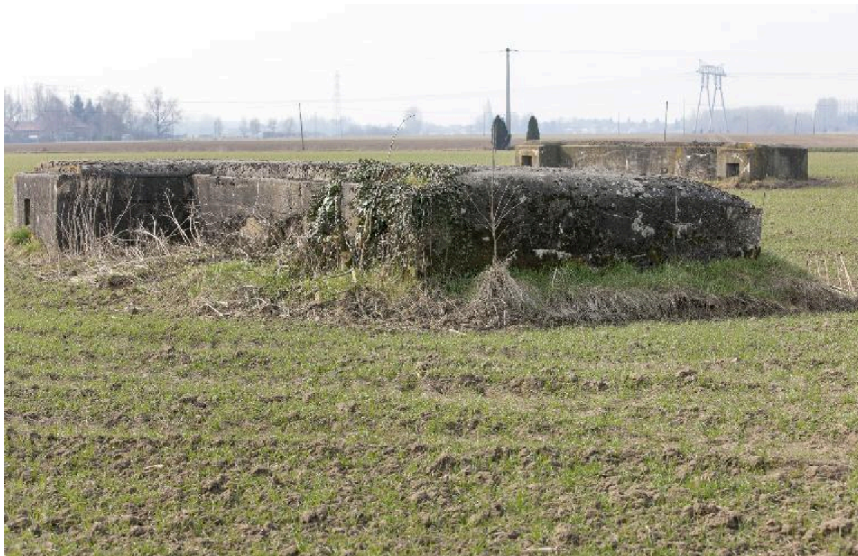
Ouvrage en L