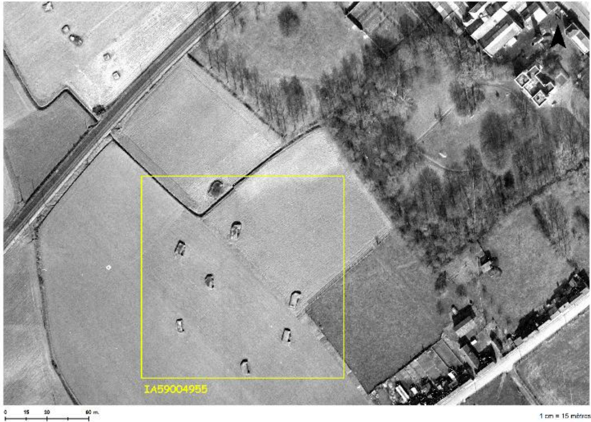
Situation de l'ensemble de casemate sur une photographie aérienne du 13 mars 1965.