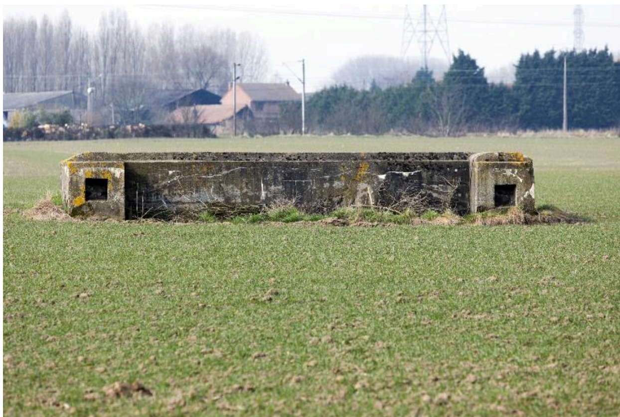
Autre ouvrage en U, vers l'ouest