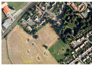
Situation de l'ensemble de casemate sur une photographie aérienne de 2014 IVR32_20175900927NUCA