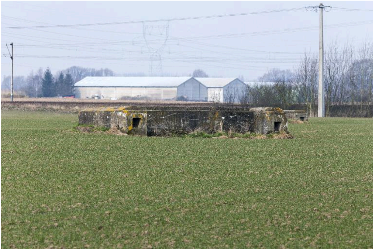
Le même, vu vers le nord-ouest