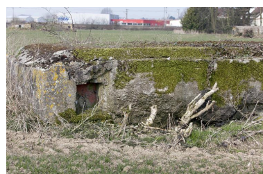
Détail de l'ouvrage en L précédent. Cette niche était-elle destinée à accueillir des munitions ?