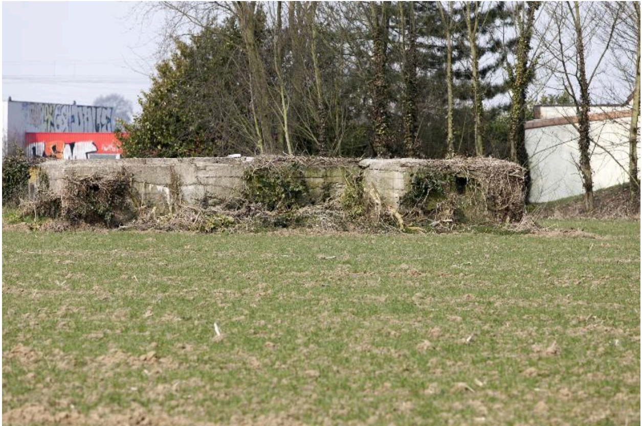
Ouvrage en U