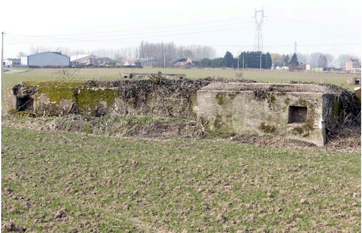
Ouvrage, en L, vers l'ouest