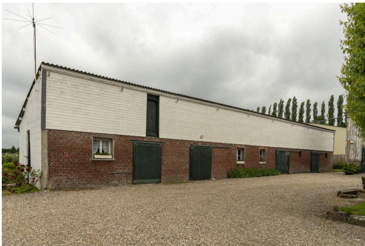
Écuries à chevaux, vue de la façade ouest depuis la cour.