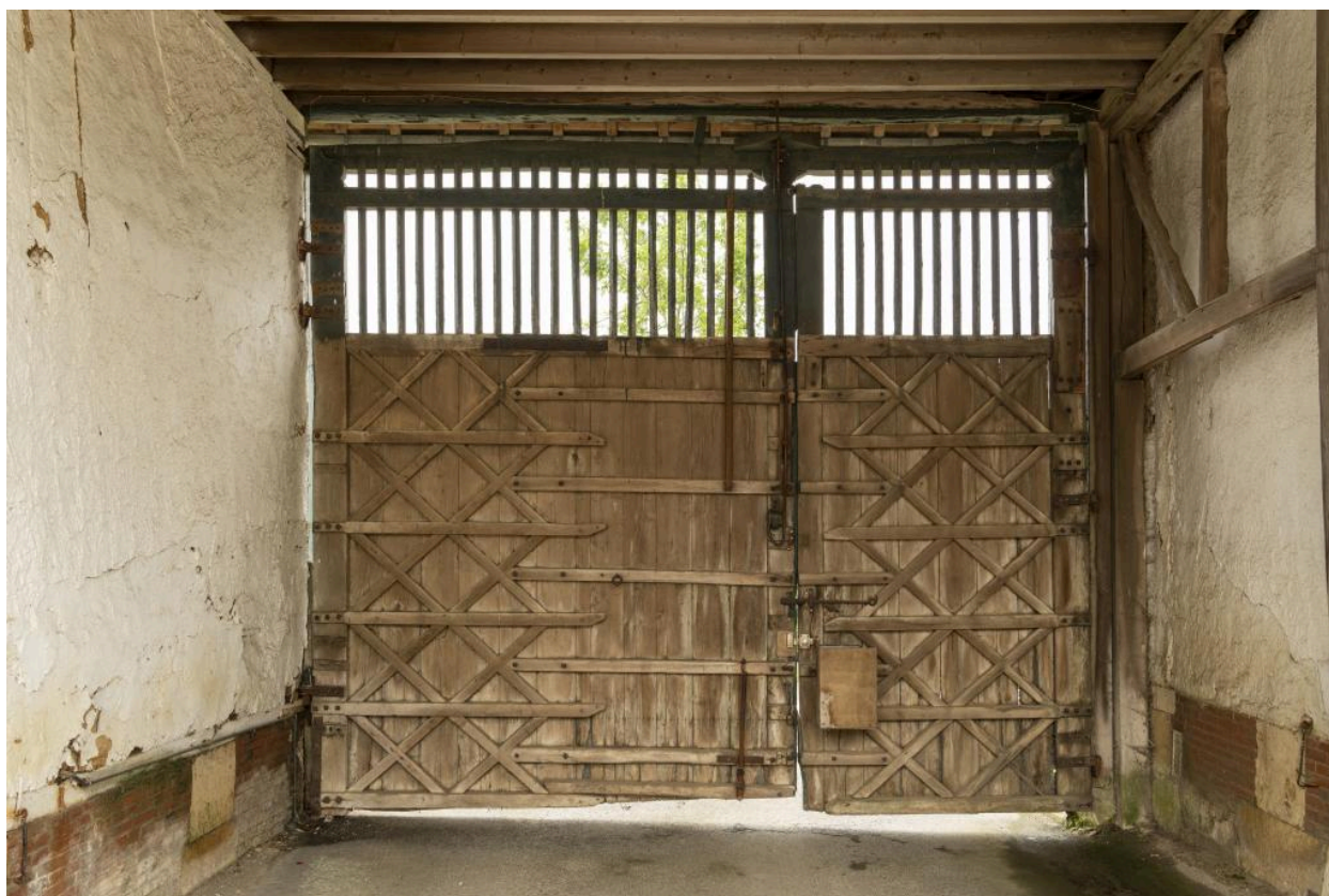
Revers de la porte de la charreterie, 4e quart 19e siècle, vue depuis le sud.