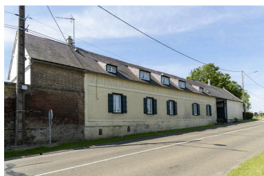
Vue du logis depuis le nord-est, sur la route de Rouen.