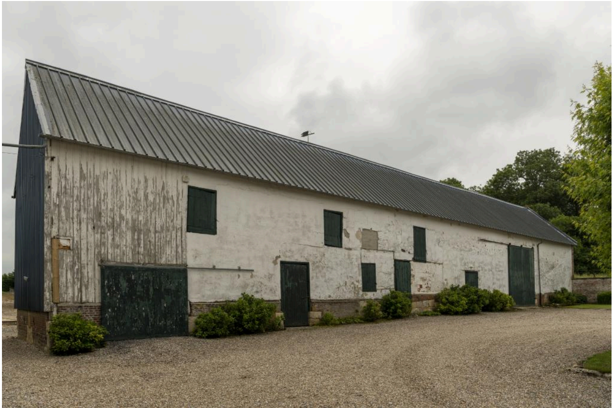
Grange, fenil et étable, en fond de cour, vue depuis le nord.