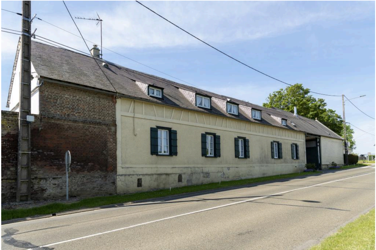
Vue du logis depuis le nord-est, sur la route de Rouen.