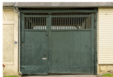
Porte charretière, vue de face depuis la rue, 4e quart 19e siècle.