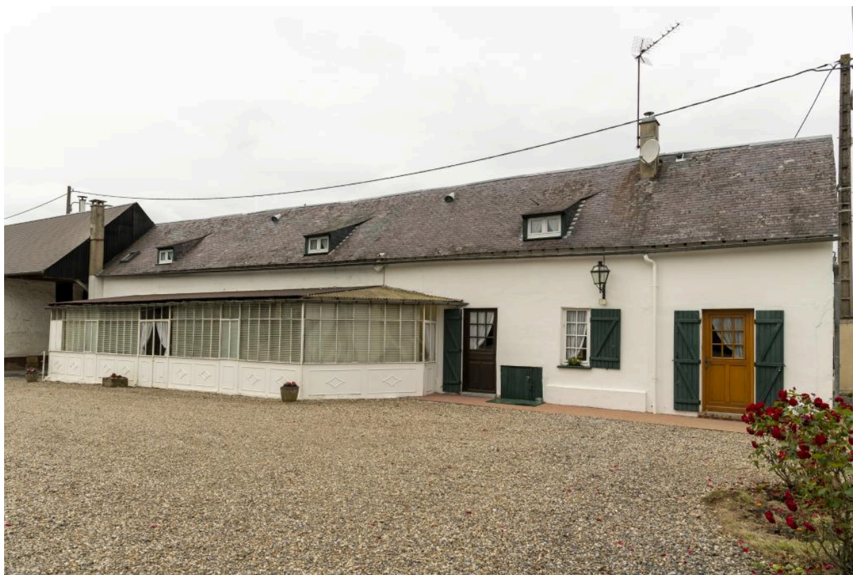
Logis avec véranda, vue de la façade sud depuis la cour.