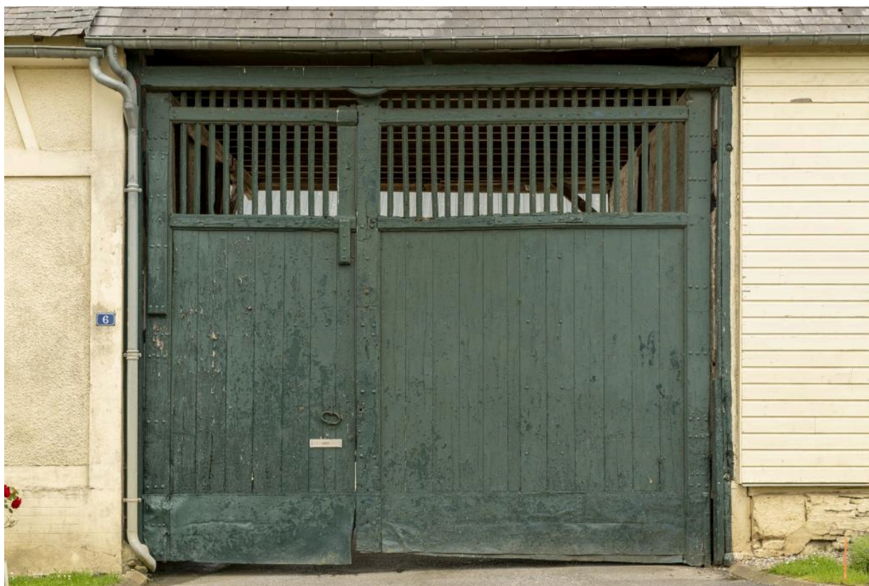
Porte charretière, vue de face depuis la rue, 4e quart 19e siècle.