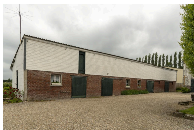
Écuries à chevaux, vue de la façade ouest depuis la cour. IVR32_20216000729NUCA