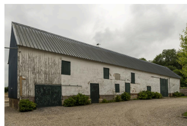
Grange, fenil et étable, en fond de cour, vue depuis le nord. IVR32_20216000727NUCA