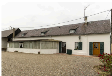
Logis avec véranda, vue de la façade sud depuis la cour.