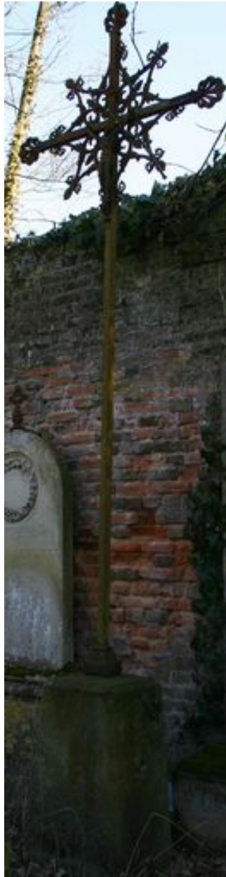
Croix funéraire en fer forgé.