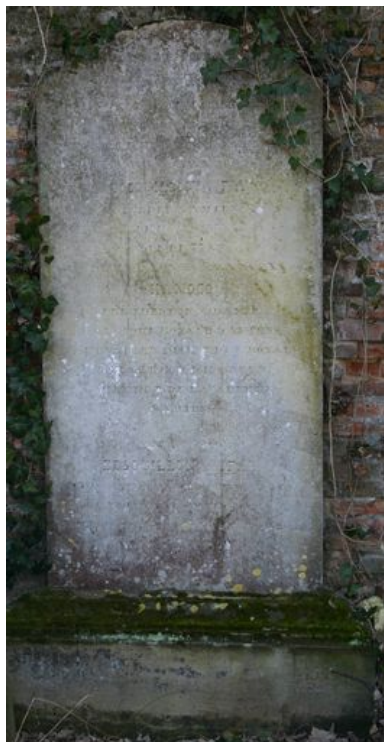
Stèle en chapeau-de-gendarme, vers 1839.