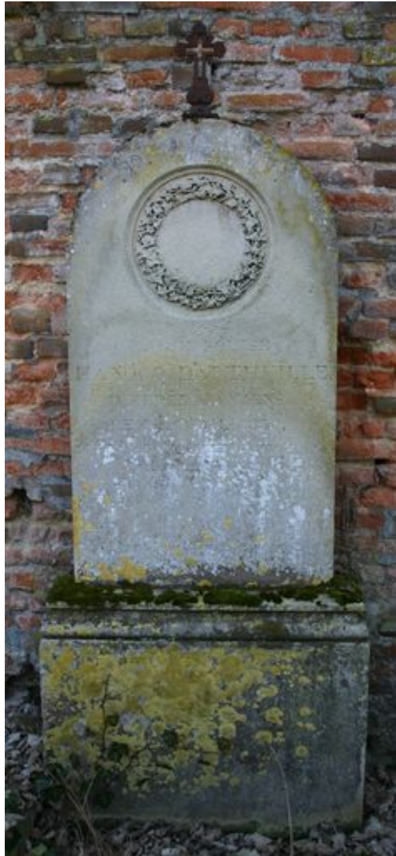
Stèle cintrée, vers 1858.