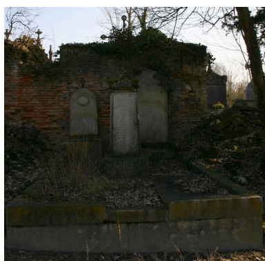
Vue générale. IVR22_20068000742NUCA