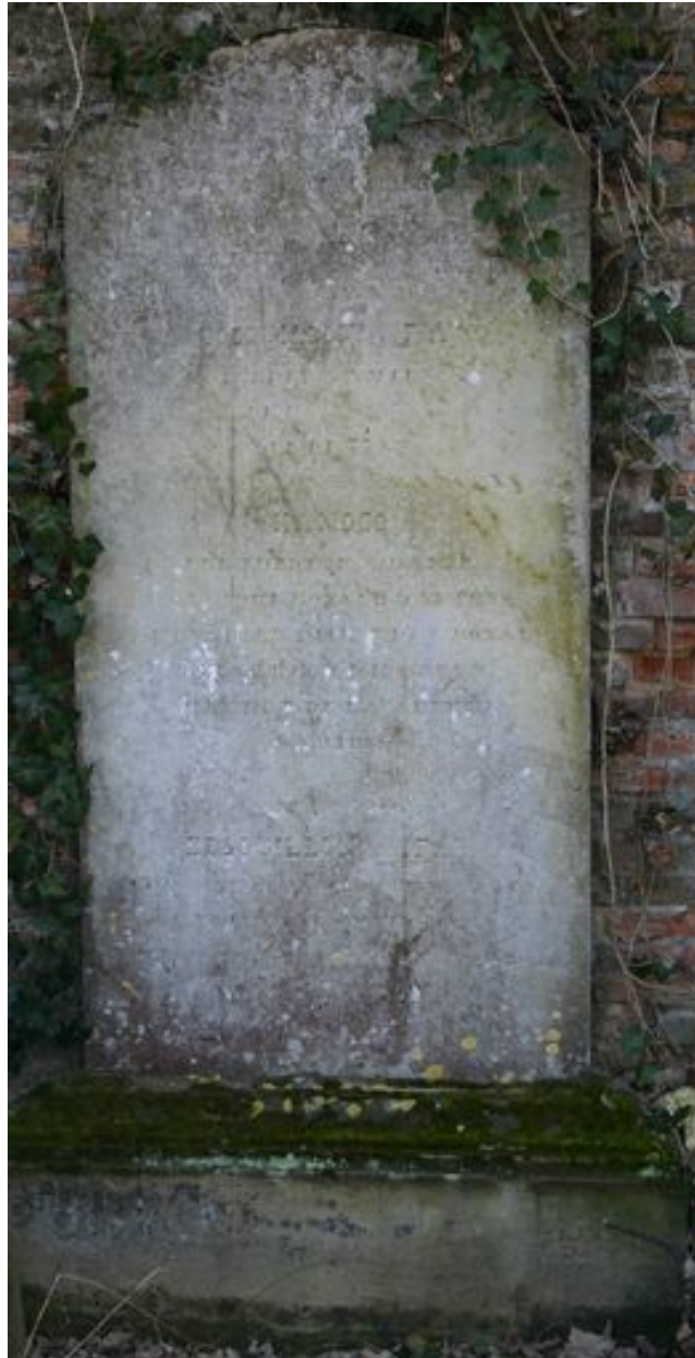
Stèle en chapeau-de-gendarme, vers 1839.