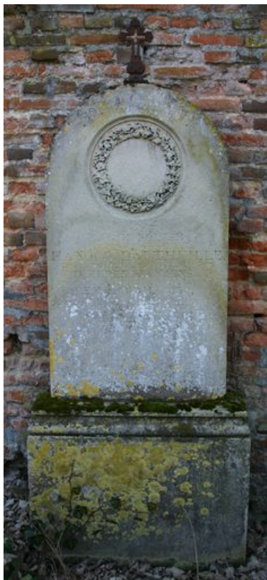
Stèle cintrée, vers 1858. IVR22_20068000745NUCA