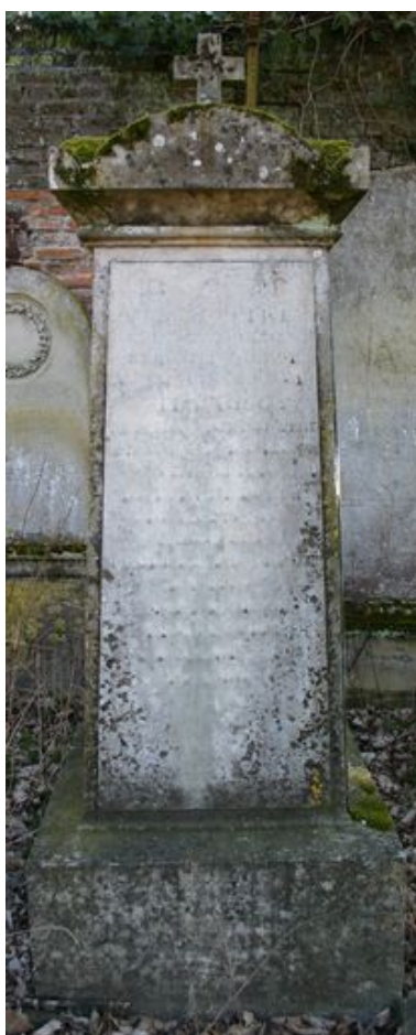
Cippe, vers 1839.