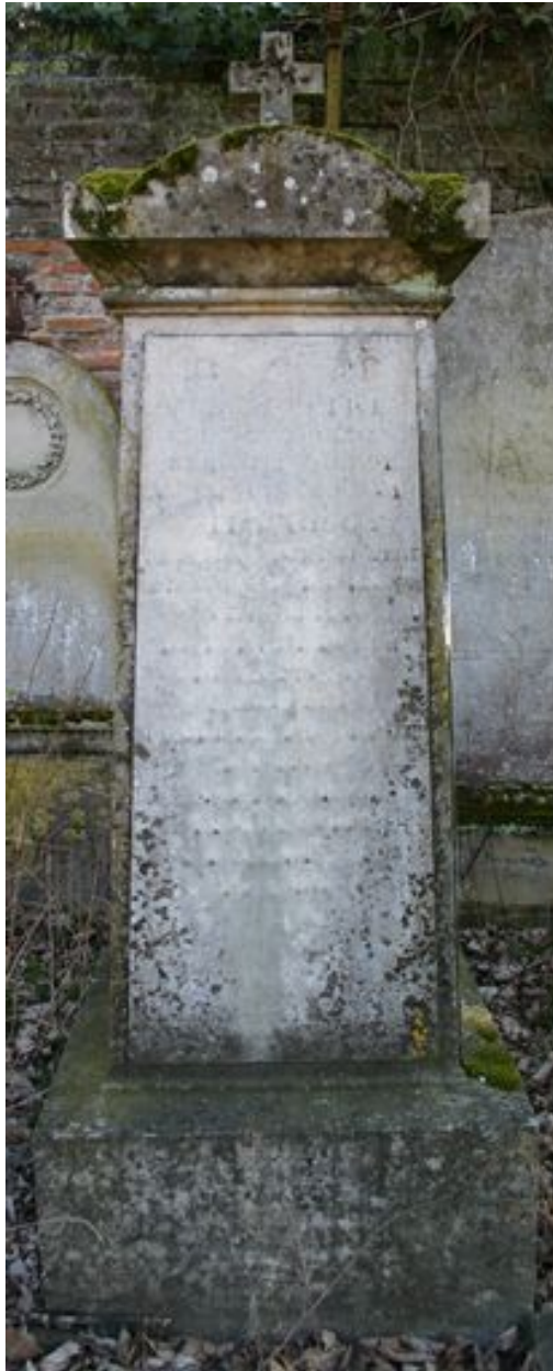
Cippe, vers 1839.