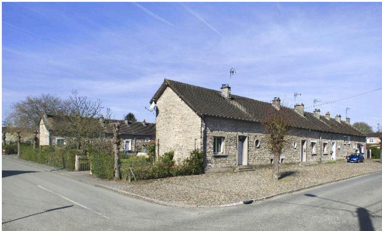
Maison à quatre unités d'habitation (7 à 13 rue des Alliés).