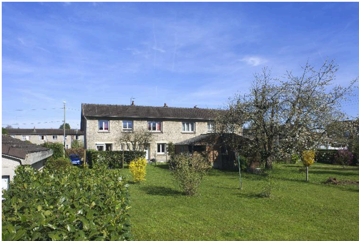
Maison à quatre unités d'habitation (rue de Verdun). Vue de situation avec les jardins au premier plan.