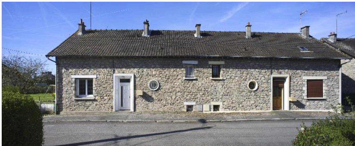
Maison à deux unités d'habitation (17-19 rue du Maréchal-Foch).