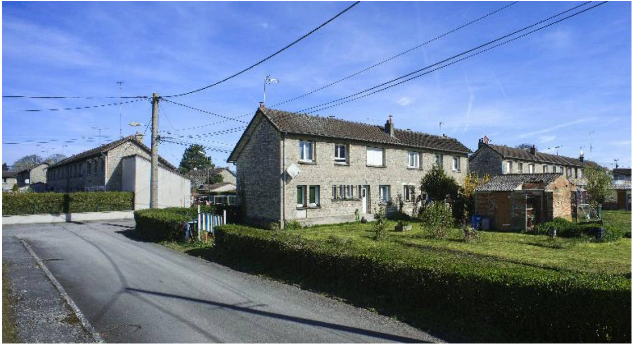
Maison à deux unités d'habitation (4-6, rue de Verdun). Vue des façades sur jardin depuis la rue du Maréchal Foch.