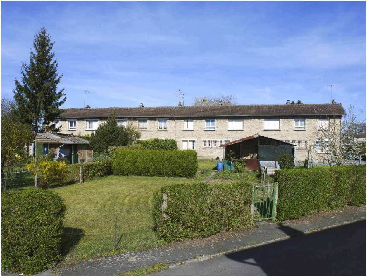
Maison à quatre unités d'habitation (10-13, rue de Verdun). Vue de situation avec les jardins au premier plan, depuis la rue de la Somme.