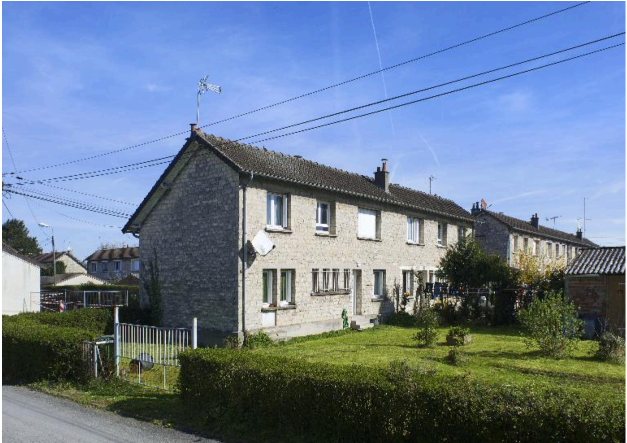
Maison à deux unités d'habitation (4-6 rue de Verdun). Vue de trois-quarts des façades arrière sur jardin, depuis la rue Général-Foch.