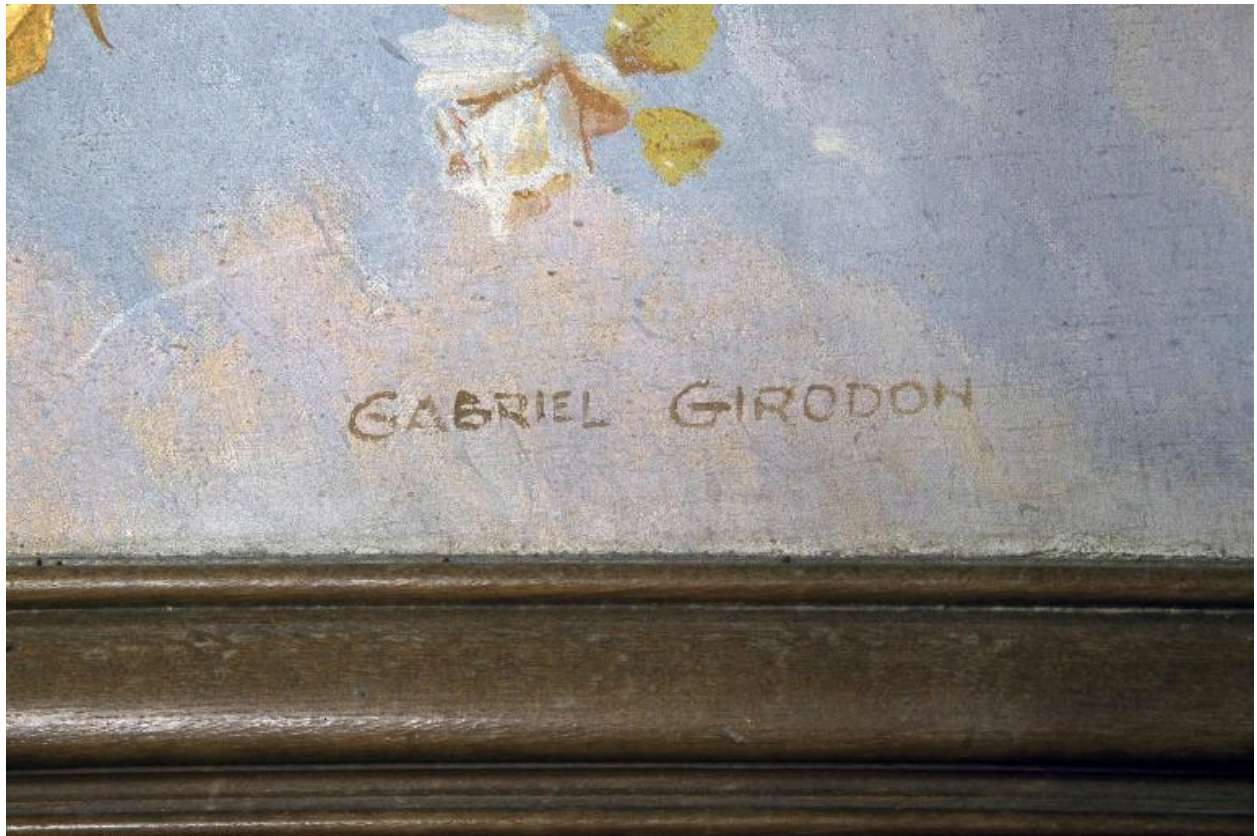
Détail du tableau : vue de la signature du peintre.