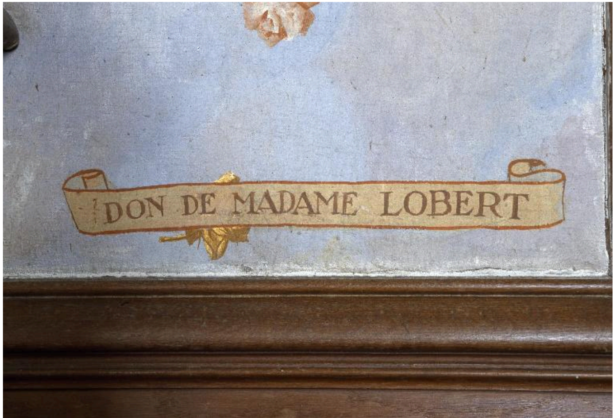
Détail du tableau : vue du phylactère portant le nom de la donatrice.