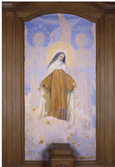
Vue générale du tableau.