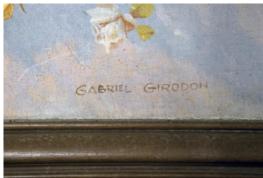
Détail du tableau : vue de la signature du peintre.