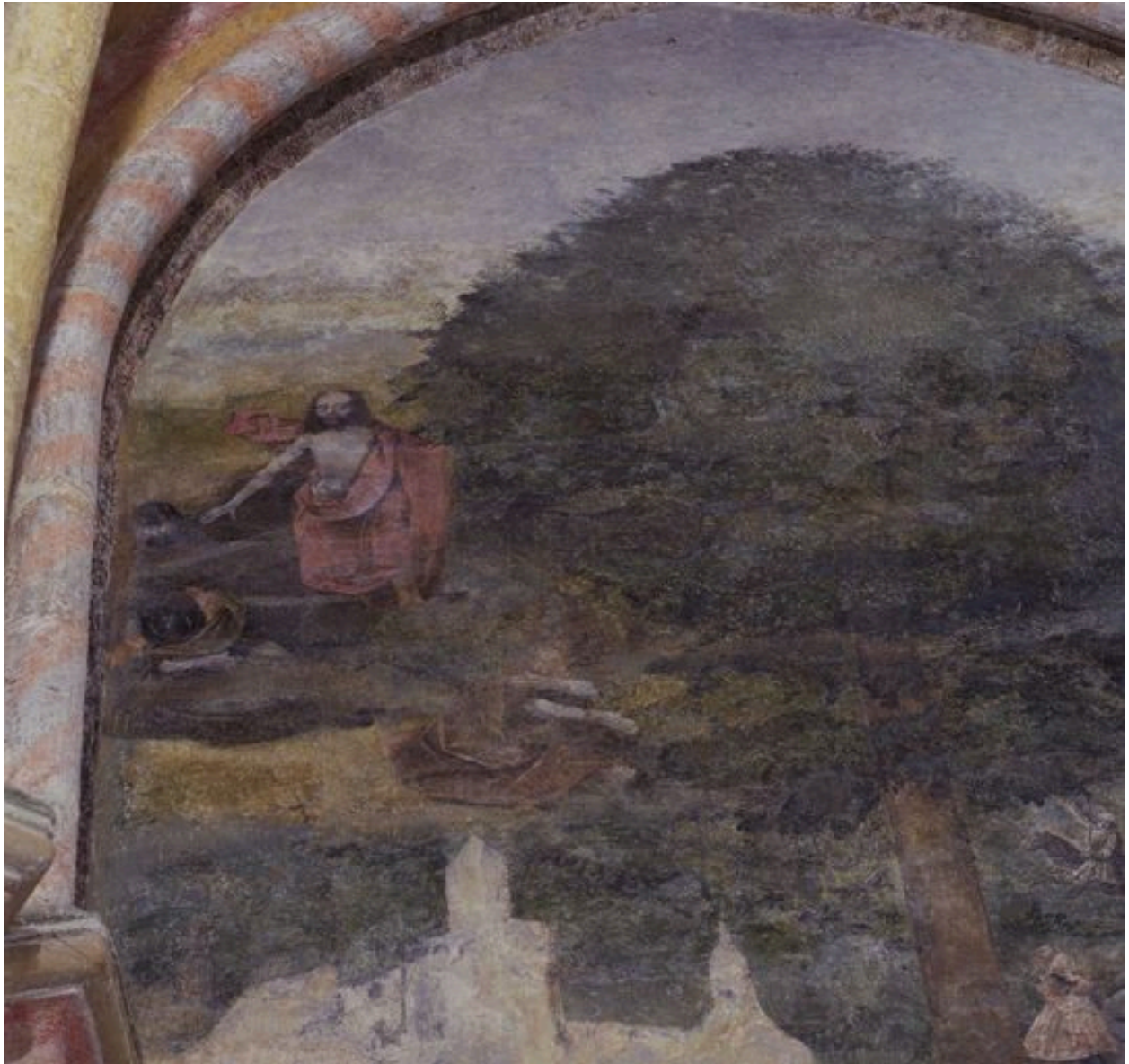
Christ ressuscité : détail.