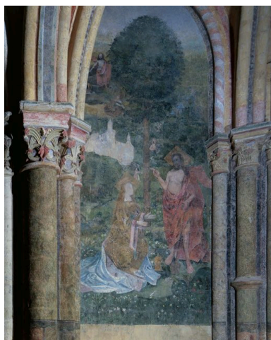
Vue générale. IVR22_19976000301VA