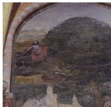
Christ ressuscité : détail. IVR22_19976000298XA