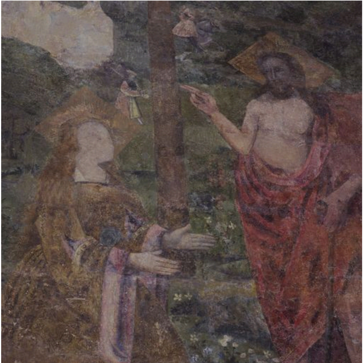
Noli me tangere : détail.