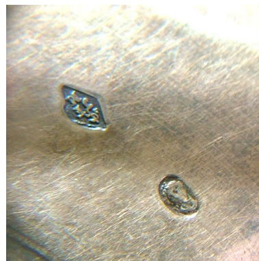
Détail de la patène : poinçon de maître et poinçon d'association des orfèvres de Paris.

Phot. Frédéric Fournis IVR22_20108001338NUCA