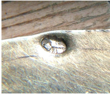
Détail de la patène : poinçon de grosse recense pour les départements, 1819-1838.

IVR22_20108001379NUCA