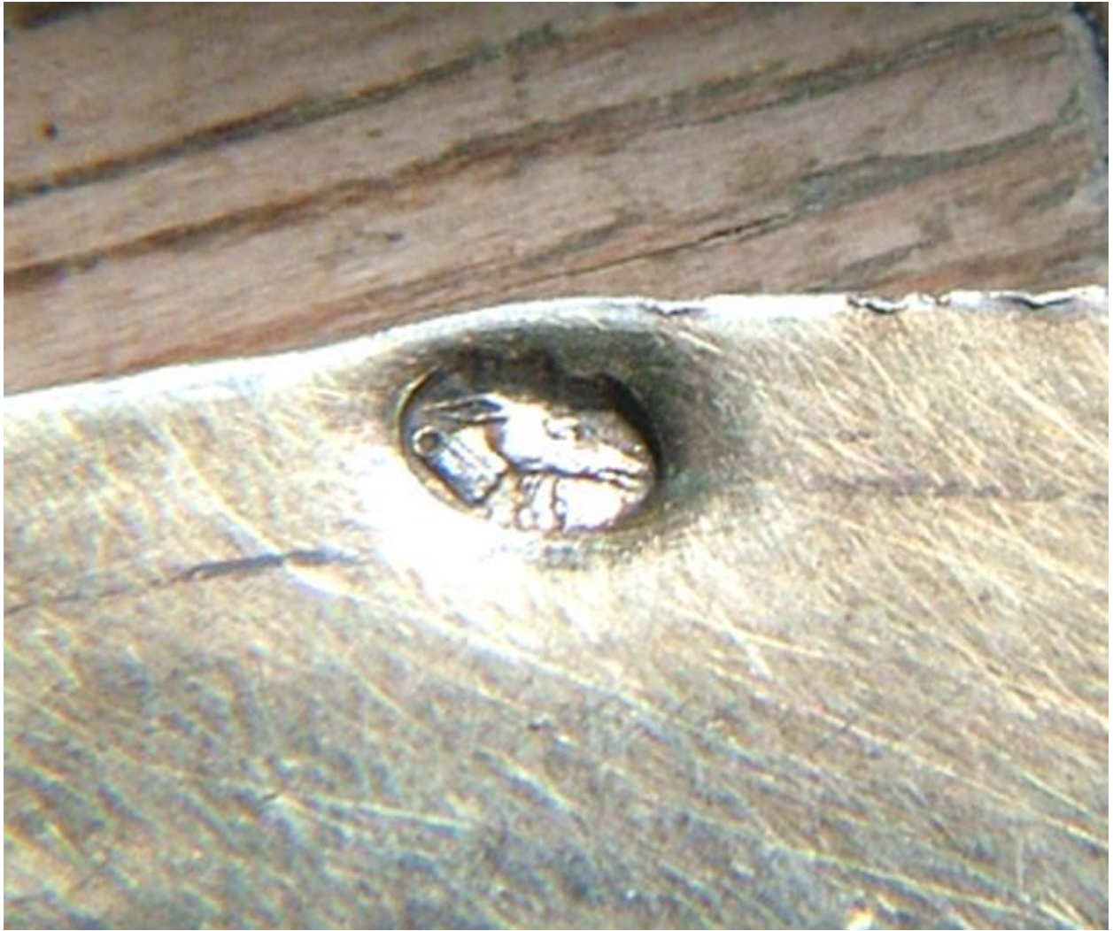
Détail de la patène : poinçon de grosse recense pour les départements, 1819-1838.