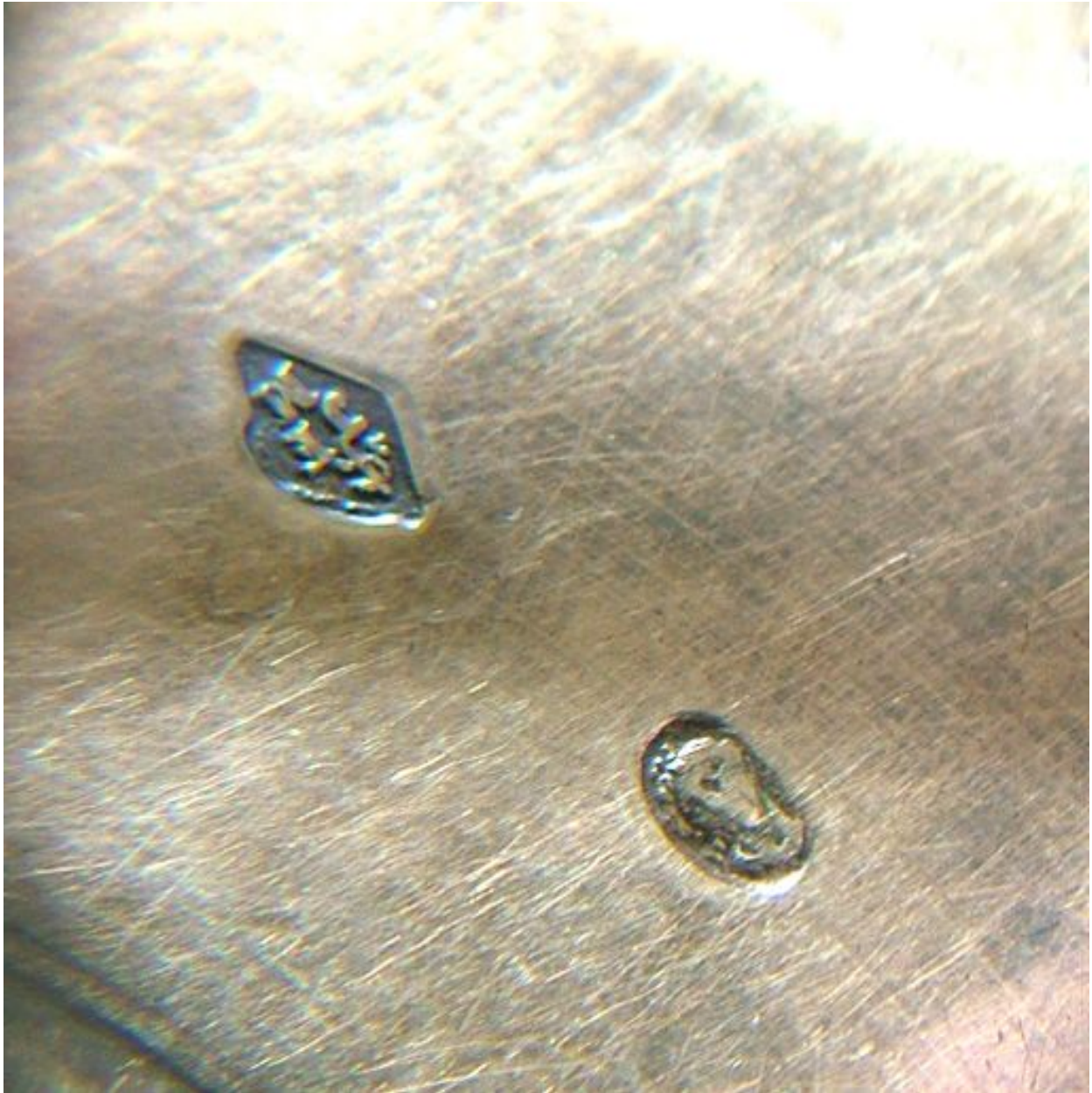
Détail de la patène : poinçon de maître et poinçon d'association des orfèvres de Paris.