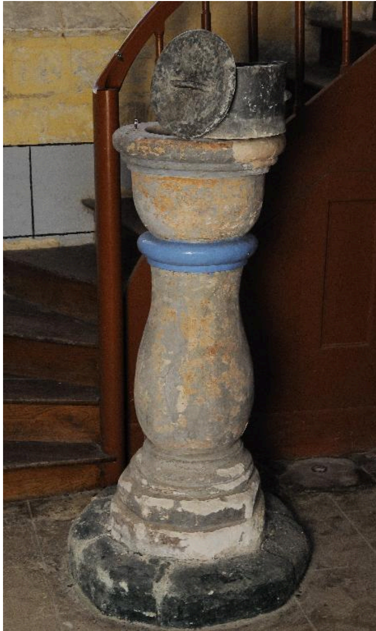
Vue des fonts baptismaux et de la réserve baptismale formant garniture.