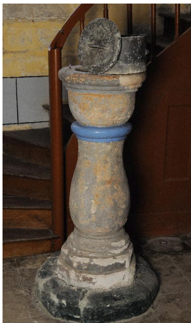
Vue des fonts baptismaux et de la réserve baptismale formant garniture.