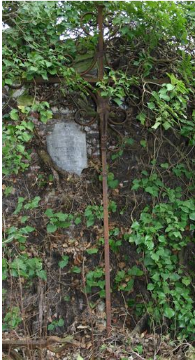
Croix funéraire (fer forgé).