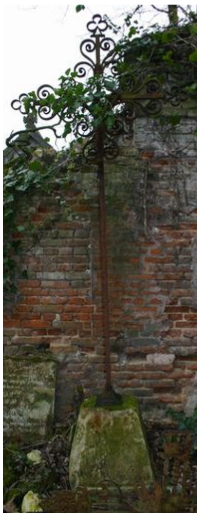
Croix funéraire (fer forgé).