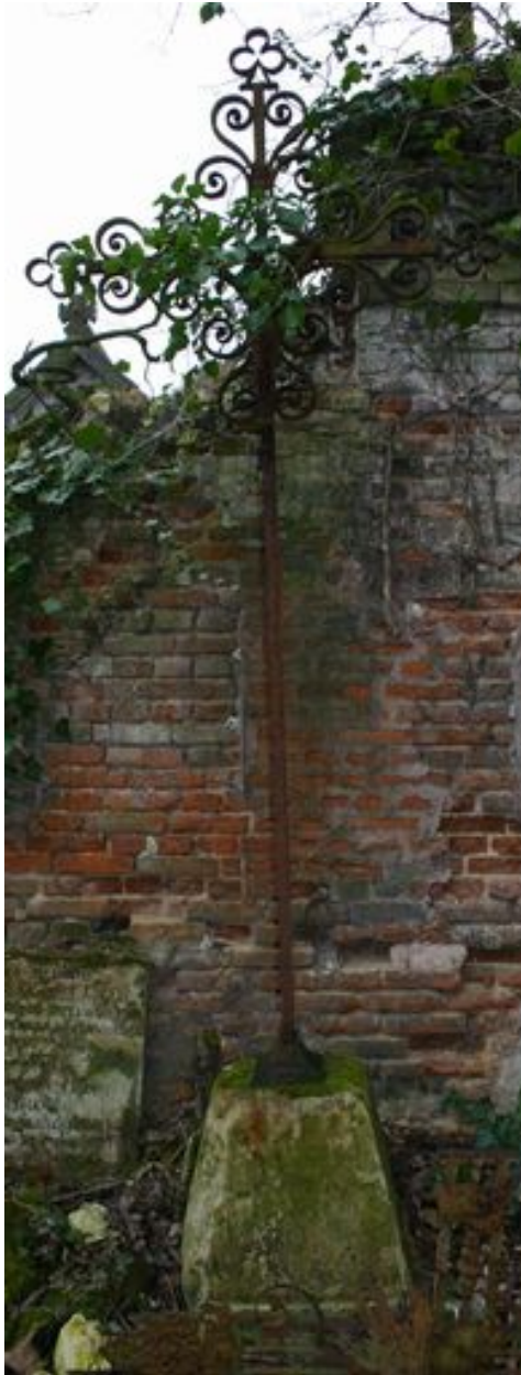
Croix funéraire (fer forgé).