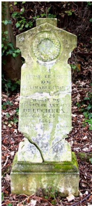
Stèle funéraire, vers 1864.