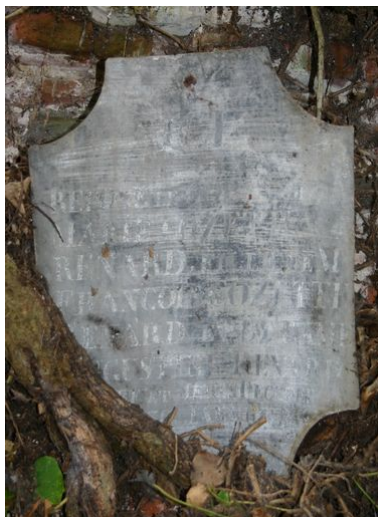
Plaque en zinc.