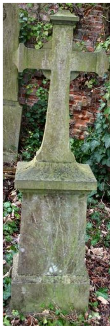
Croix funéraire en pierre, vers 1881.