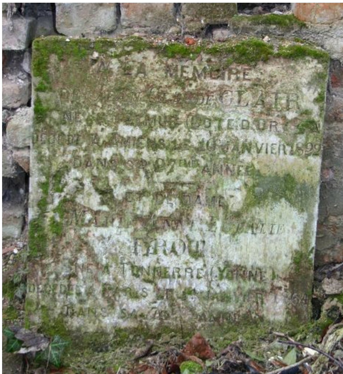
Vestiges d'une stèle rectangulaire (?)