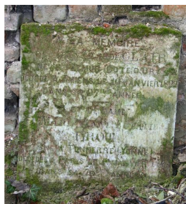
Vestiges d'une stèle rectangulaire (?)