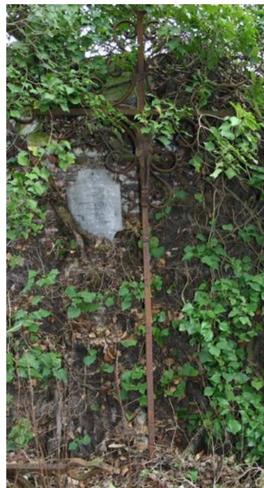
Croix funéraire (fer forgé). IVR22_20068000948NUCA