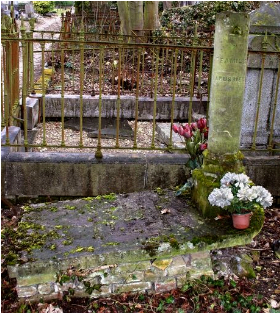
Stèle funéraire couchée sur un soubassement en briques, vers 1858.