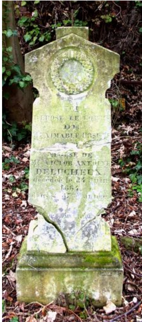
Stèle funéraire, vers 1864.