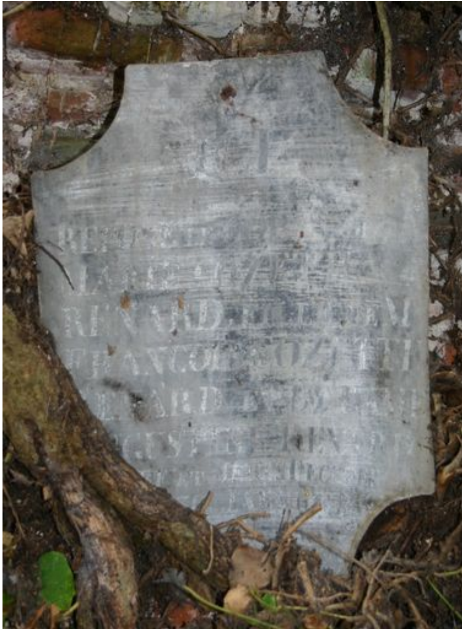
Plaque en zinc.