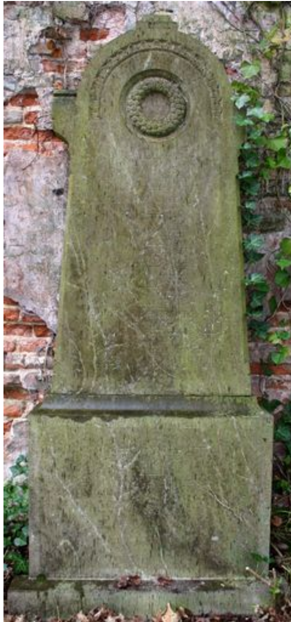
Stèle funéraire de la famille Corblet-Turpin, vers 1894.