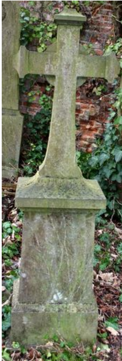
Croix funéraire en pierre, vers 1881.