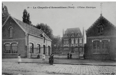
La Chapelle-d'Armentières. Vue générale de l'usine électrique. Carte postale, photographe inconnu, B.F. Paris éd., [ca 1900] (coll. part.). IVR31_19885902176X