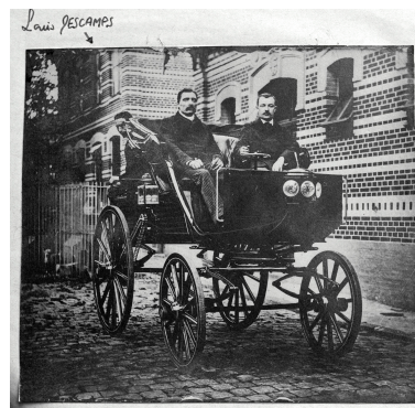
Le "Phaéton", [ca 1893]