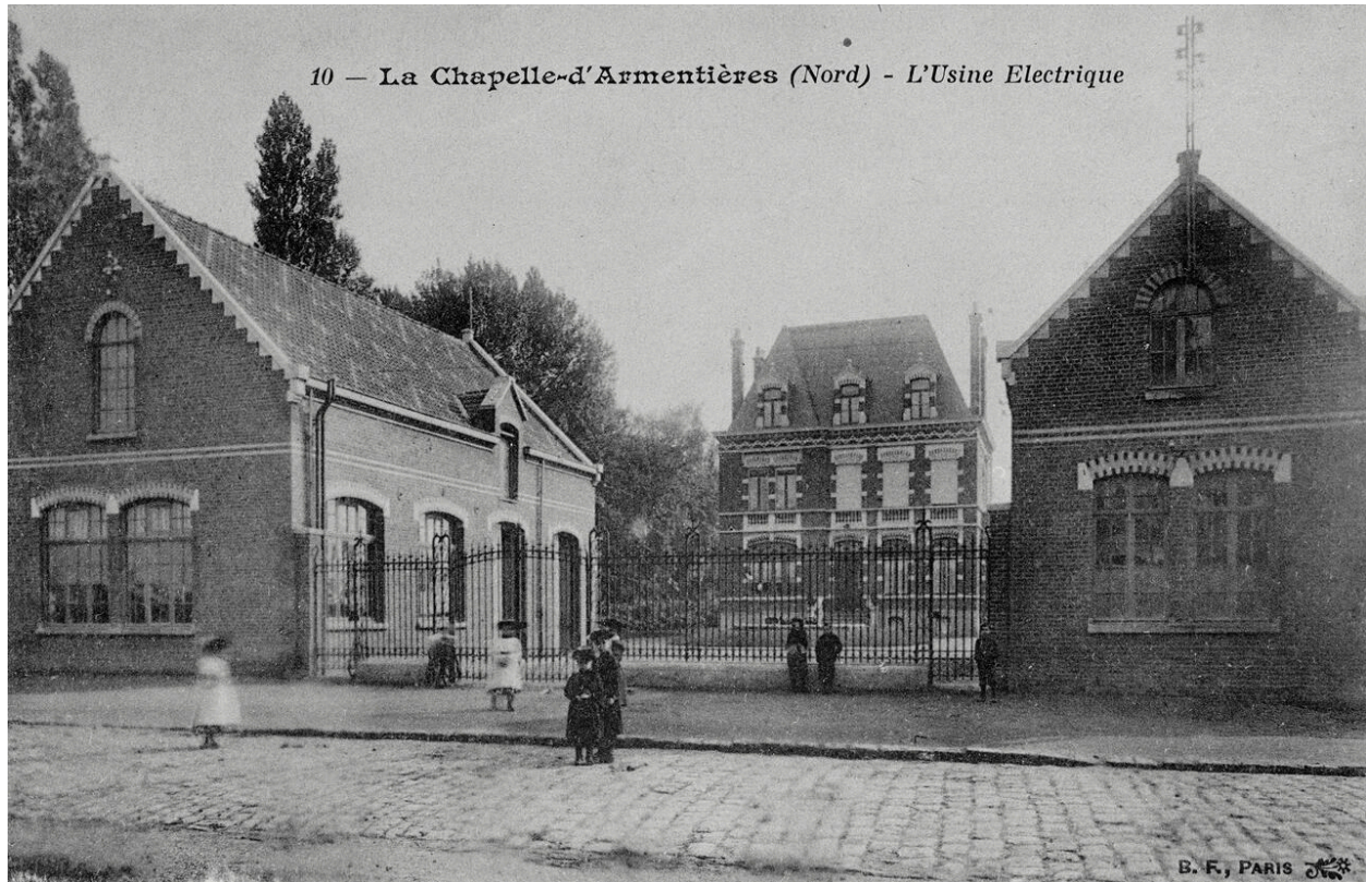
La Chapelle-d'Armentières. Vue générale de l'usine électrique. Carte postale, photographe inconnu, B.F. Paris éd., [ca 1900] (coll. part.).