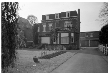
Logement patronal, élévation postérieure. IVR31_19885902199X