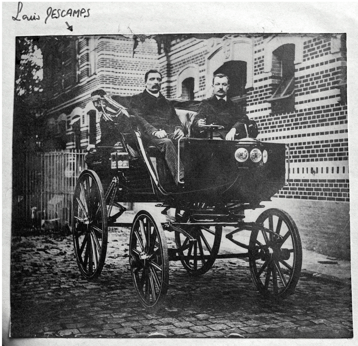
Le "Phaéton", [ca 1893] (AP Delepoule, La Chapelle-d'Armentières).