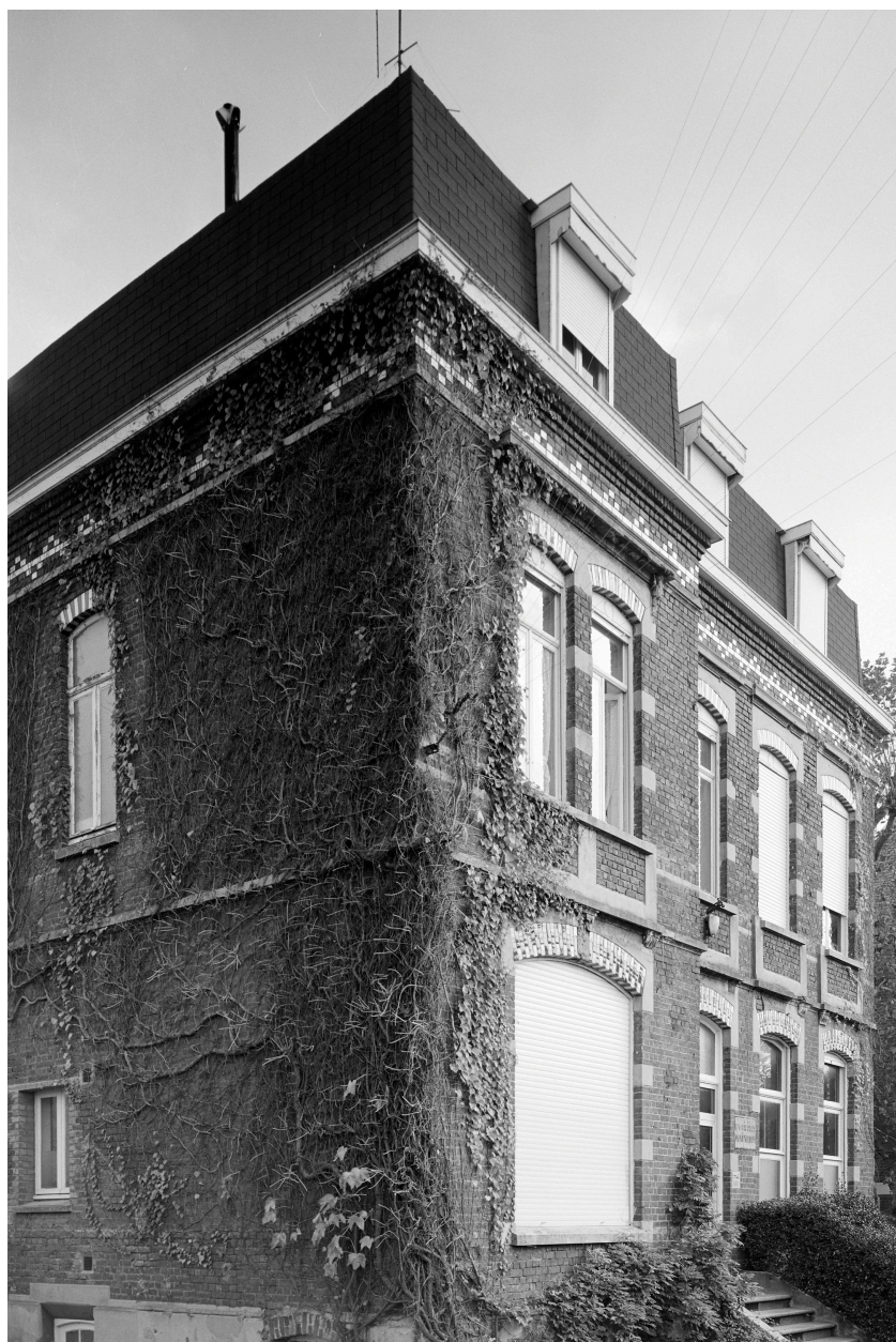
Logement patronal, élévation antérieure.