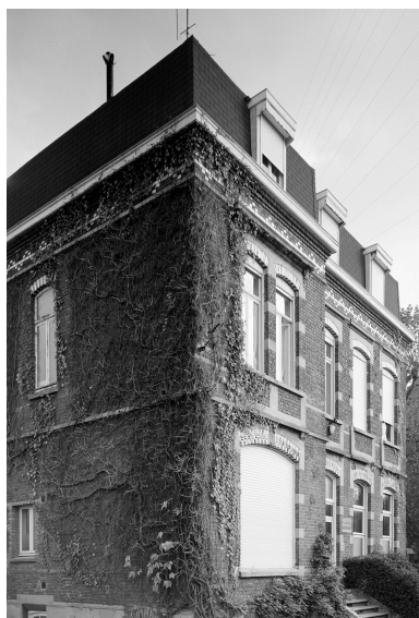
Logement patronal, élévation antérieure.