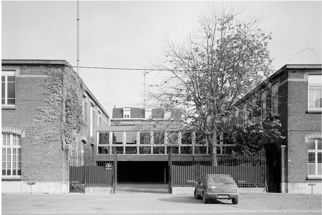
Ateliers de fabrication, logement patronal, élévation antérieure.