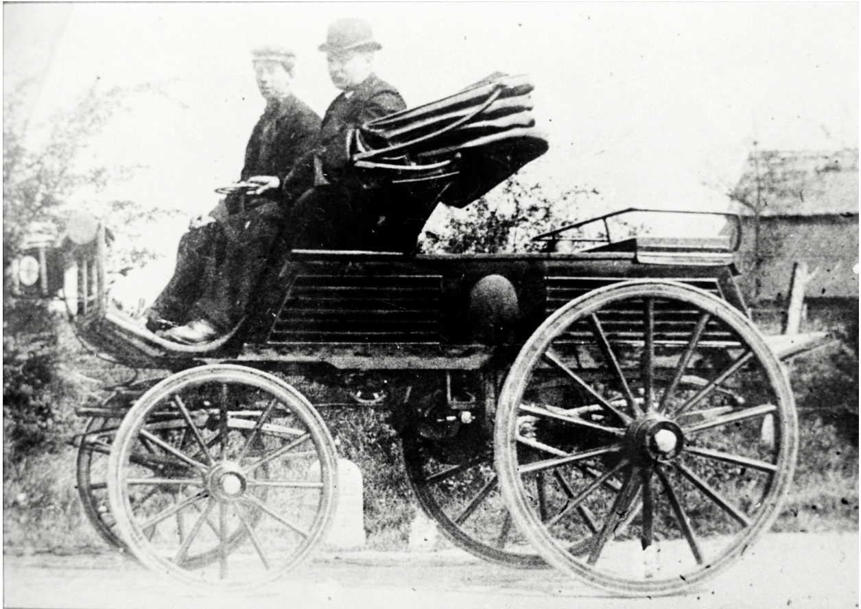
Le "Phaéton", [ca 1893] (AP Delepoulle, La Chapelle-d'Armentières).