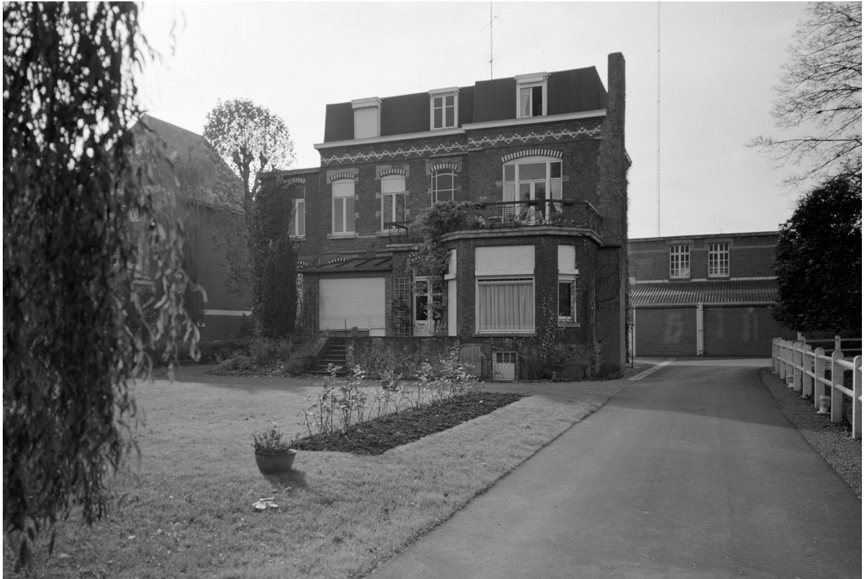
Logement patronal, élévation postérieure.