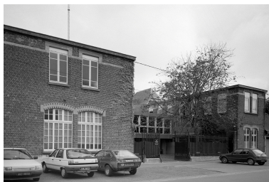
Ateliers de fabrication, élévation antérieure. IVR31_19885902196X