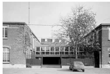
Ateliers de fabrication, logement patronal, élévation antérieure. IVR31_19885902195X