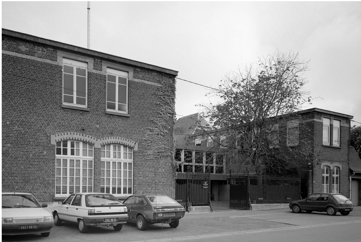
Ateliers de fabrication, élévation antérieure.